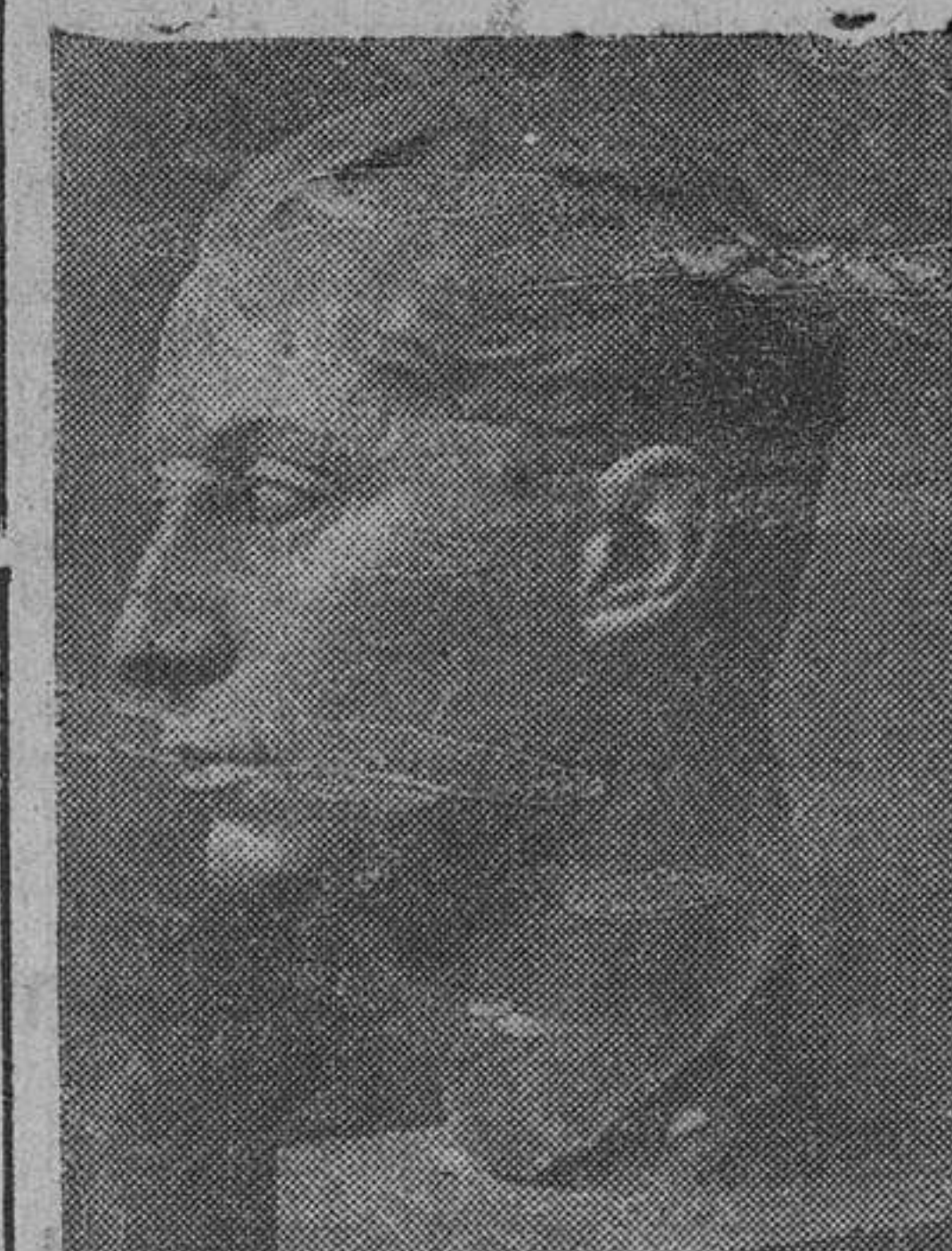
Magnífico busto de José Antonio, realizado por el gran escultor Aladrén, por encargo del excelentísimo Ayuntamiento de Madrid, al que será entregado en el día de hoy

HACIENDA.—Orden disponiendo que, de conformidad con el artículo tercero de la Ley de 15 de Octubre de 1938, sobre restauración provisional de contabilidad bancaria, en el plazo de quince días se procederá a la constitución de Comités de cuentas corrientistas con las funciones que determina el artículo sexto de dicha ley y a los fines de la aplicación del capítulo segundo de la misma, en las oficinas bancarias que a continuación se reseñan: