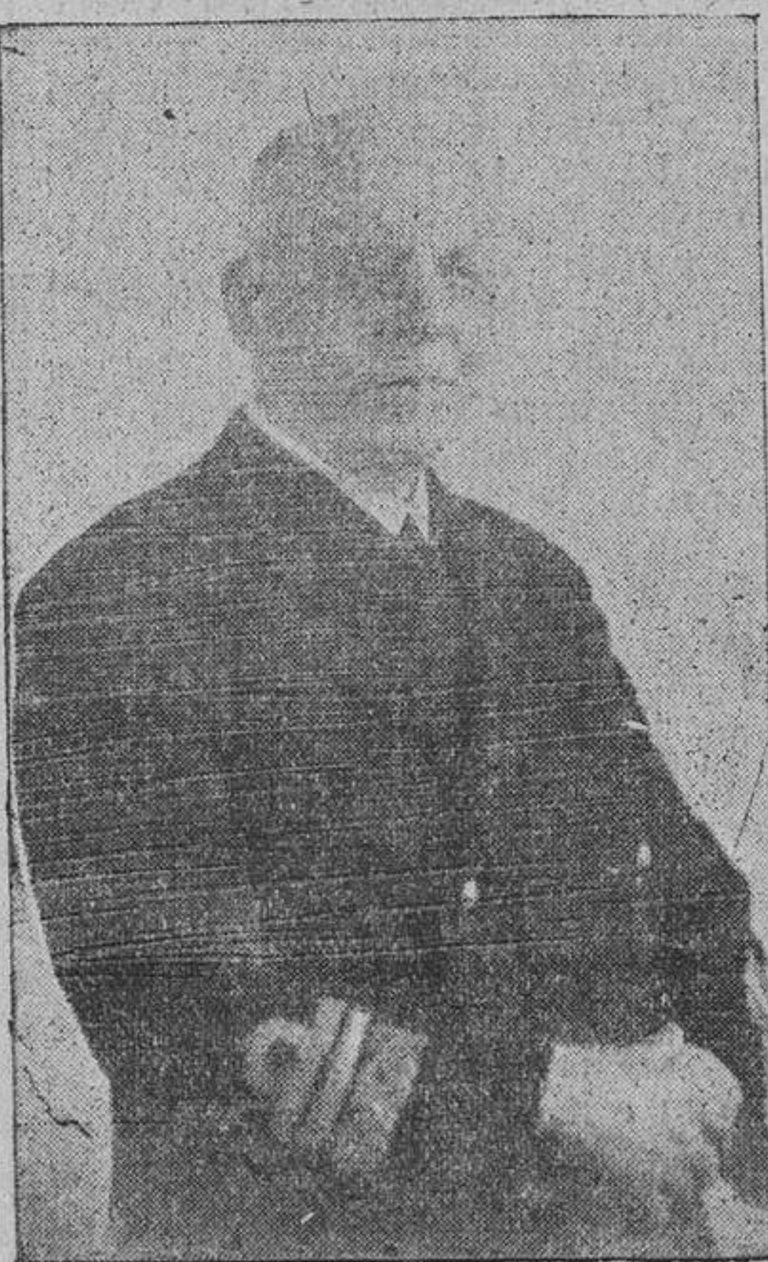
El Almirante Cervera

A las once y media: Solemne funeral en la iglesia parroquial de Nuestra Señora del Carmen y responso por el ilustrísimo señor Obispo de la diócesis. Seguidamente, exposición de la imagen de Nuestra Señora en el altar de la iglesia, con objeto de que pueda ser visitada por el público y