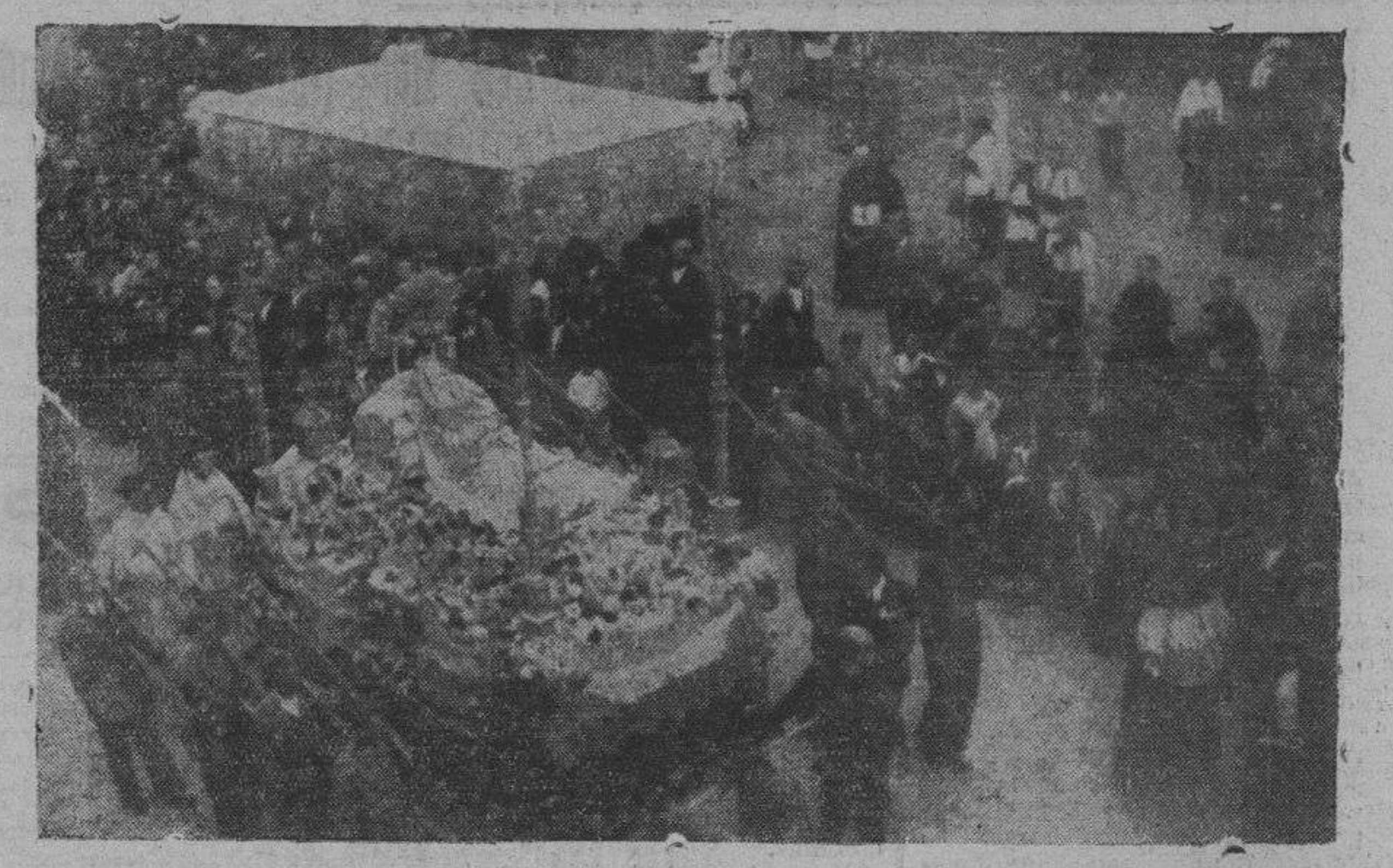
La sagrada imagen desfila por las calles zamoranas, entre los fervores del pueblo

El domingo último celebró Zamora la fiesta de Cristo Rey. Fiesta sublime, magnífica, inolvidable. La población apareció engalanaada con colgaduras y banderas, en su mayor parte con emblemas y dedicatorias al Corazón Sacratísimo de Jesús y, a su vez, ante la imagen del Corazón Delfico, se celebraron numerosas misas y