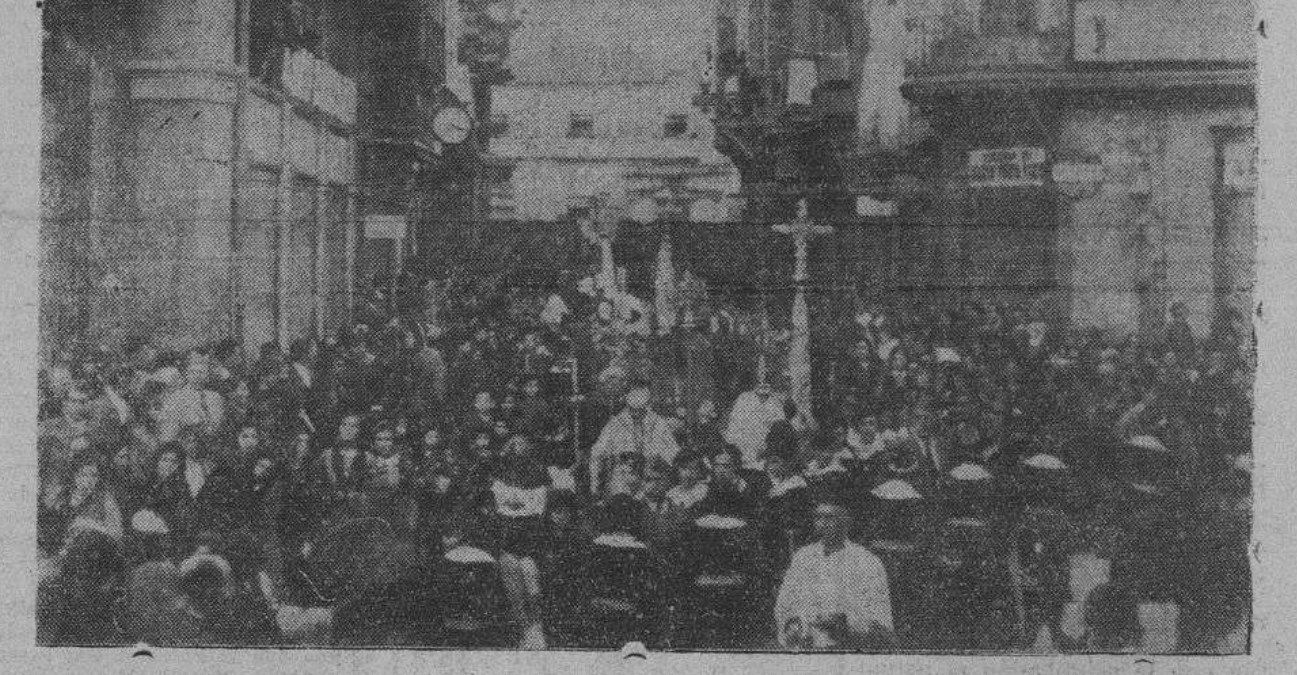
Un aspecto de la procesion de la Santísima Virgen del Tránsito

de la Catedral la venerada y zamorana imagen de la Santísima Virgen del Tránsito, nuestra patrona amada, para ser trasladada a su iglesia. No hay pluma ni cabeza capaz de describir acto tan sublime, impresionante y grandioso, en el que tomó parte Zamora en pleno. Los enfermos que no pudieron abandonar el lecho del dolor, si no salieron a la calle a formar parte de la humana avalancha que se apiñaba por todas partes para alabar