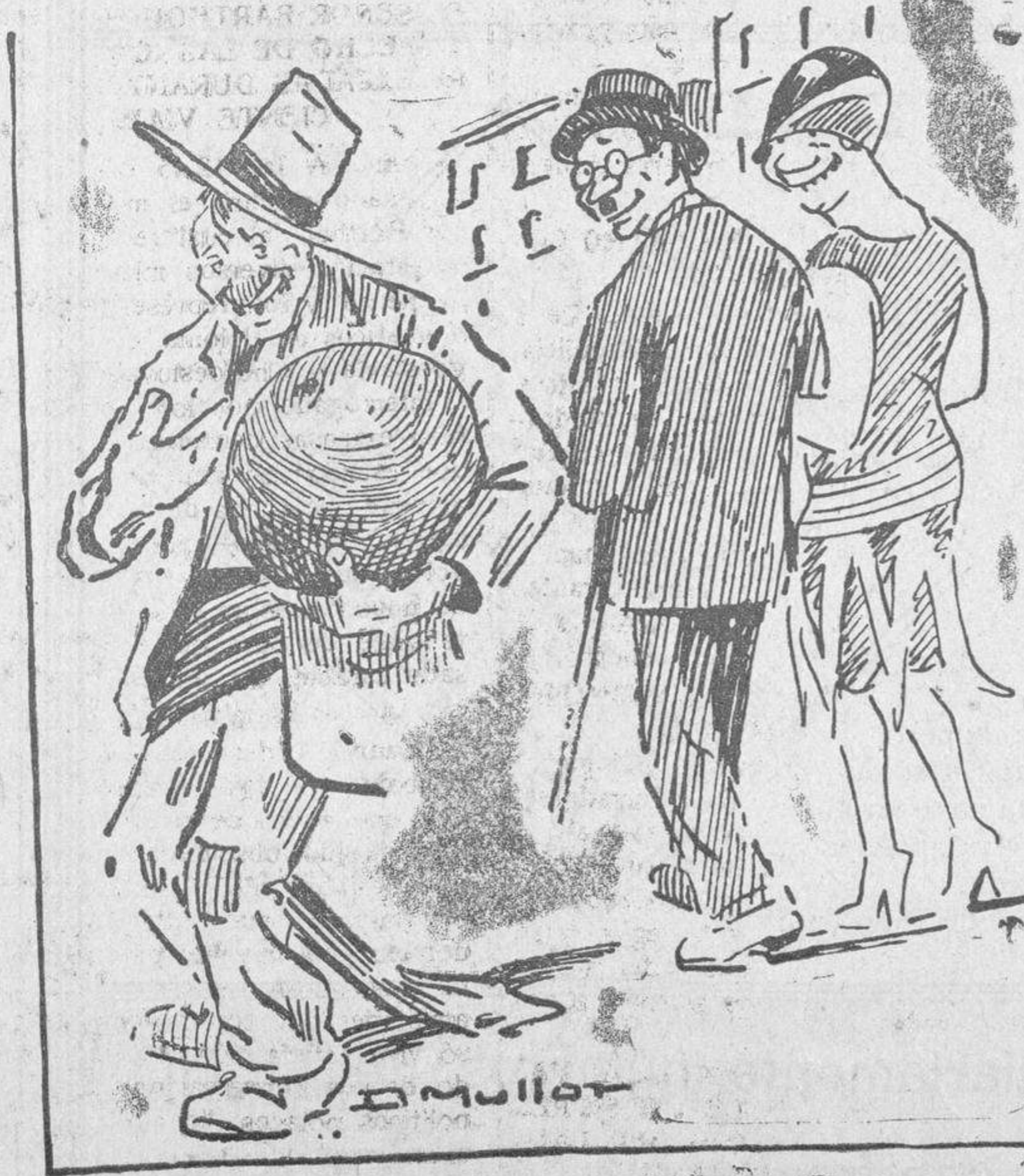
—Mira qué "chispa" lleva ese hombre. El borracho.—Dice que llevo una chispa, y me traigo la más grande del pueblo!

El Presidente del Consejo, señor Samper, pronunció un breve dis-