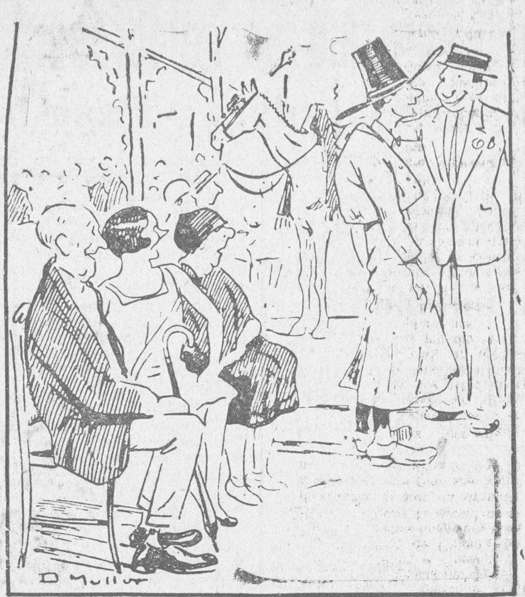
—Mira, papá, lo bien que le cae a mi novio el traje corto. Todos dicen que parece que siempre lo ha llevado puesto. —Bueno. Pero eso lo dicen porque lleva un traje muy usado...

Recupera la vista después de diecinueve años New-York.—Una niña que se había quedado ciega a los dos años de edad, a consecuencia de un ataque de parálisis infantil, ha recuperado inesperadamente la vista a los veintinueve años, después de haber sido educada en un Instituto para ciegos. El caso llama mucho la atención de los especialistas.