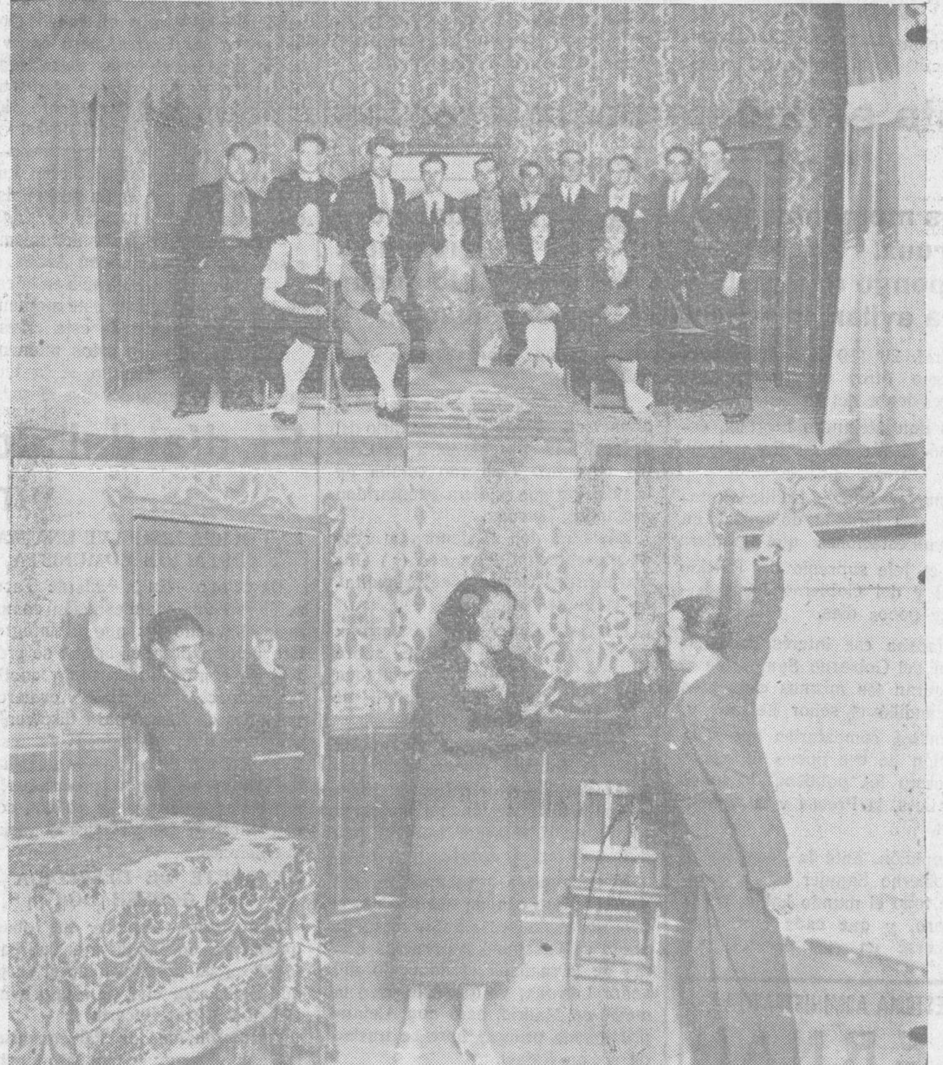
Arriba, el Cuadro Artístico del Grupo Cultural Obrero; En la parte inferior, una escena del sainete «El porvenir del niño»

ESTRENO DE LA COMEDIA DRAMATICA, EN TRES ACTOS, «ODIO A LA GUERRA»