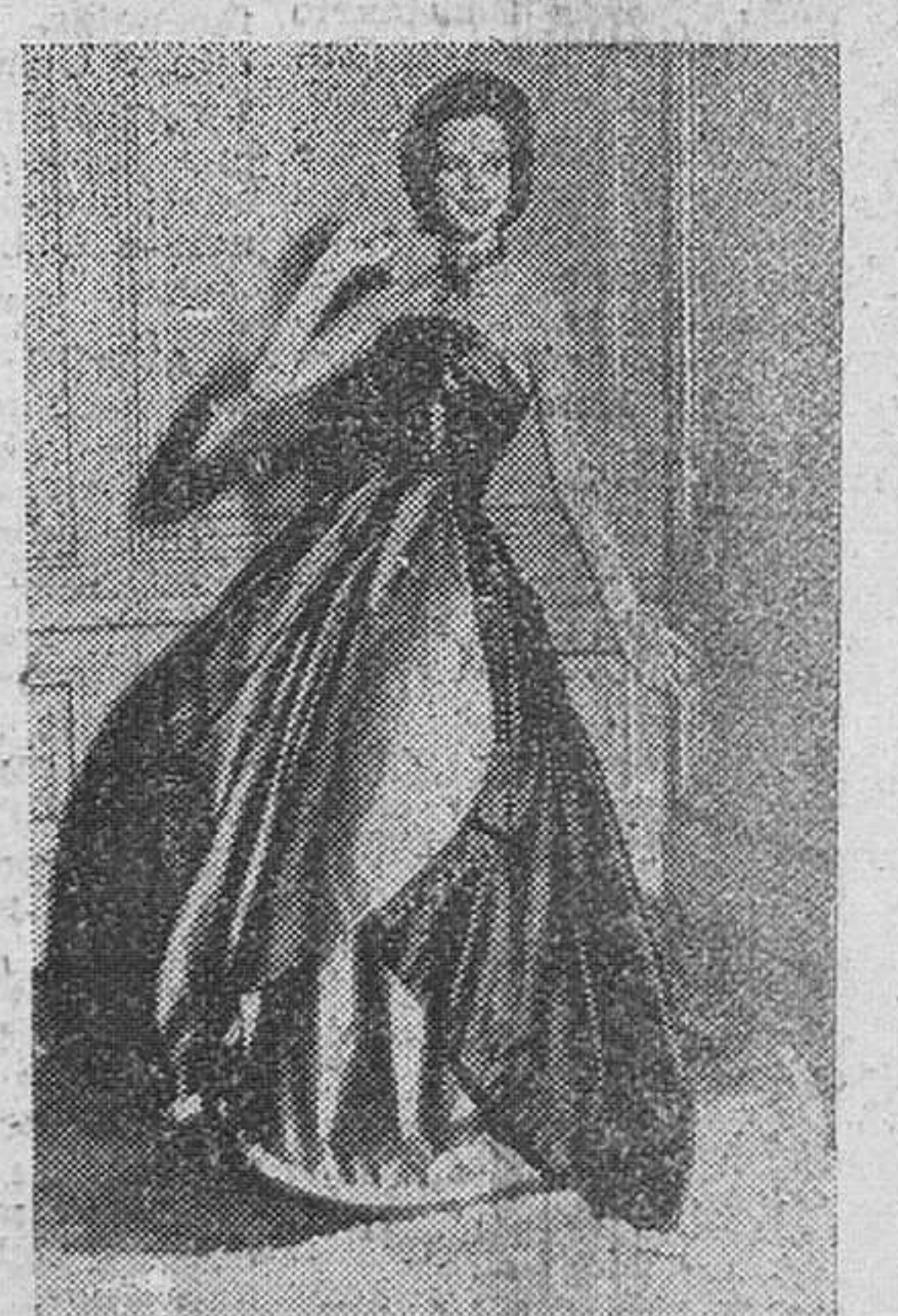
Sensación. Un elegantísimo modelo de Worth. Confeccionado en seda púrpura. Elegantísimo traje de noche con lazo verde esmeralda.