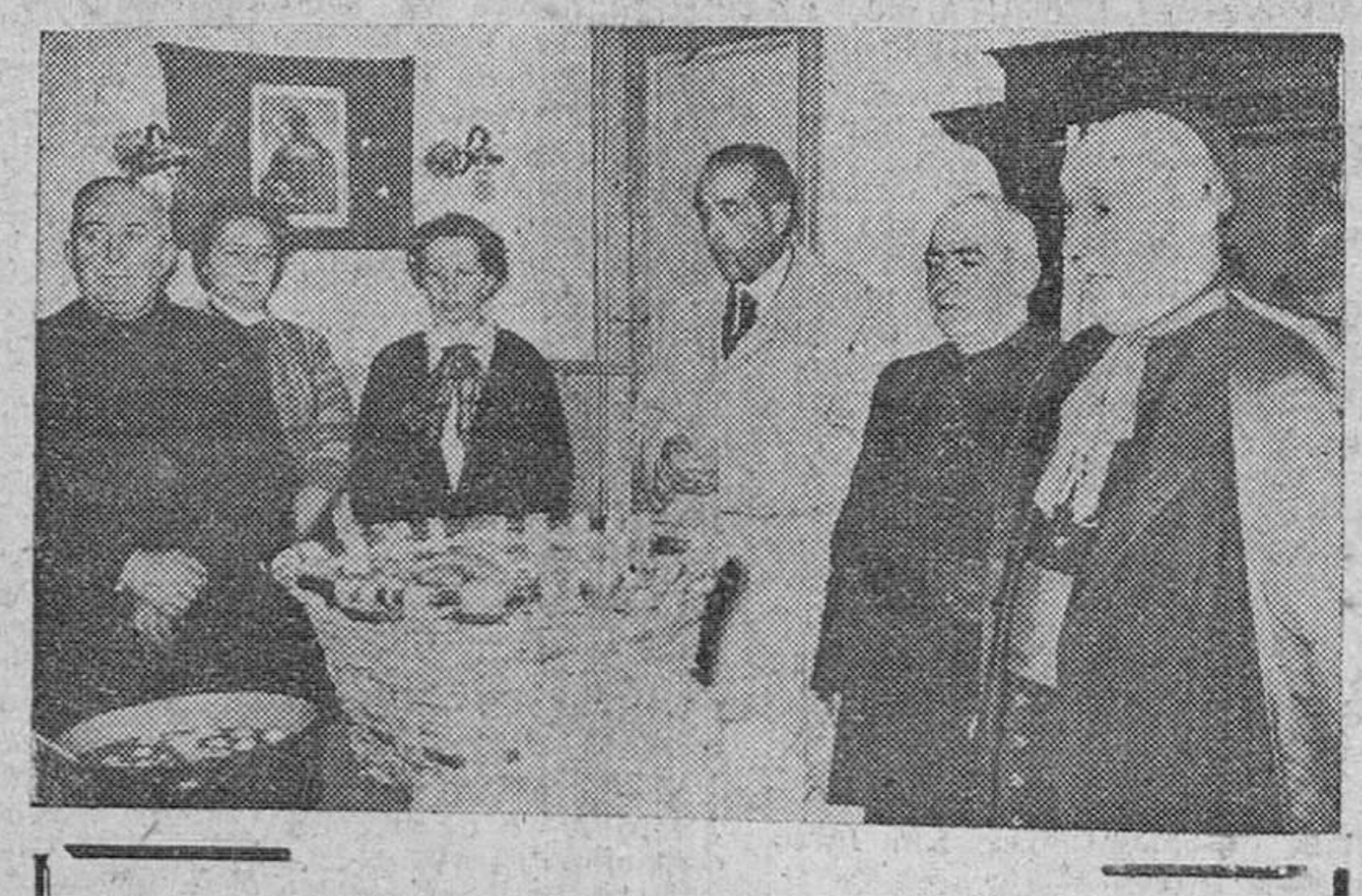
Ayer, a mediodía, quedó inaugurada la campaña 1956-57 en la Cocina de Caridad. He aquí el momento de la bendición de la comida, ceremonia en que actuó nuestro Rvdmo. Prelado.