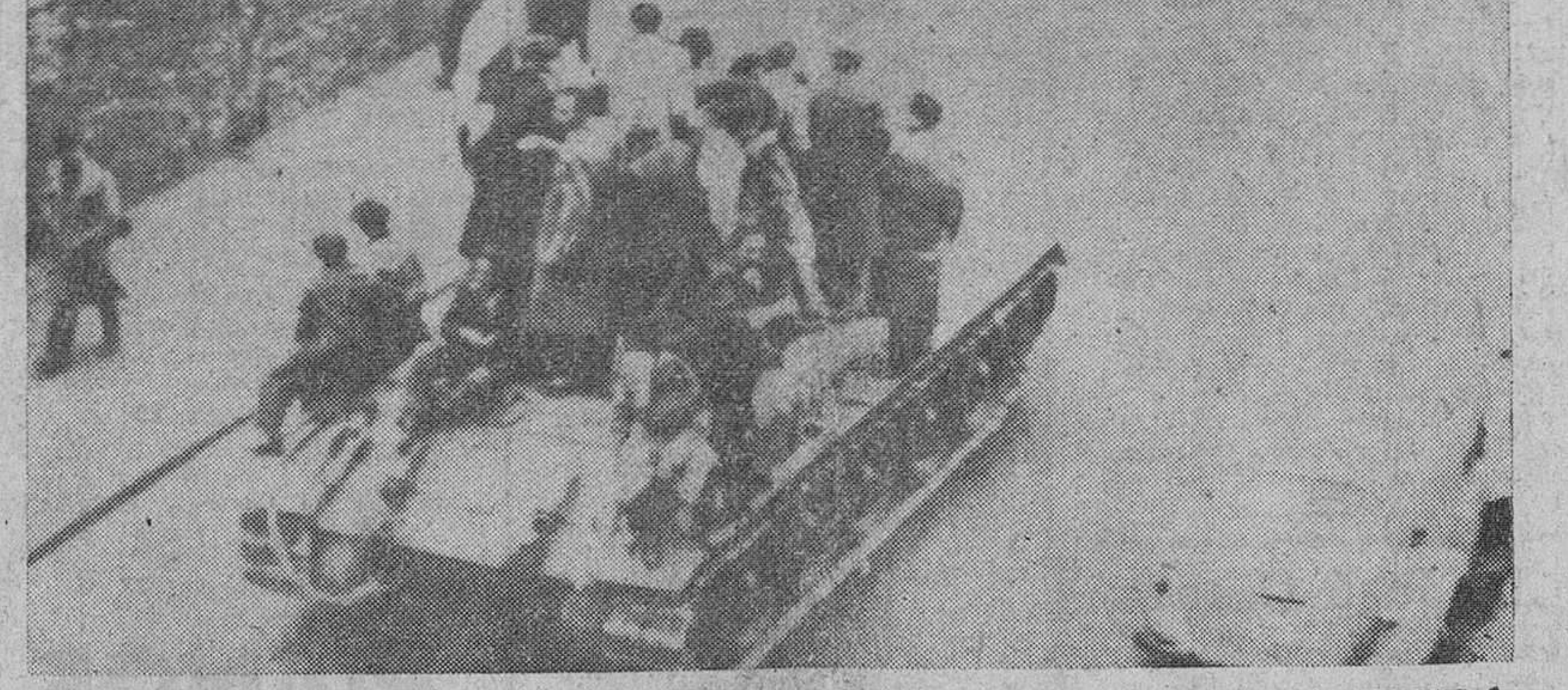
Budapest. — He aquí una de las primeras fotografías recibidas en Occidente por teléfono, de los disturbios antisoviéticos habidos en esta capital, en la que aparecen un grupo de manifestantes, duenos de un tanque militar, recorriendo las calles de la capital y ondeando una bandera húngara desposeída ya de los emblemas soviéticos.