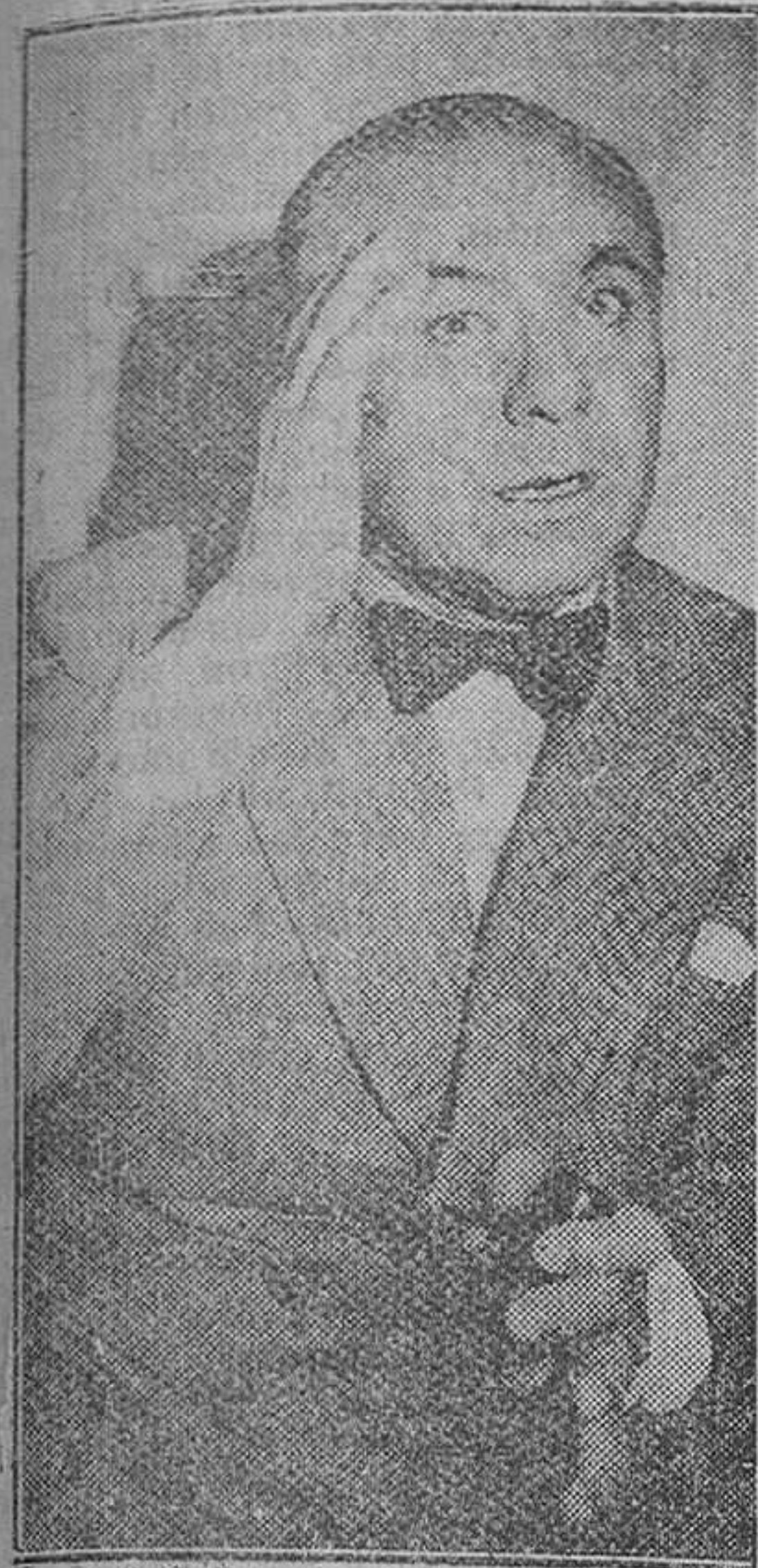
Madrid. — Un primer plano del famoso pianista español José Iturbi...