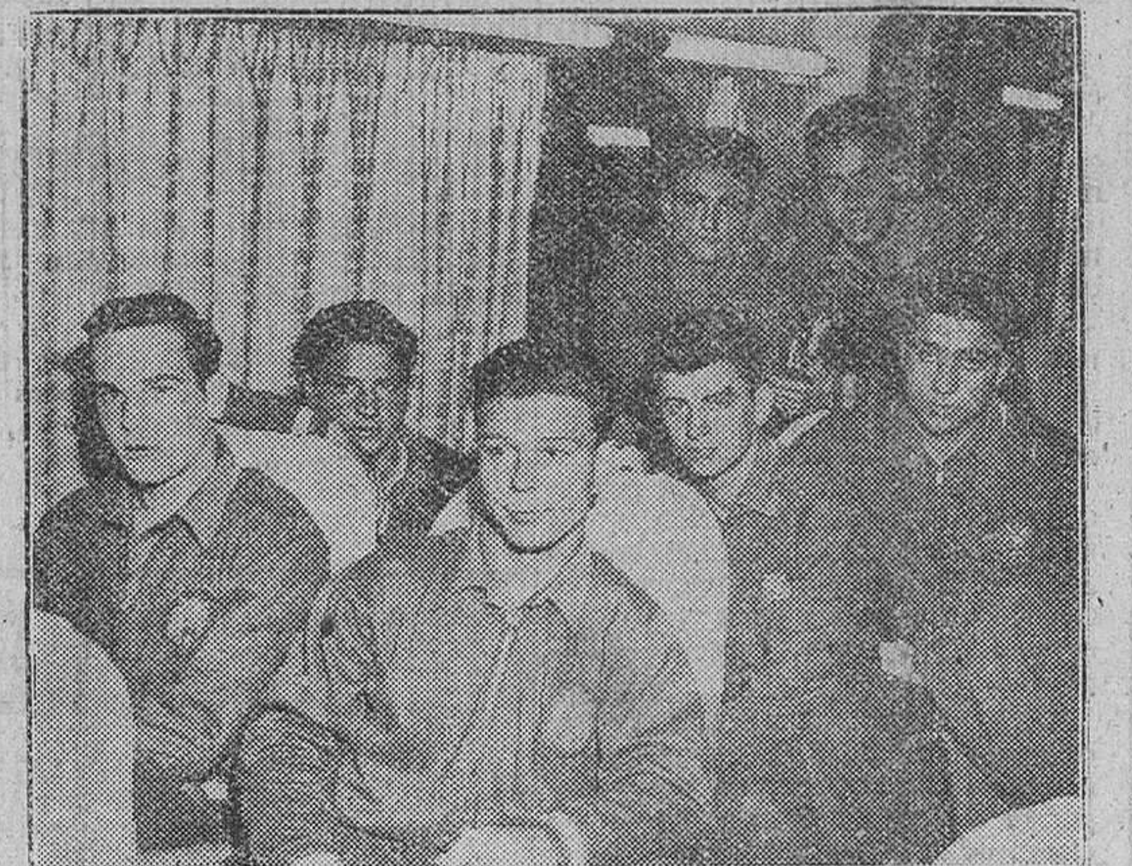
Madrid. — Los jugadores de la selección nacional de fútbol, que participará en el VII Torneo de Juveniles...

La selección nacional de fútbol juvenil sale para Alemania