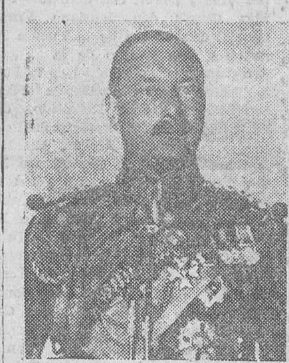
Con motivo del viaje de los Soboranos de Gran Bretaña, al África del Sur, el Duque de Gloucester, hijo menor del Rey Jorge V y actual gobernador de Australia sustituye a su hermano durante la ausencia de éste

El Duque de Gloucester sustituye a su hermano el Rey Jorge