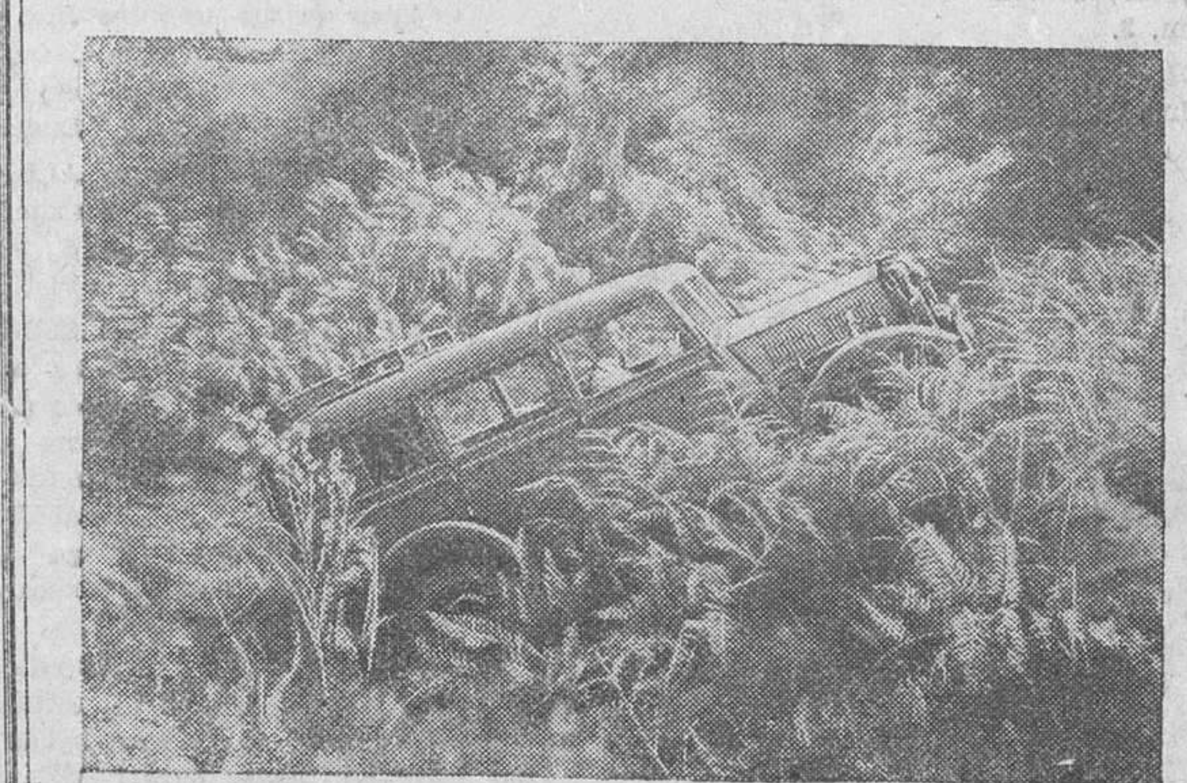
Los últimos modelos de coches, construidos en Inglaterra para trabajar en el campo, son sometidos a durísimas pruebas, una de ellas es al que puede verse en la fotografía en que uno de los coches, cruza los terrenos más abruptos