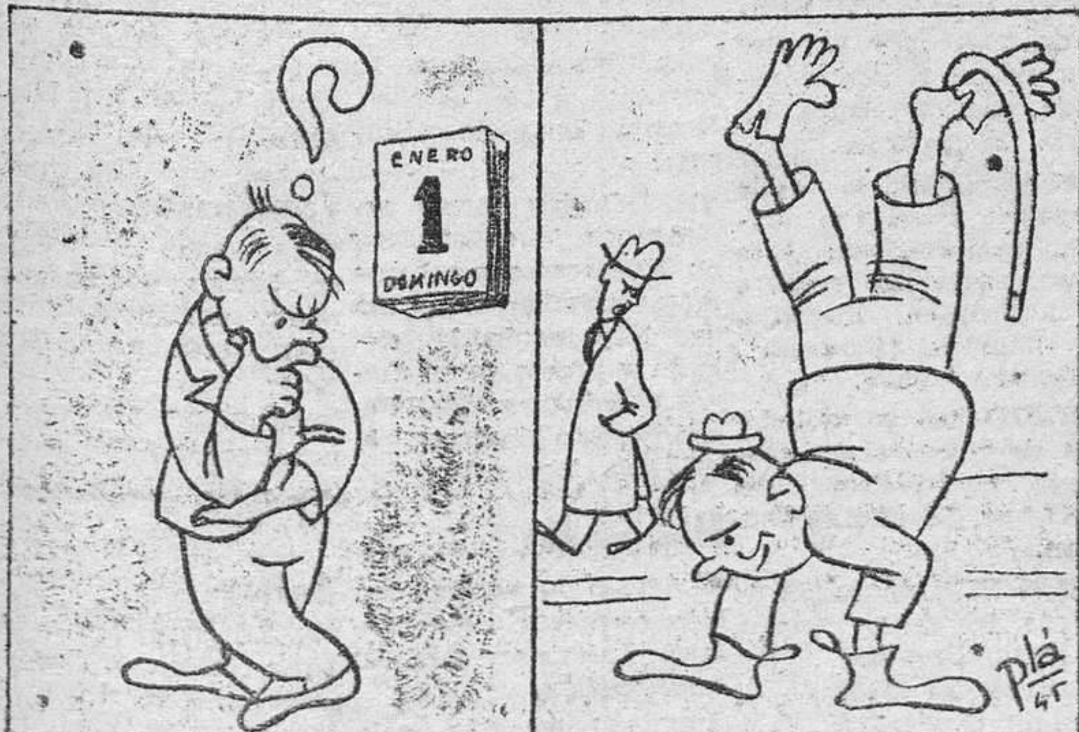
—Año nuevo, vida nueva.