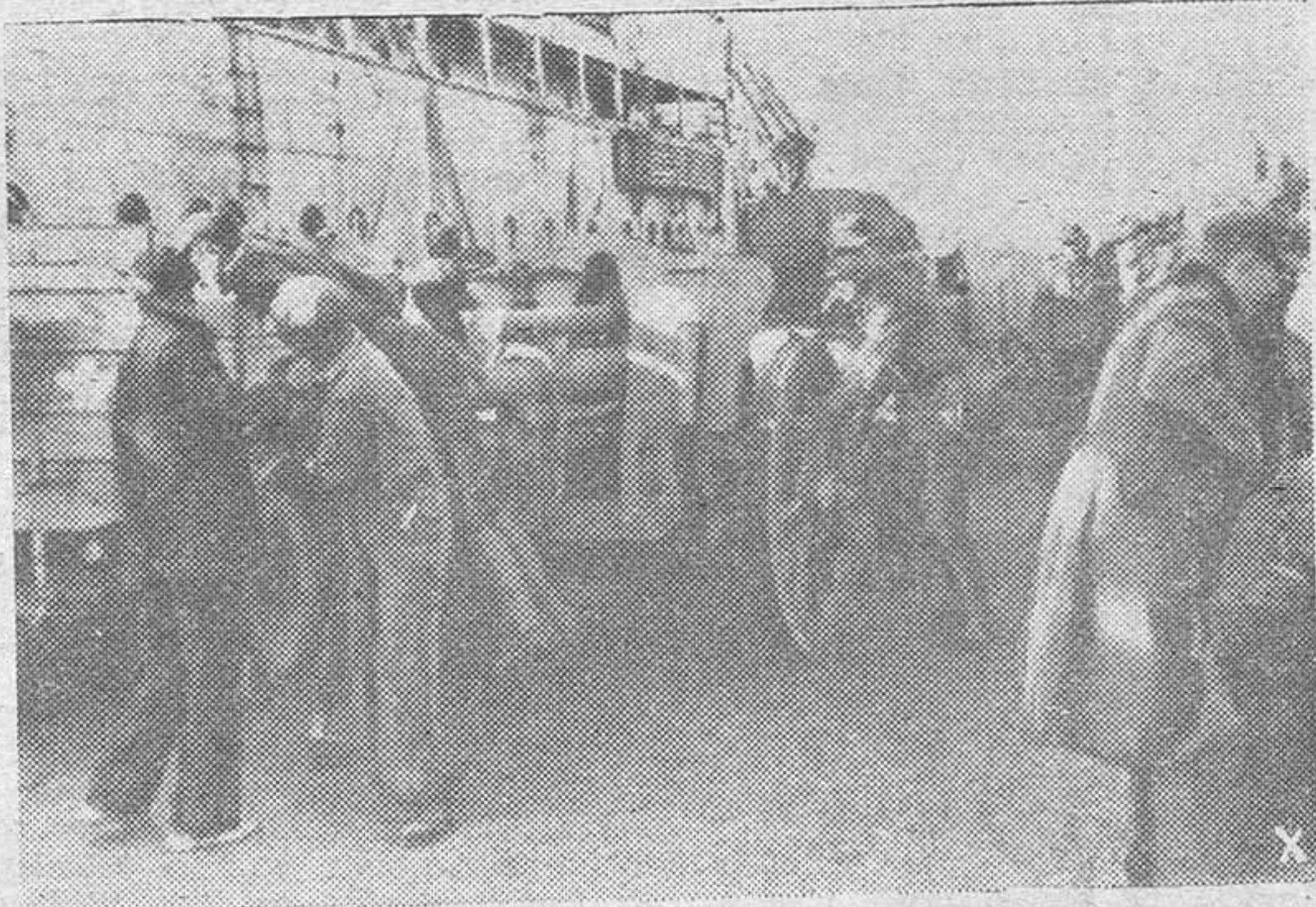
Constantemente llegan barcos del Eje a Túnez cargados de material bélico. Aquí vemos la descarga de piezas de artillería que entrarán pronto en acción contra las fuerzas anglo-norteamericanas.