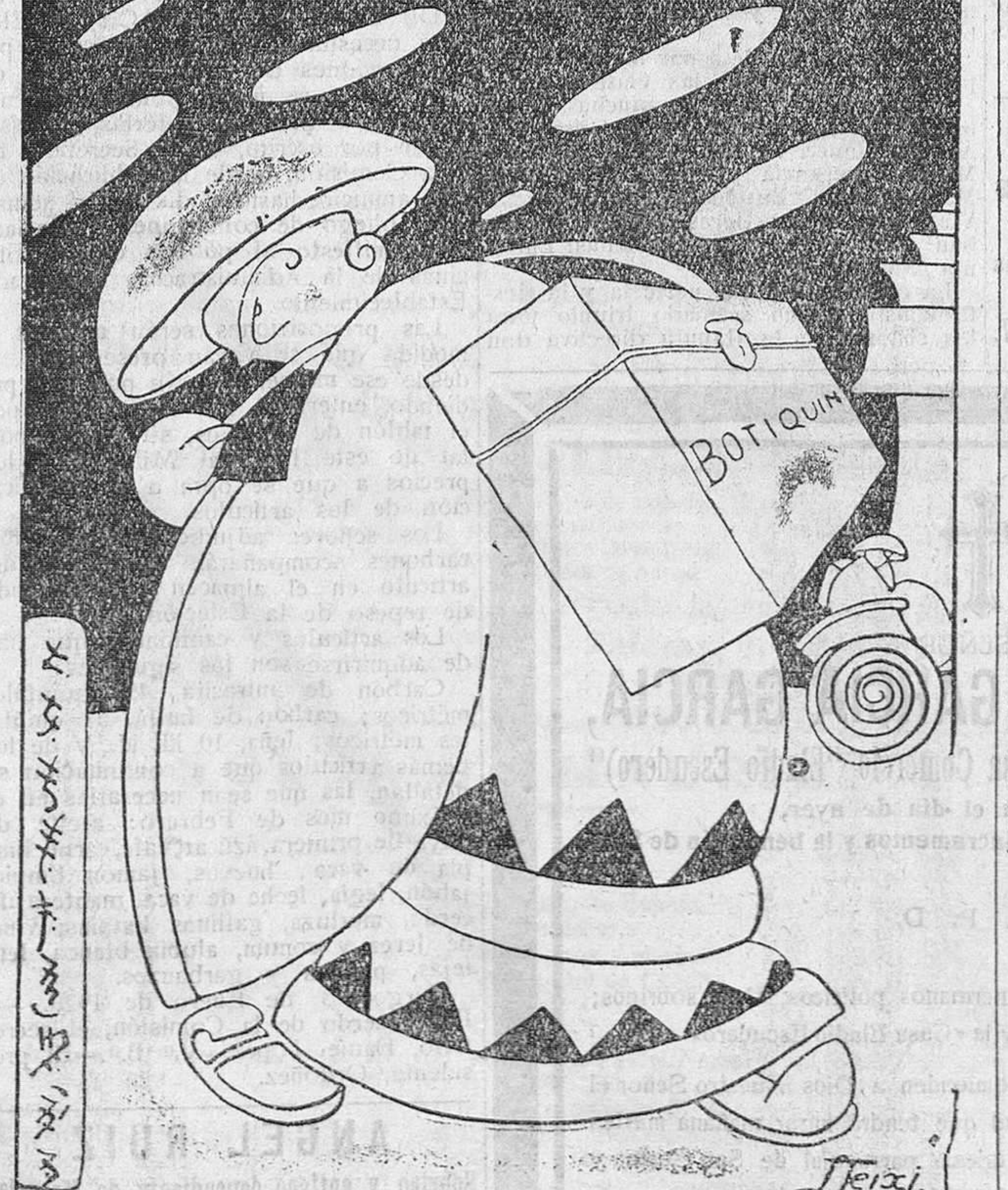
—Los servicios de la «Cruz amarilla» en Cantón fueron innecesarios, porque allí no quedaron ni los rabos.

ESTE NUMERO HA SIDO VISADO POR LA CENSURA