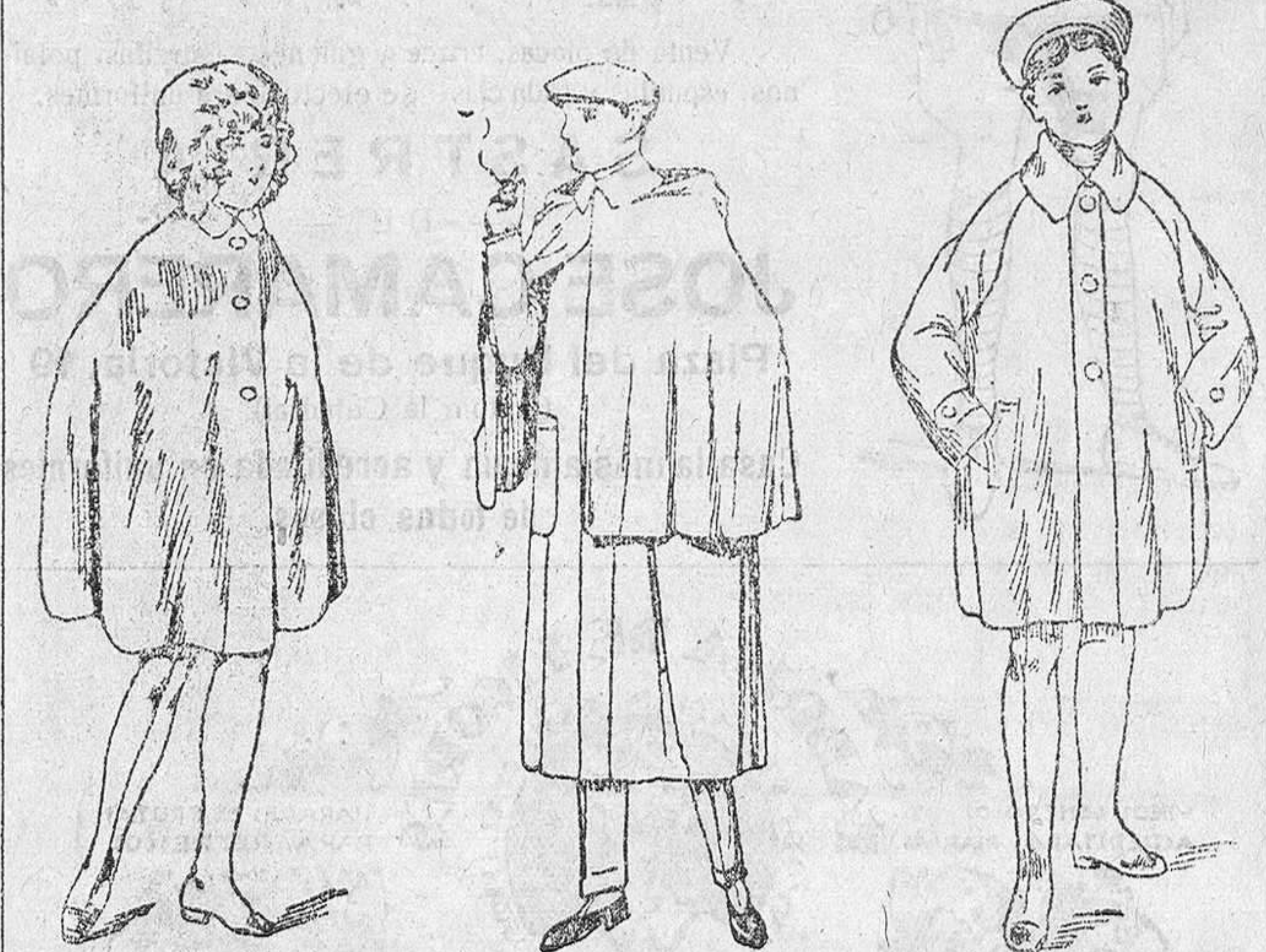
Capitas impermeables de 8 a 20 pesetas, en negro y colores.