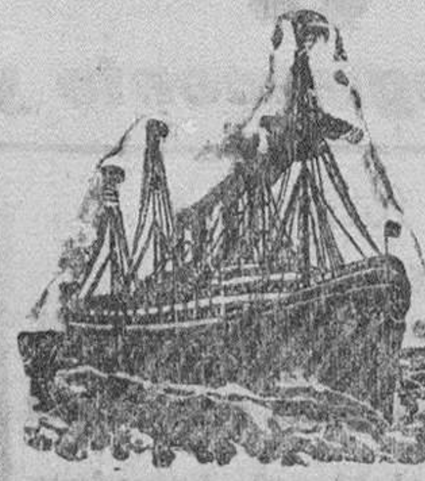
Para informes sobre pasaje de cámara y carga, diríjanse al sub-agente de la Compañía en Burgos

Nadie se ha sorprendido con el cierre, siendo uno de los comentarios más generalizados el de que el