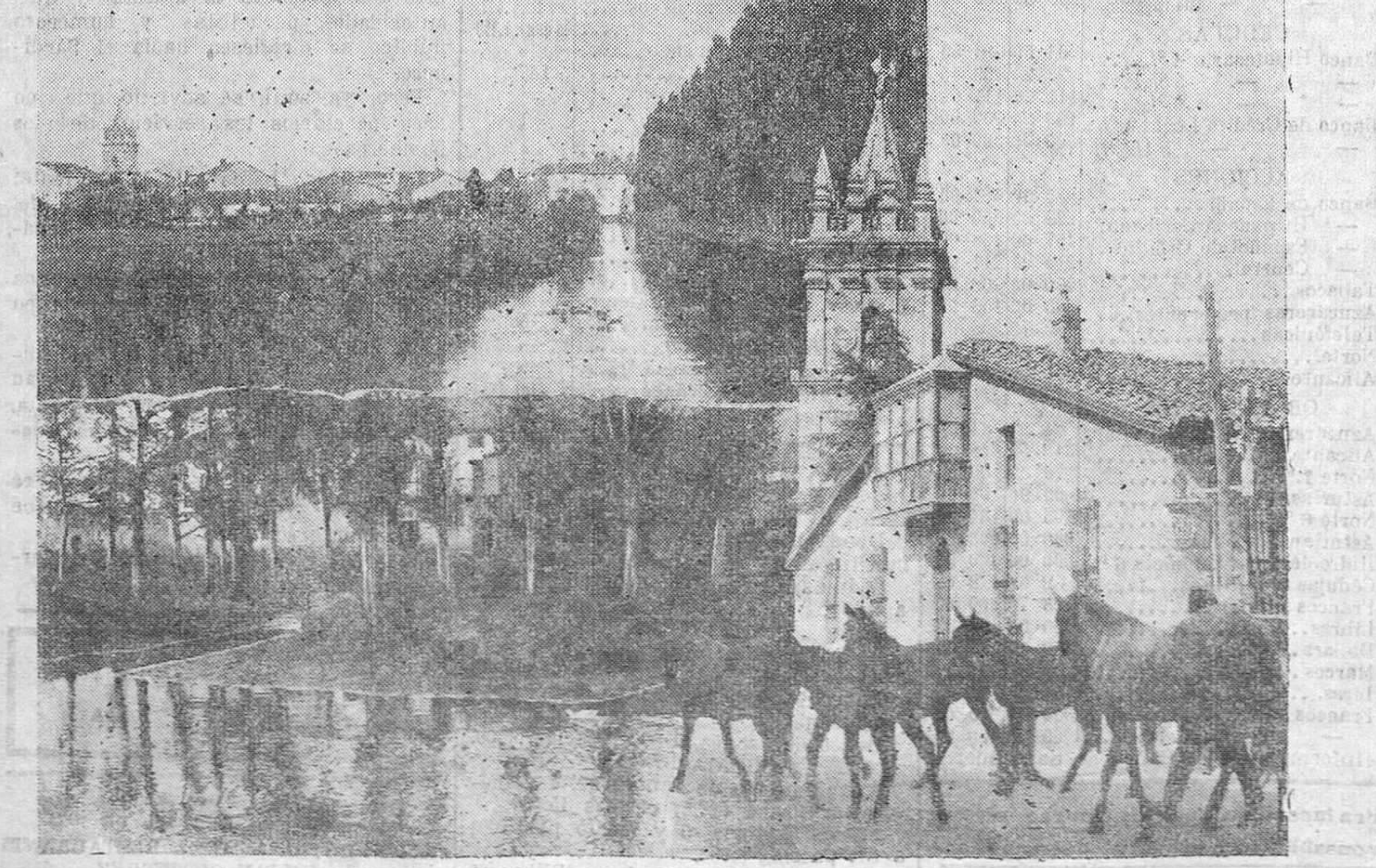
REINOSA.—Dos bellos paisajes del Ebro, en el centro de la ciudad, y el edificio de una entidad bancaria, edificadas sobre el solar en que se levantó la "Casa de las Princesas".