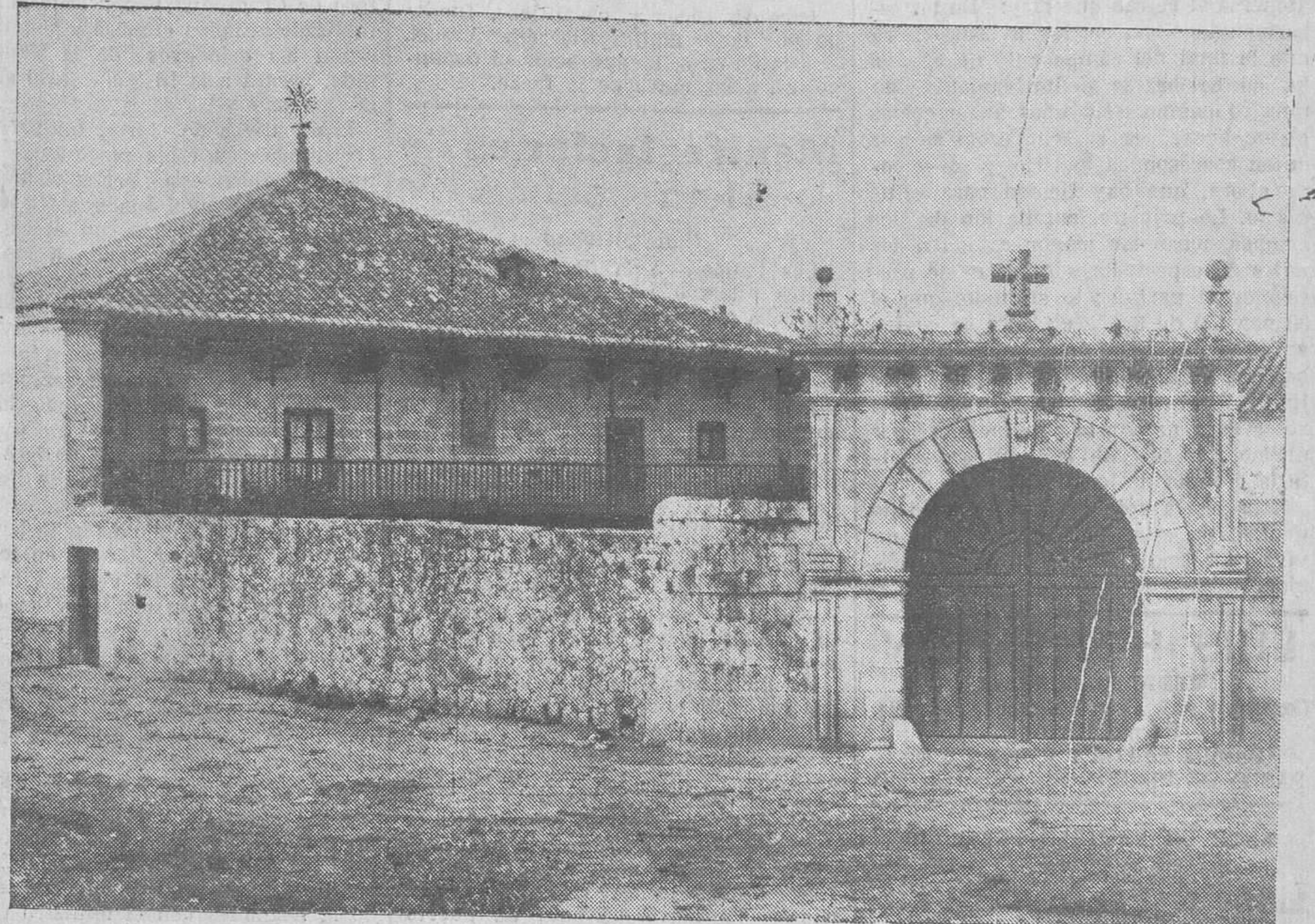
CASÓN MONTAÑÉS, EN VITORIA