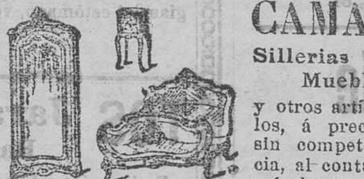
Almooones ARALUCE, Plaza de la Libertad. (detrás del Muelle)

Participamos al público que durante los días 14, 15, 16 y 17 no habrá consulta en su centro de Eibar.