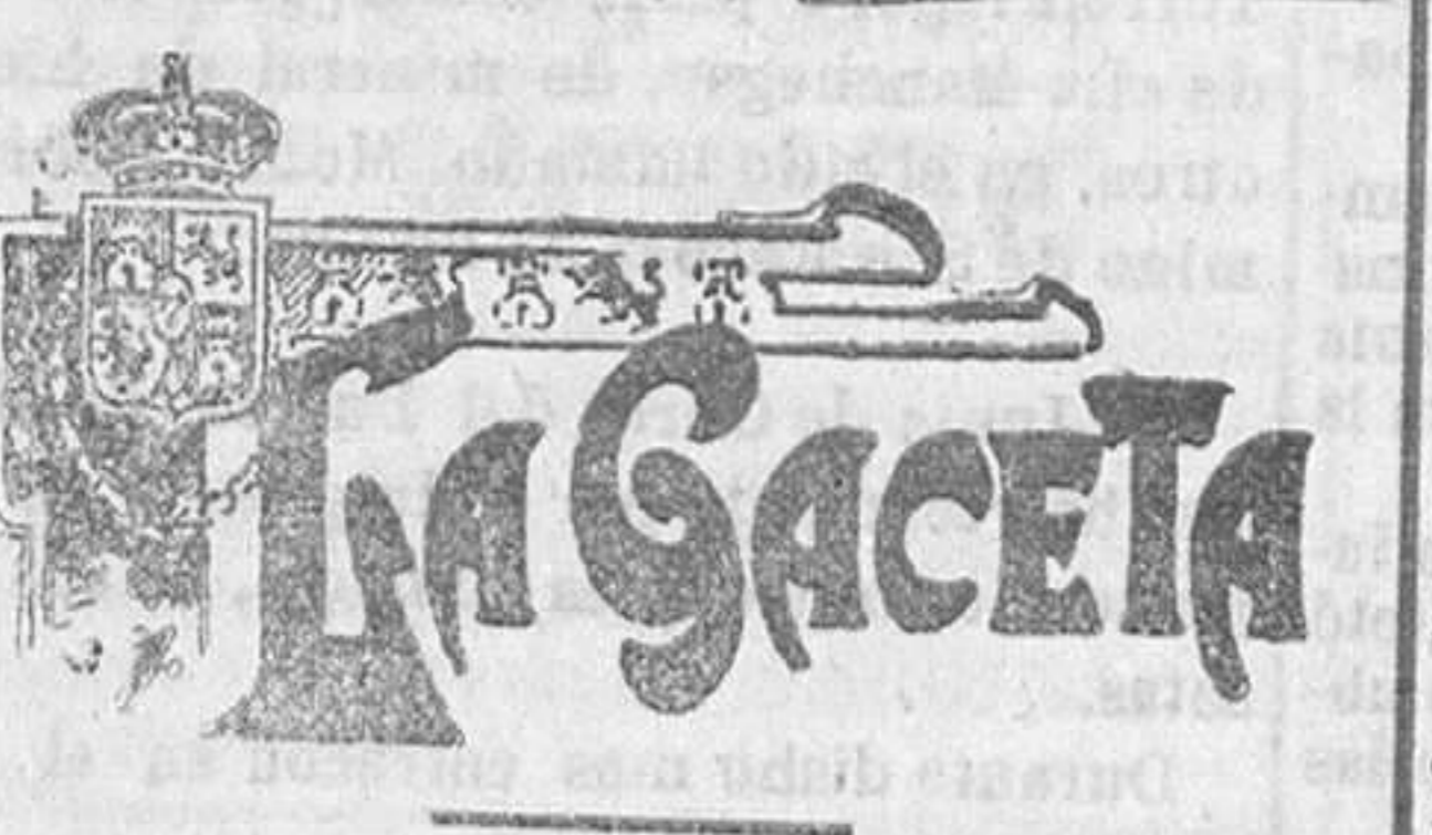
La llegada ayer contiene las siguientes disposiciones: