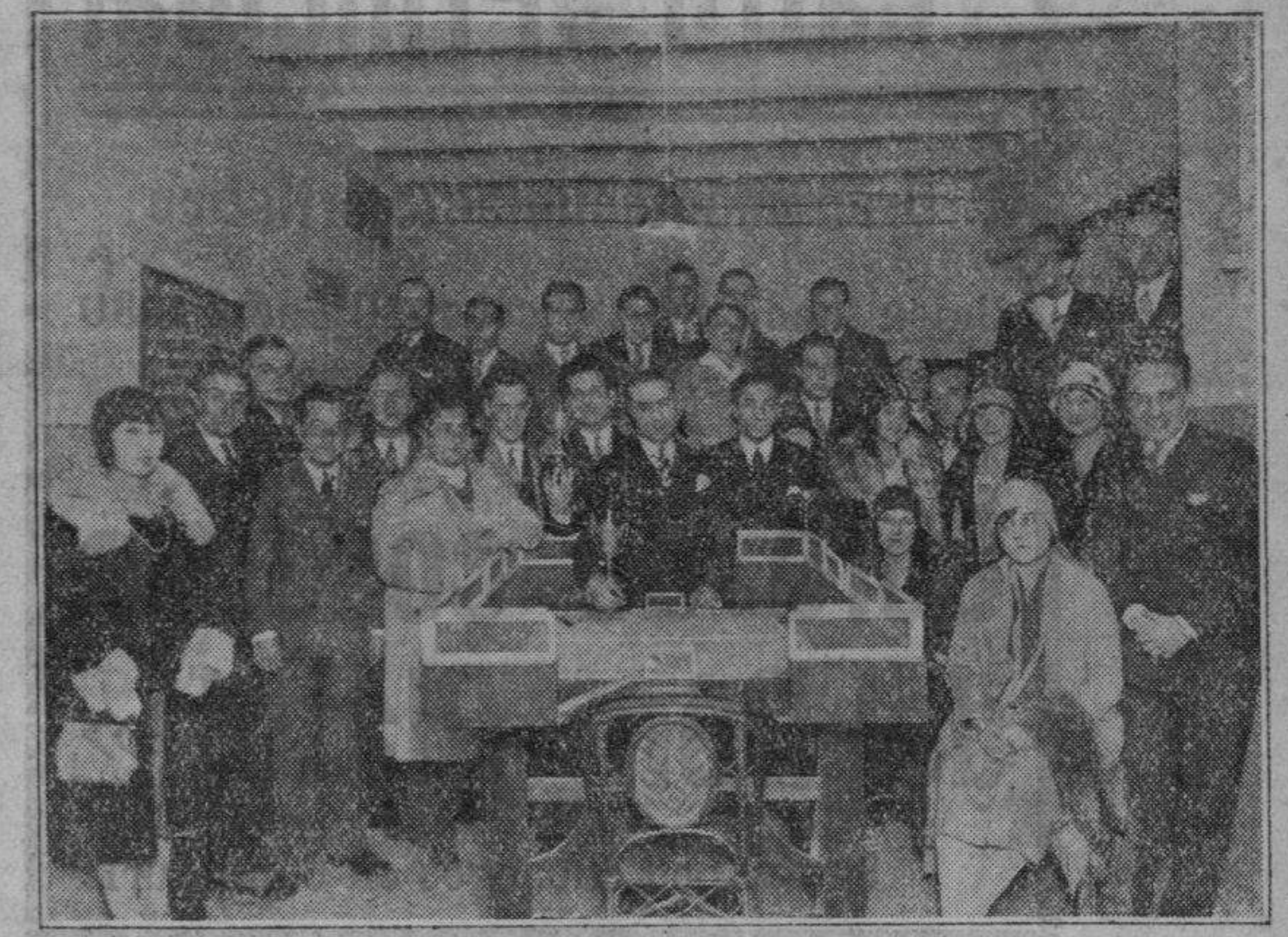
Final del interesante campeonato en el nuevo juego VANJONVOL