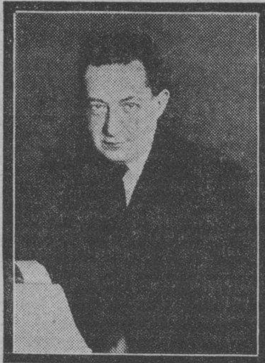
Kerenski, el expresidente de la fugaz República democrática rusa, que esta tarde da en nuestra ciudad una conferencia acerca de la Rusia actual y el plan quinquenal.

El momento no hay duda alguna que es grave. La obstrucción se obstina hasta en boicotear aquellas resoluciones de orden económico más inaplazables. El Gobierno se obstina en ir dejando a un lado los problemas económicos más urgentes. La vida administrativa no rueda. Y, coronando esta obra, los socialistas continúan en lo más alto del Poder, convirtiéndose en los verdaderos árbitros del porvenir de la economía nacional. Ciertamente la situación es bien poco halagüeña en todos los sentidos.