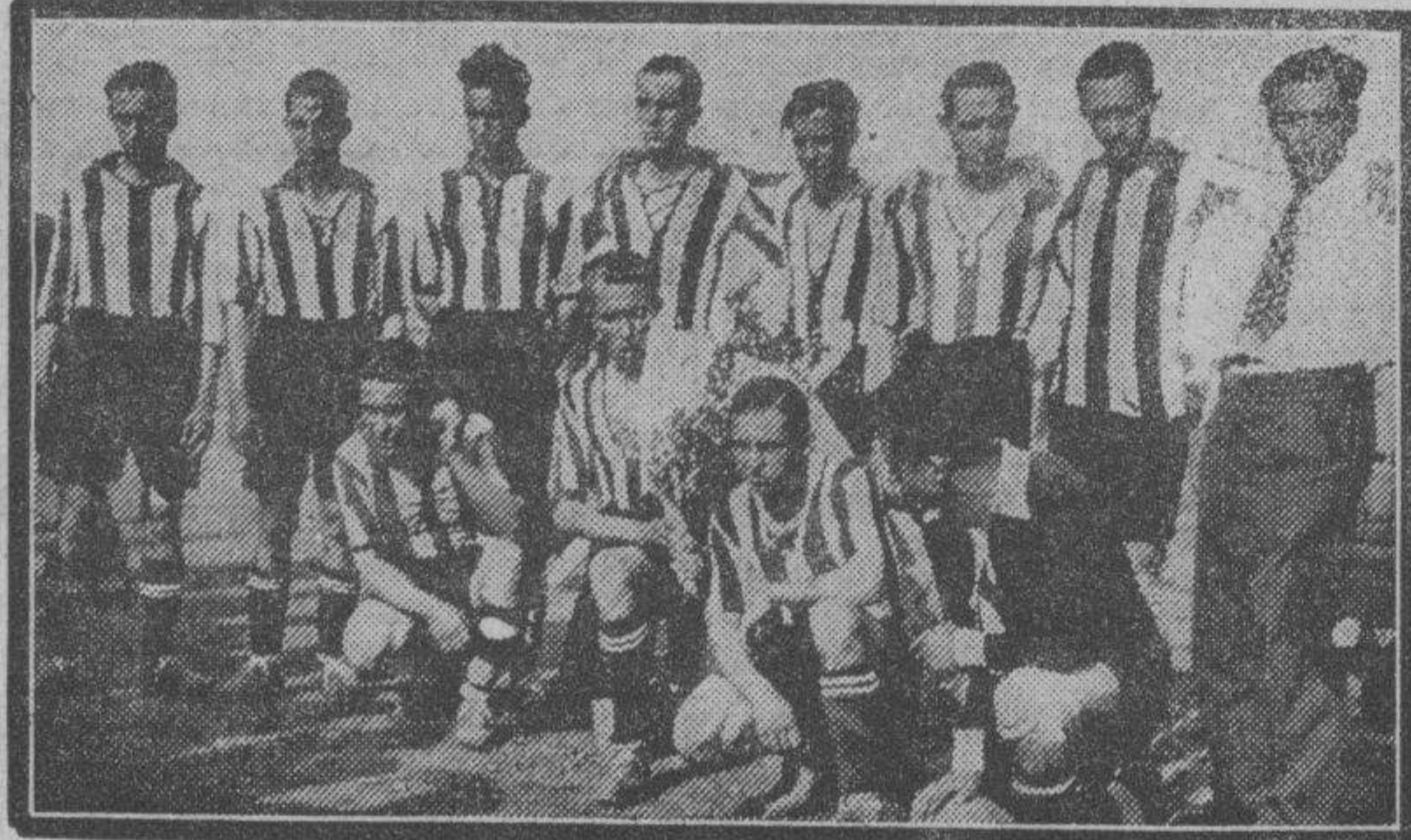
Equipo del Luceni que el domingo jugó en esa localidad contra el Arenas zaragozano.