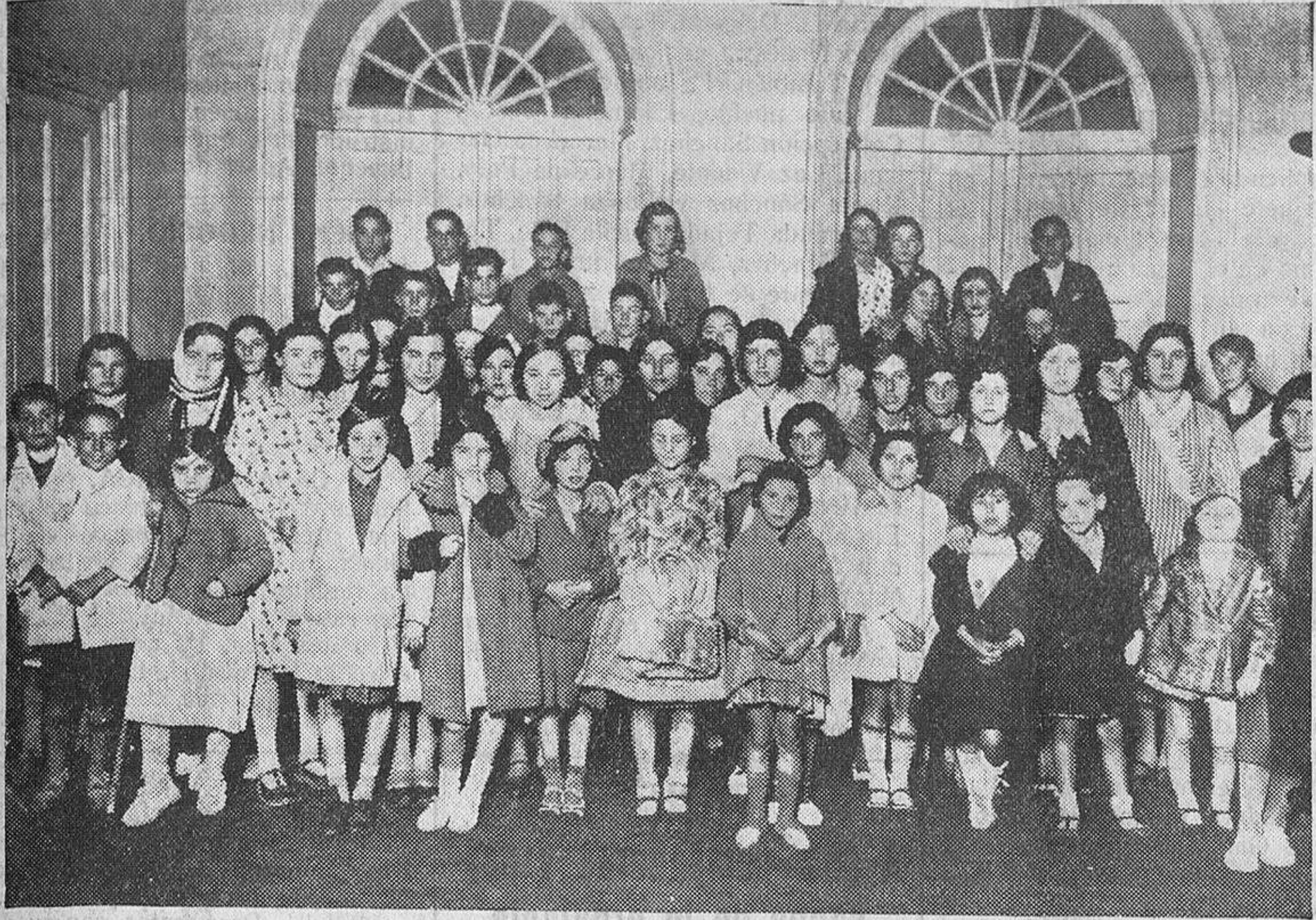
Expedición escolar que anoche salieron para someterse a curación en las termas de La Toja