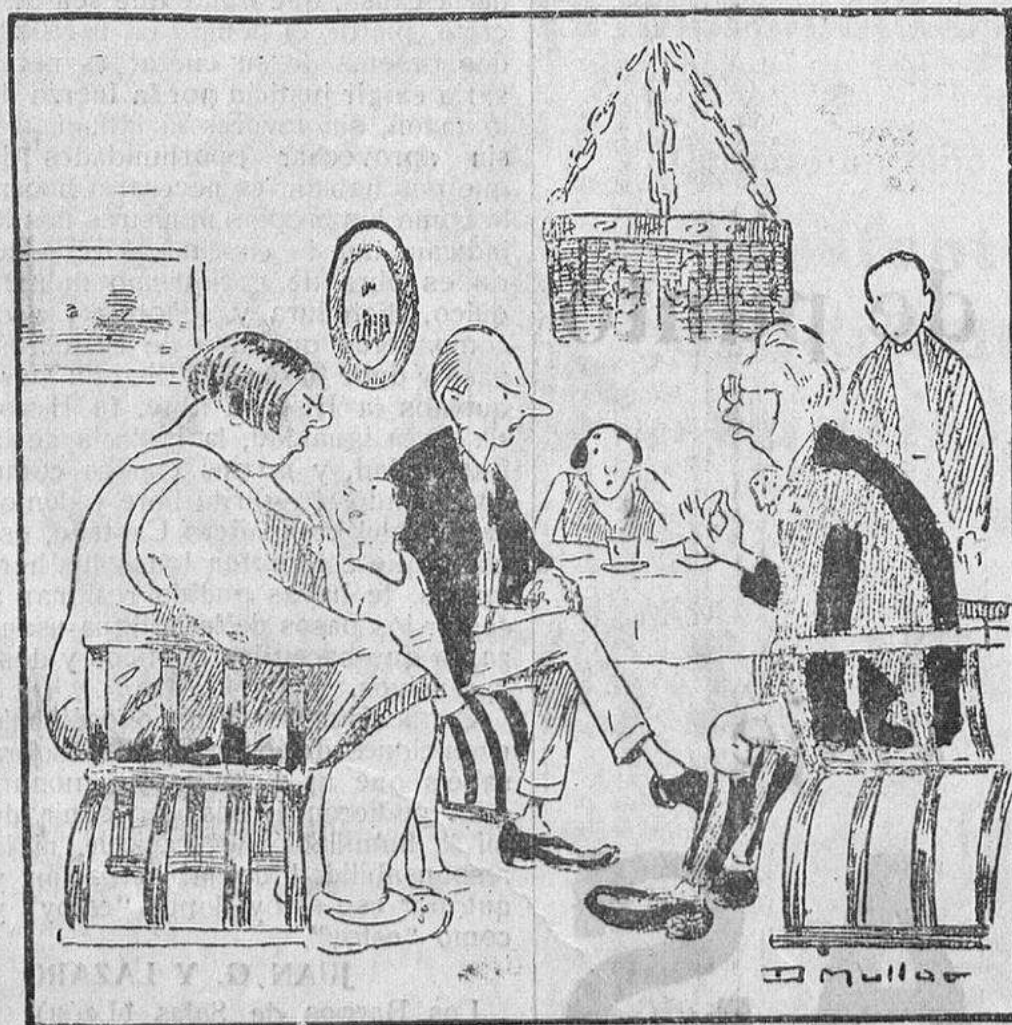
—Aquello es un país maravilloso. El príncipe tiene un elefante con los cuernos coronados de oro. —El niño.—¡Yo mismo que tú, mamá!

EL PARQUE DE LA ALAMEDILLA. —En este parque frondoso—frondoso hasta cierto punto—tiene su asiento y reposo—la feria mejor del mundo.—Parque modesto, en verdad,—pero de gran valimiento—porque es de nuestra ciudad—el único esparcimiento,— hoy abre sus avenidas—y sus senderos floridos—a los juegos y partidas—de feriantes bien servidos.—Por él desfilan a diario—con asiduidad notoria,—el público extraordinario—de la feria ejecutoria.—Y en unas horas de asueto—y de fiestas en cartel—alcanza el Parque el respeto—casi, casi de un vergel.—Parque de la Alamedilla—sector de la diversión—y la octava maravilla—de una gran feria en sazón