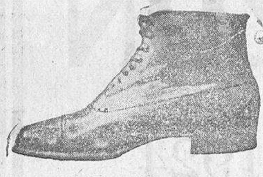
Caballero, 16 pesetas.