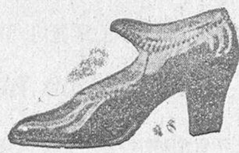
Señora, 10 pesetas.