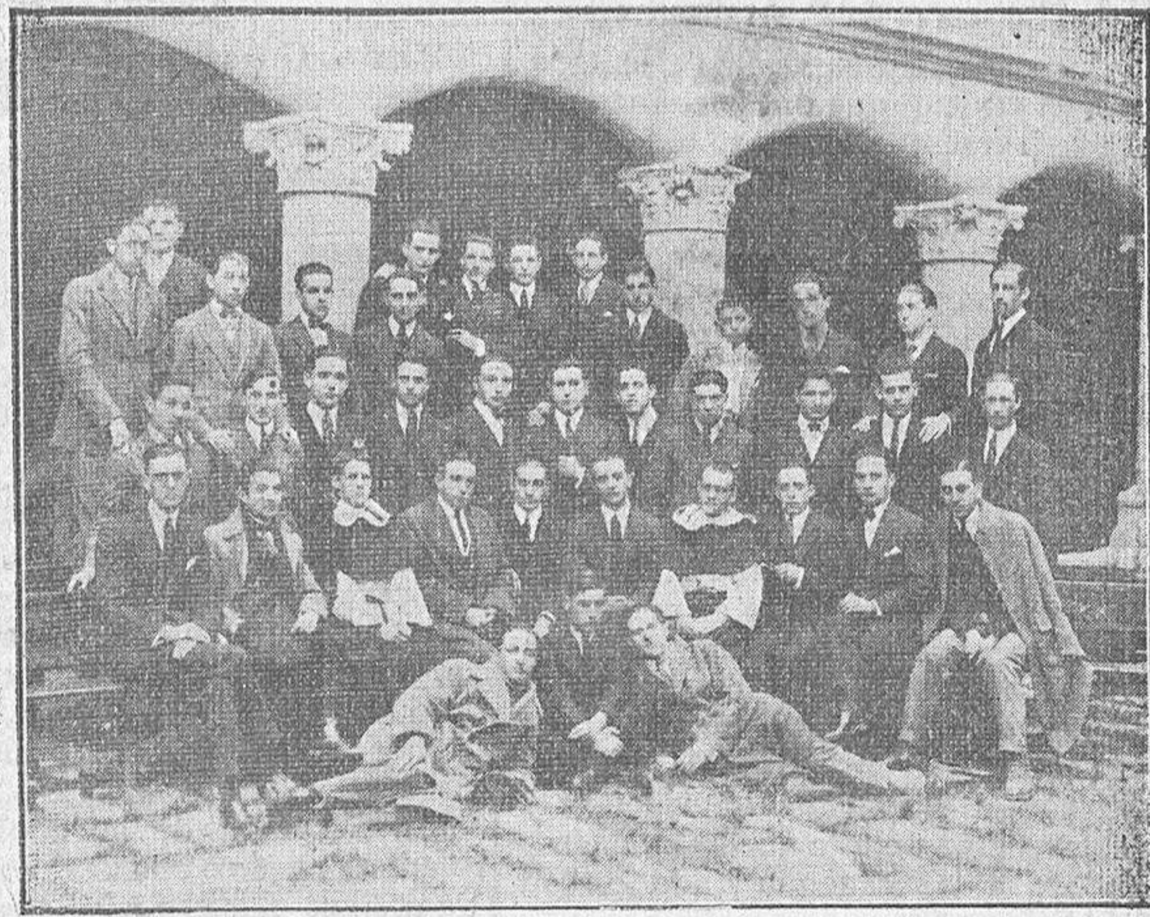
Académicos de Santo Tomás de Aquino que constituyen el orfeón La Coral Universitaria, que con tanto éxito dió anoche su primera audición en Bretón.