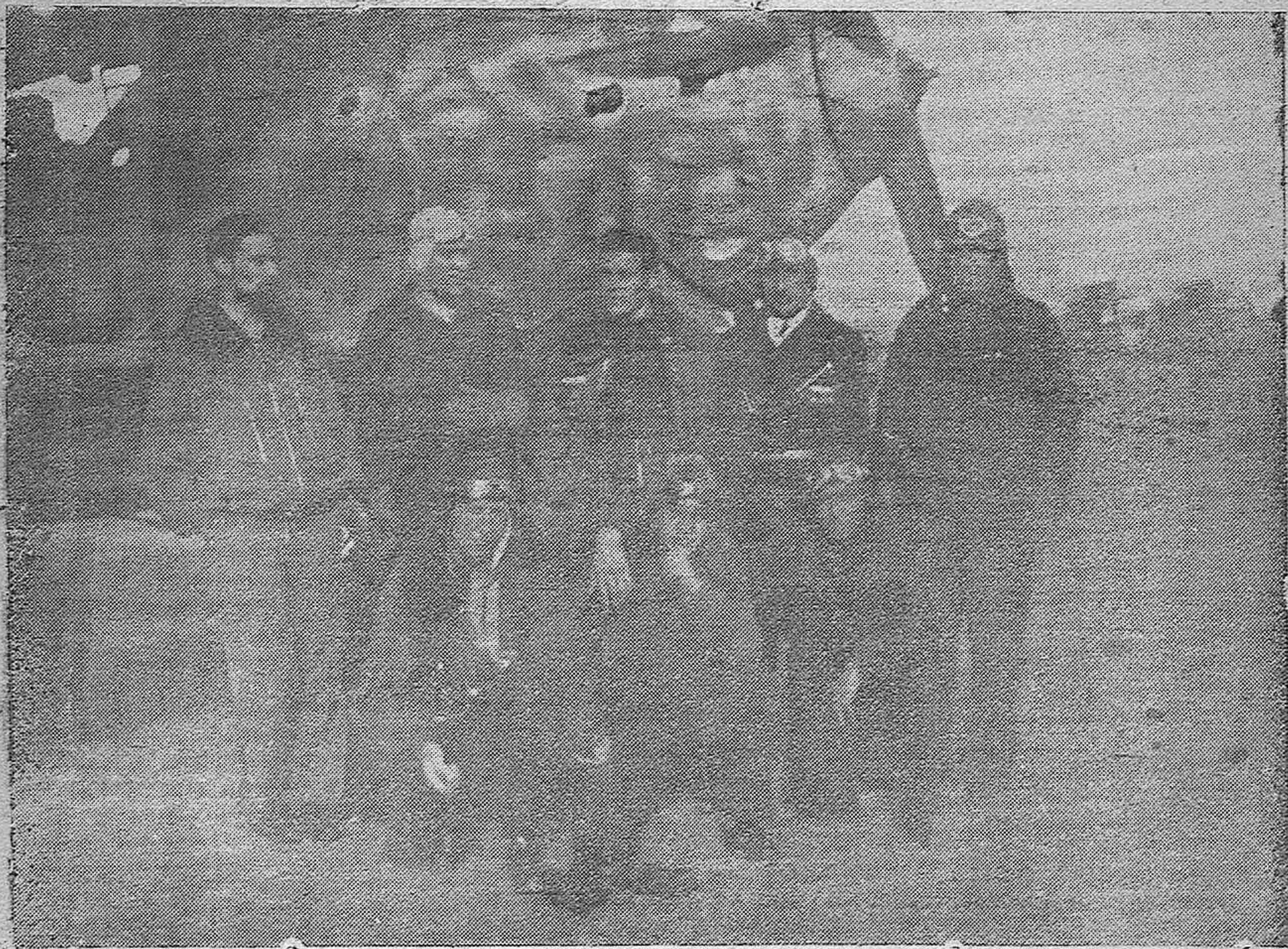
Los pájaros de acero están escribiendo una página heroica, cada día renovada, en la reconquista de España.-Un grupo de pilotos nacionales.