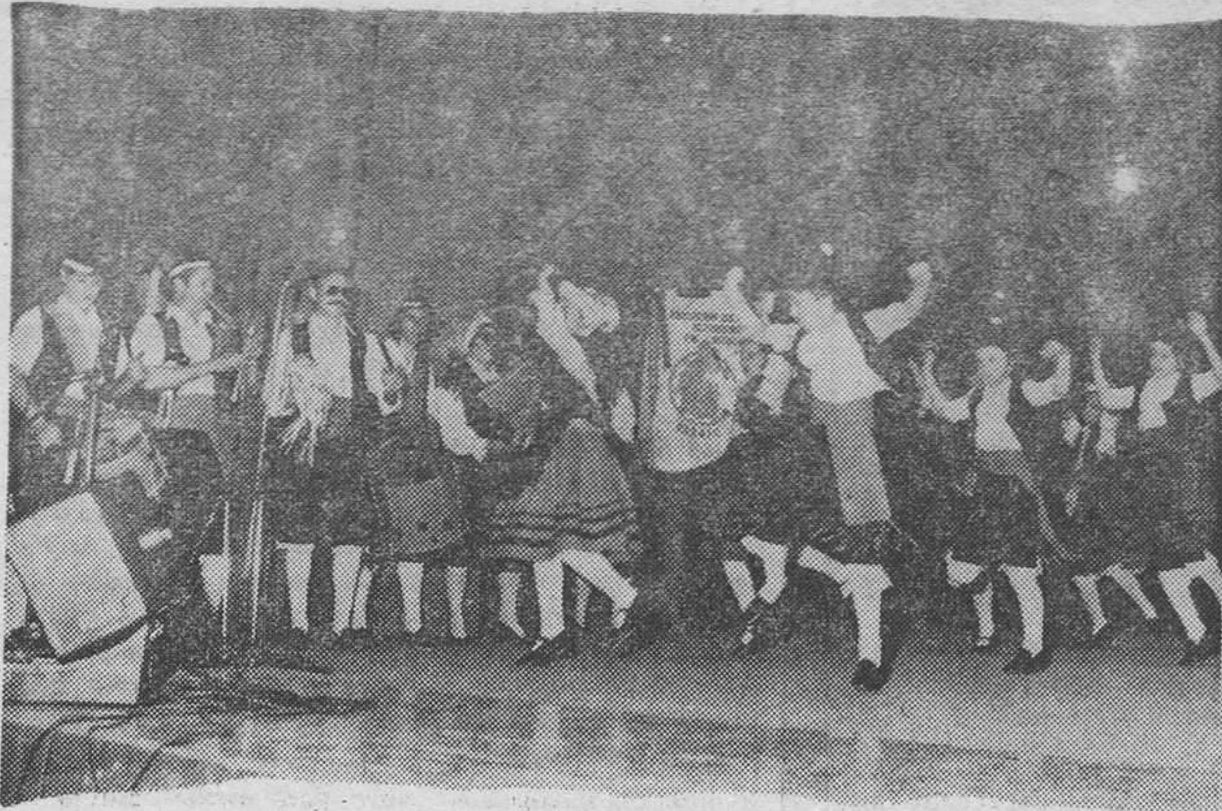
Fiesta asturiana en Burgos. — (Foto VILAFRANCA).

A la fiesta asistieron el alcalde y el gobernador civil