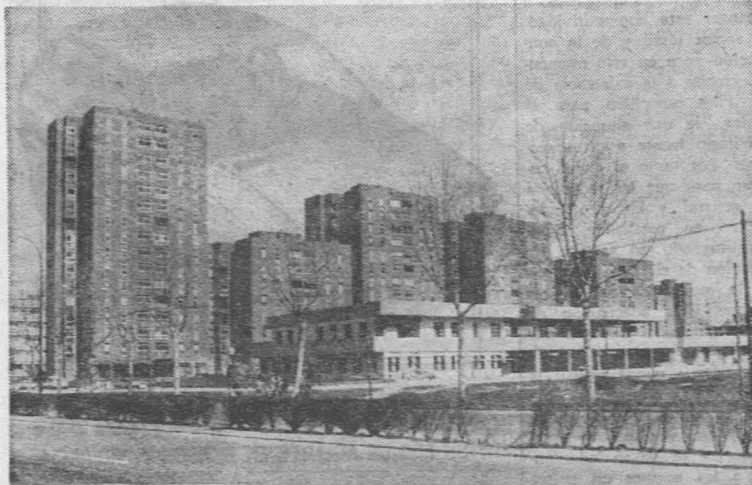
Una perspectiva del barrio. — (Foto VILAFRANCA).