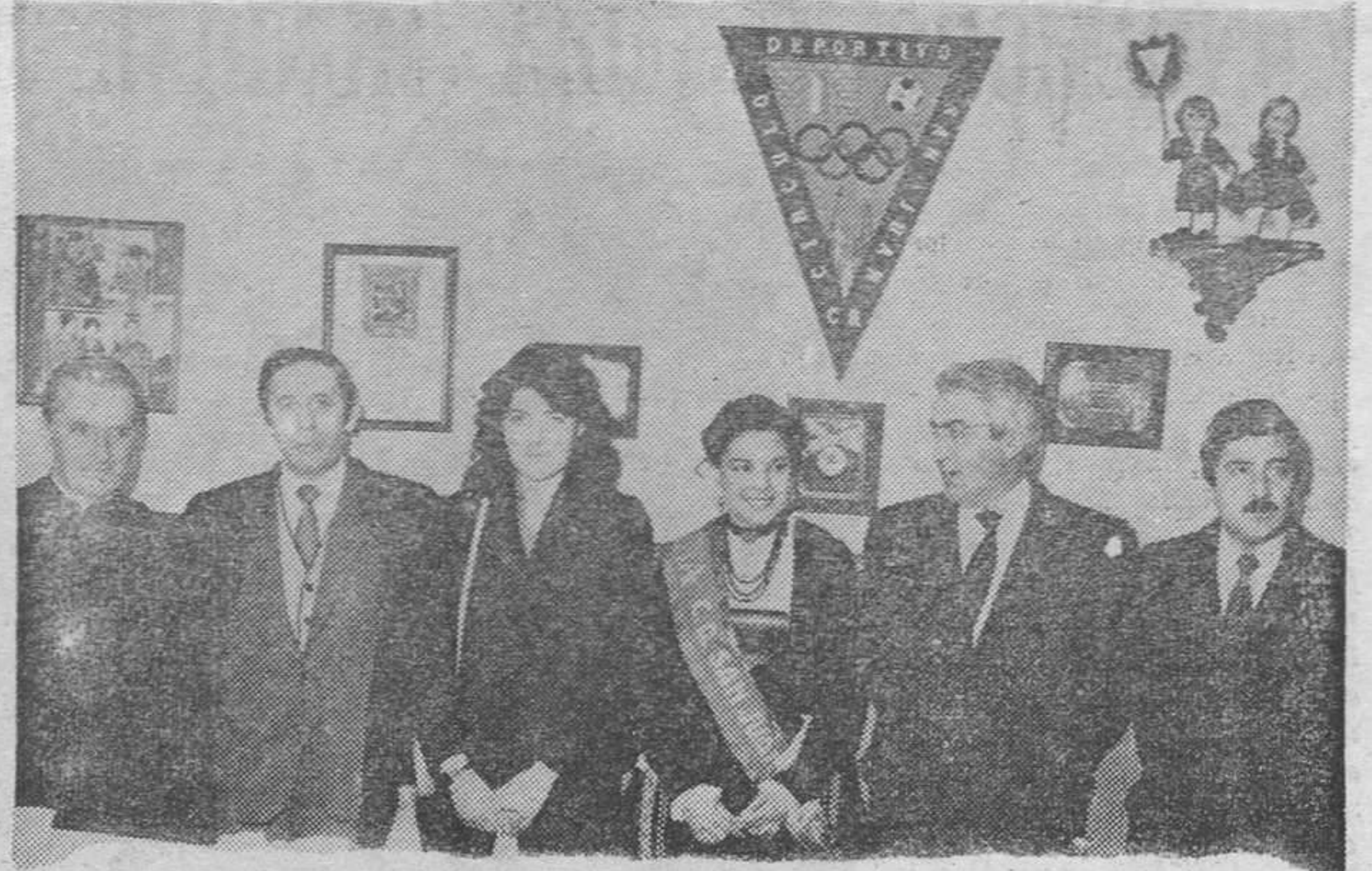
Miembros de la directiva e invitados, junto a la «reina» del C. D. San Juan.

El Círculo Deportivo San Juan C. R., celebró ayer su XXXI Aniversario de su fundación, con una serie de actos sociales y religiosos que tuvieron lugar en la Catedral y en la sede de la sociedad.