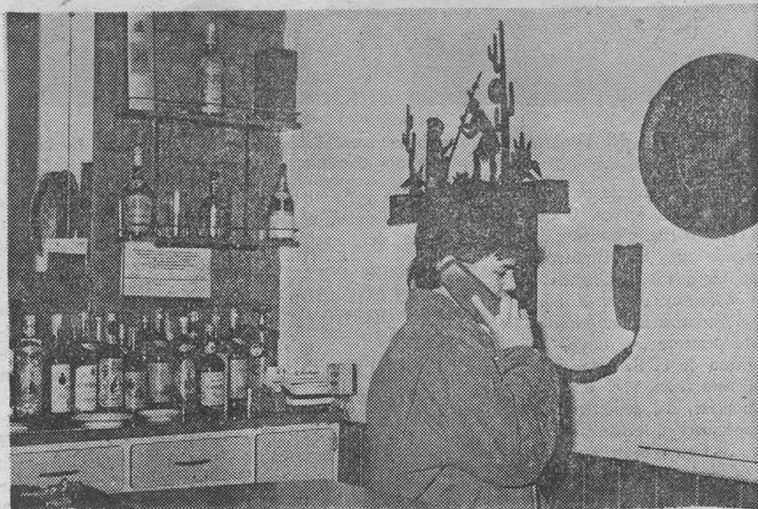
Los establecimientos públicos con servicio telefónico donde el usuario abona directamente el importe deberán poseer el cartel en el que viene recogido un resumen de la Orden Ministerial que regula este servicio.

Esto no se ajusta en lo más mínimo ni a la letra ni al es-