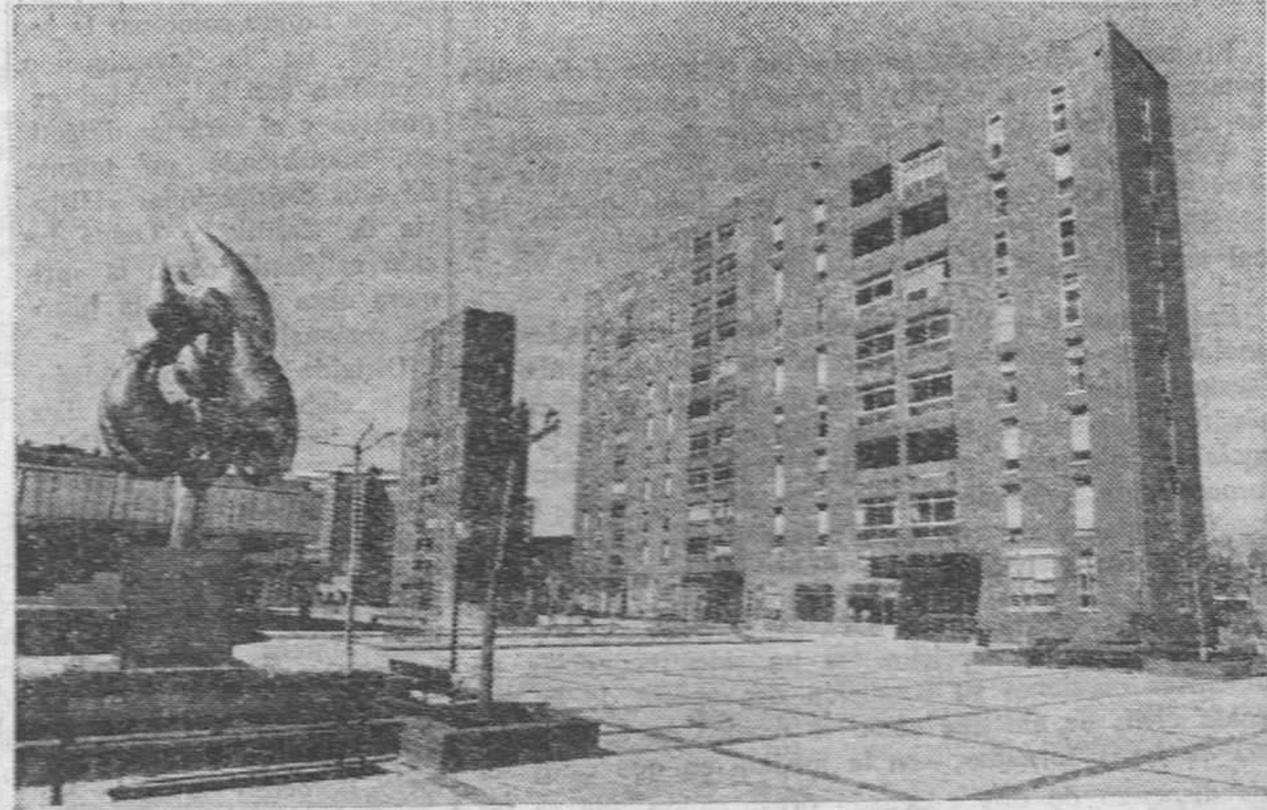
Río Vena un barrio joven con una particular fisonomía.