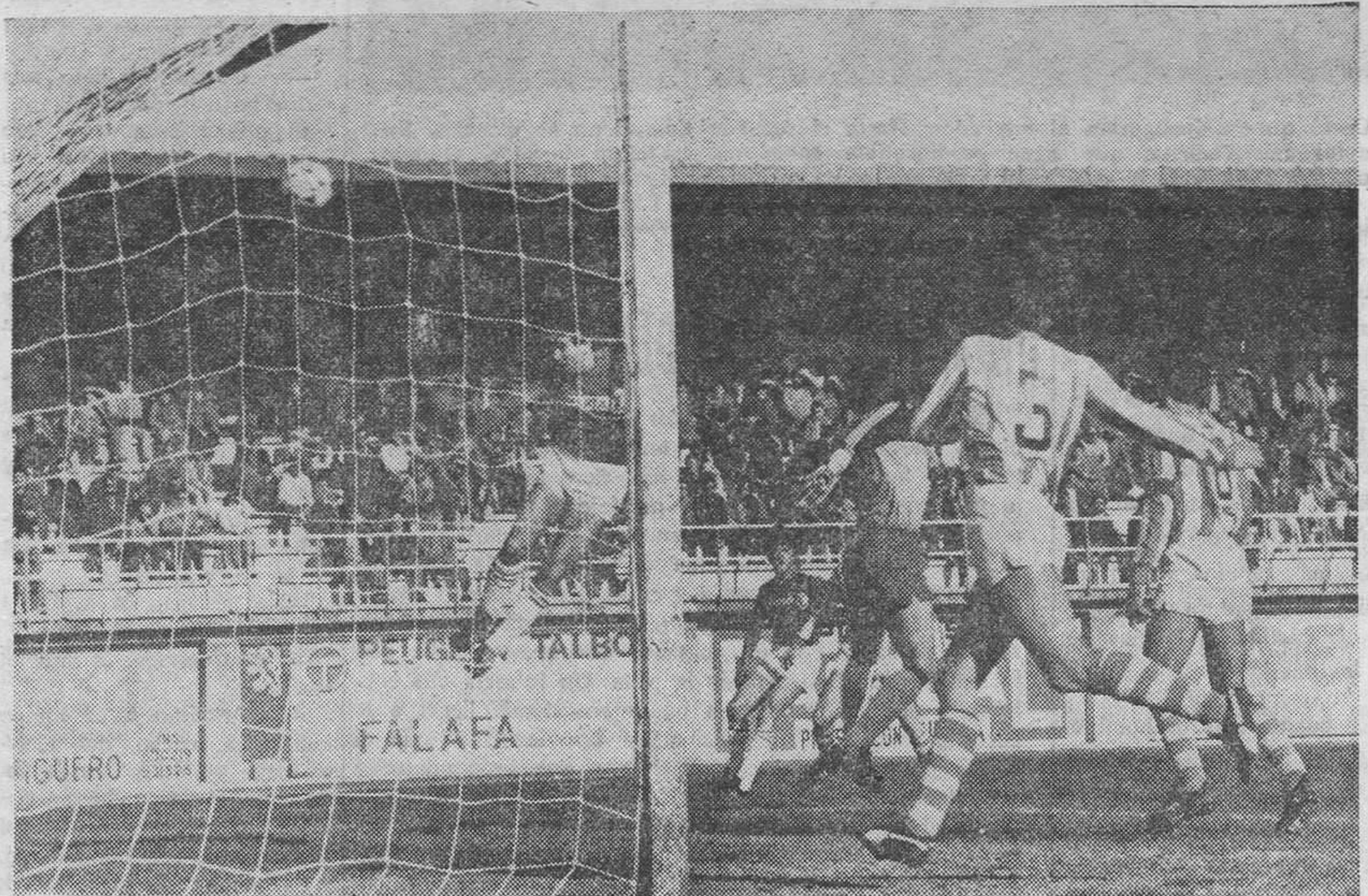
Montero anduvo situado por la zona ancha, buscando espacios para entrar en el área ribereña. Sin embargo, no se prodigó mucho en remate. En esta ocasión la cámara de nuestro compañero Fausto de Urbión estuvo atenta para captar este bonito remate de cabeza que enviaría fuera el balón.

De salida, se apreció claramente que Mezquita, el entrenador local situaba en punta tan sólo a Yllera y Soregui, quedando Nacho, Fe-