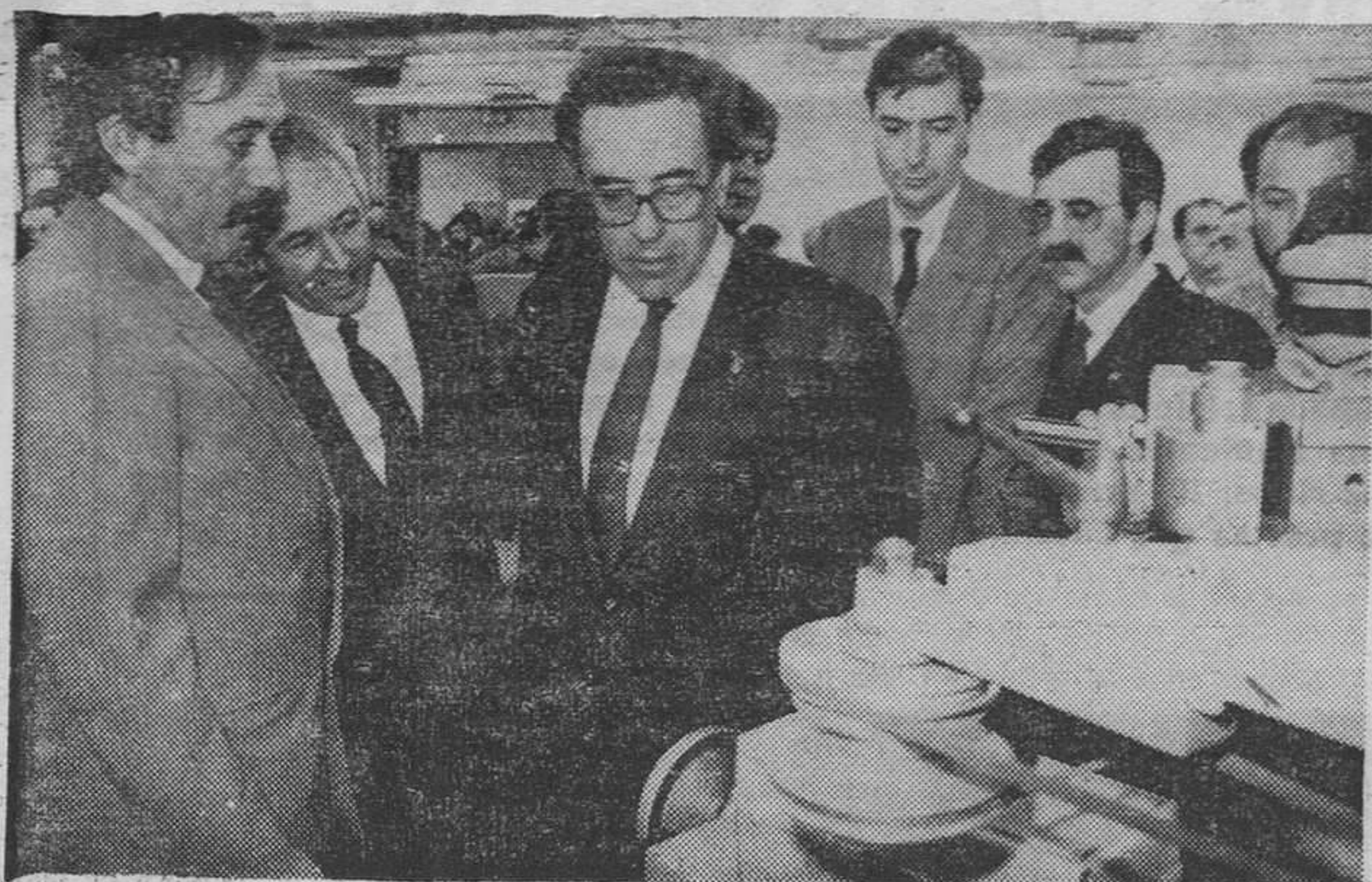
El presidente del Congreso, junto a otras autoridades durante su visita al Instituto de F. P. Santa Catalina.

Durante su estancia en Aranda, el pasado jueves, Gregorio Peces Barba, presidente del Congreso de los Diputados, asistió a una recepción en el Ayuntamiento, donde le esperaban numerosas autoridades. Posteriormente se dirigió al Instituto de F. P. Santa Catalina para conocer el centro y pronunciar una conferencia y, a continuación, le fue ofrecido, por la Corporación arandina, un almuerzo, en un céntrico restaurante. A primeras horas de la tarde se trasladó a Burgos, donde tenía programados varios actos.