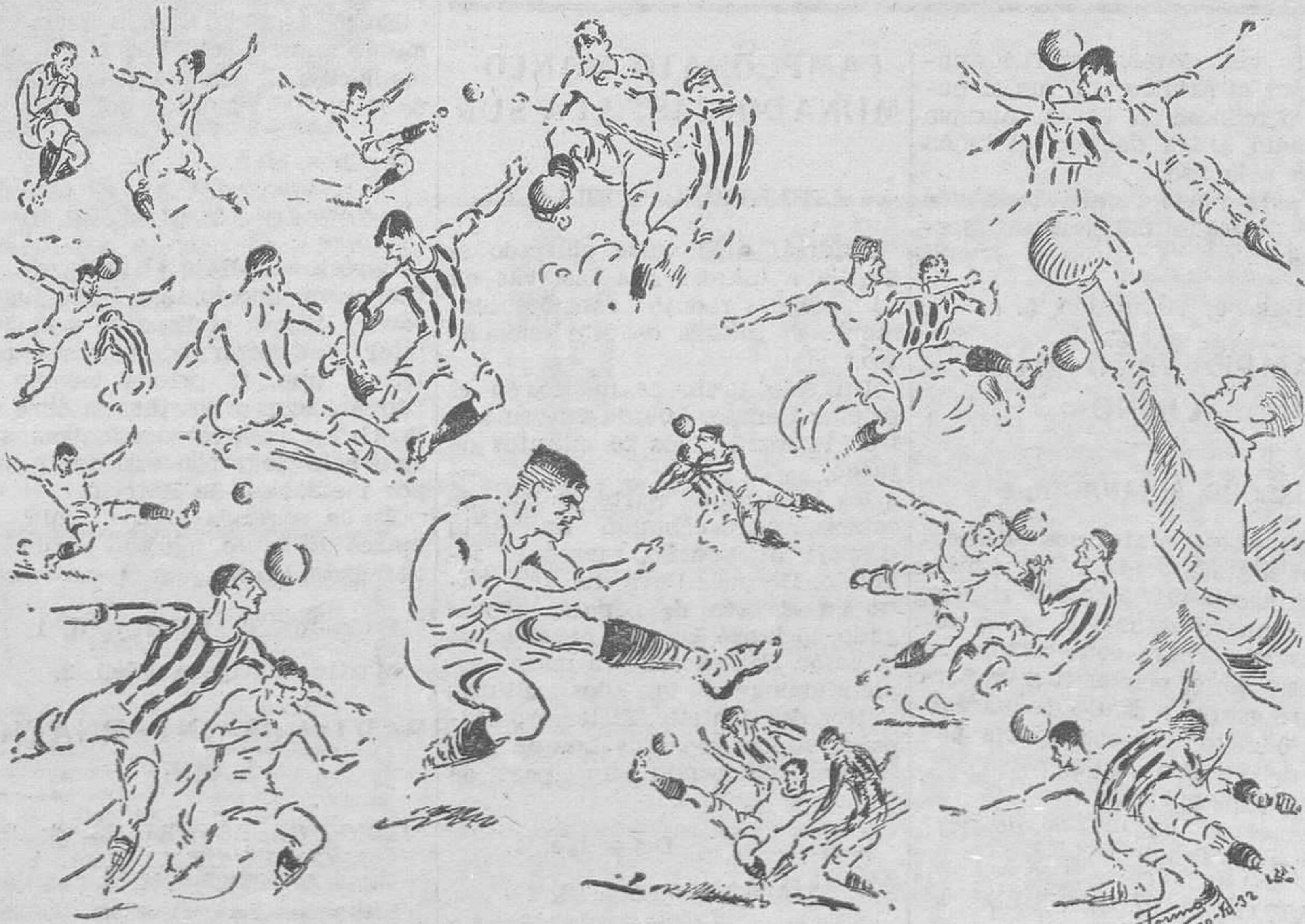
Varias fases del partido Valencia-Castellón