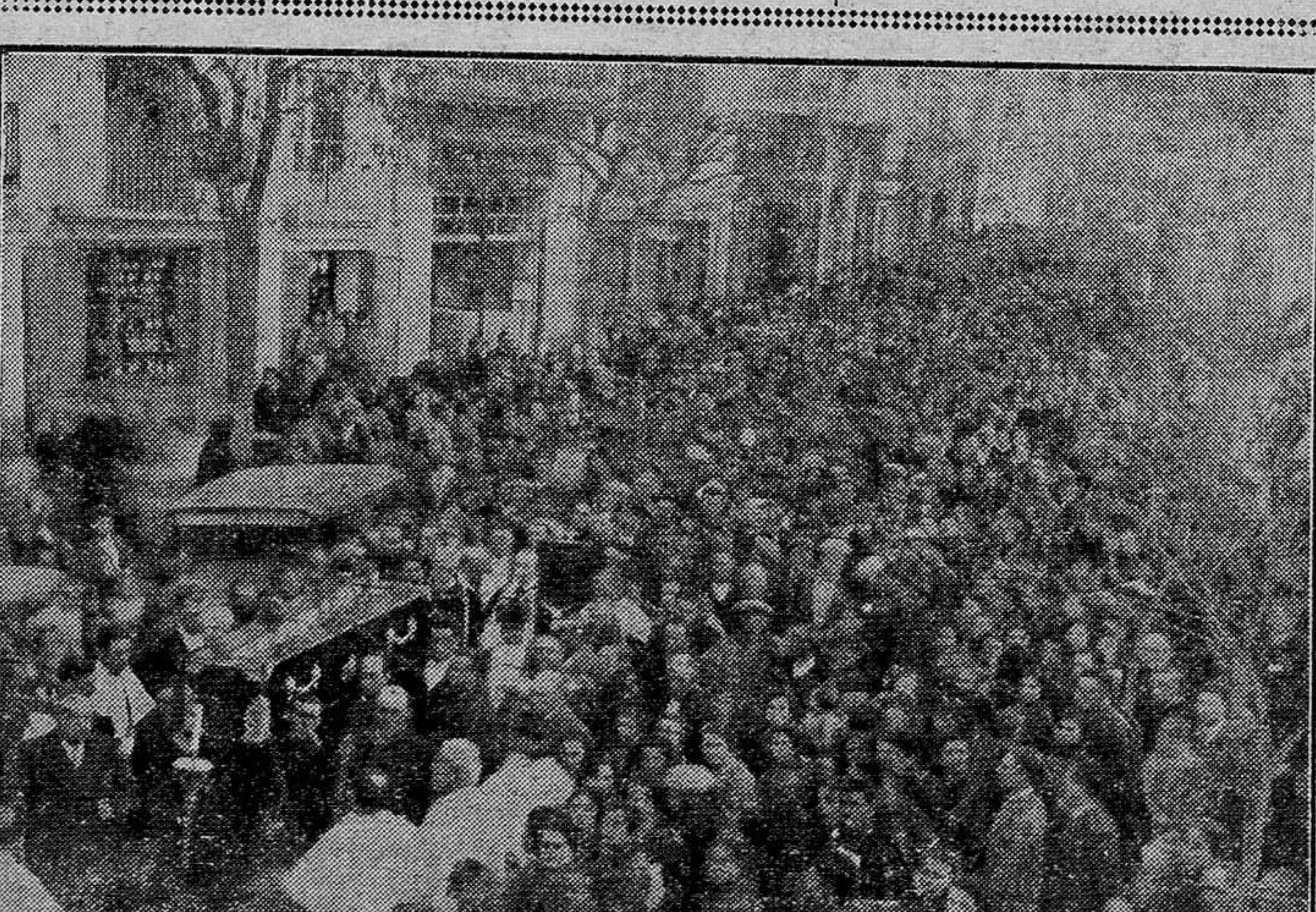
La fiesta de la "Mi-Careme" en los bulevares parisinos. Lindas "Pierrettes" y una caricatura de Poincaré, comprando confetti.—En Requena. Entierro del general Percira, que constituyó una sentida manifestación de duelo de la población entera.