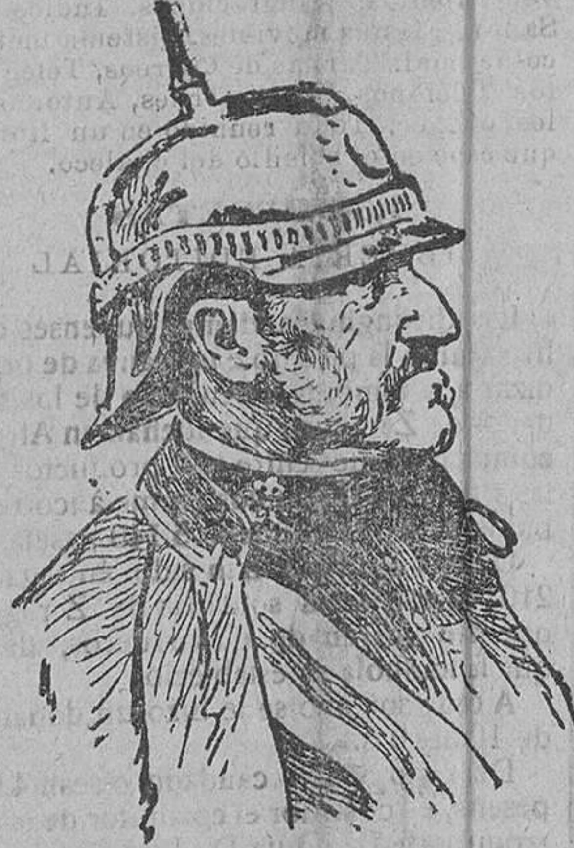
El capitán general D. Valeriano Weyler que dimitió el cargo de jefe del Estado Mayor Central.