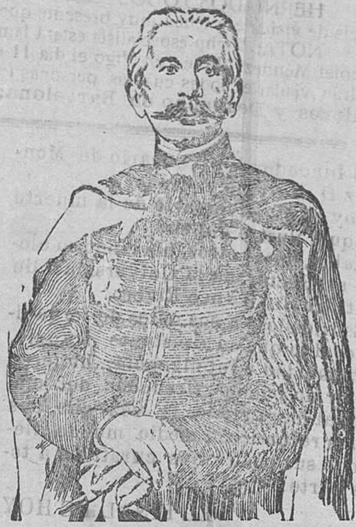
El mariscal Mr. Lyautey, alto comisario de Francia, en Marruecos, que ha presentado a su gobierno la dimisión del cargo.