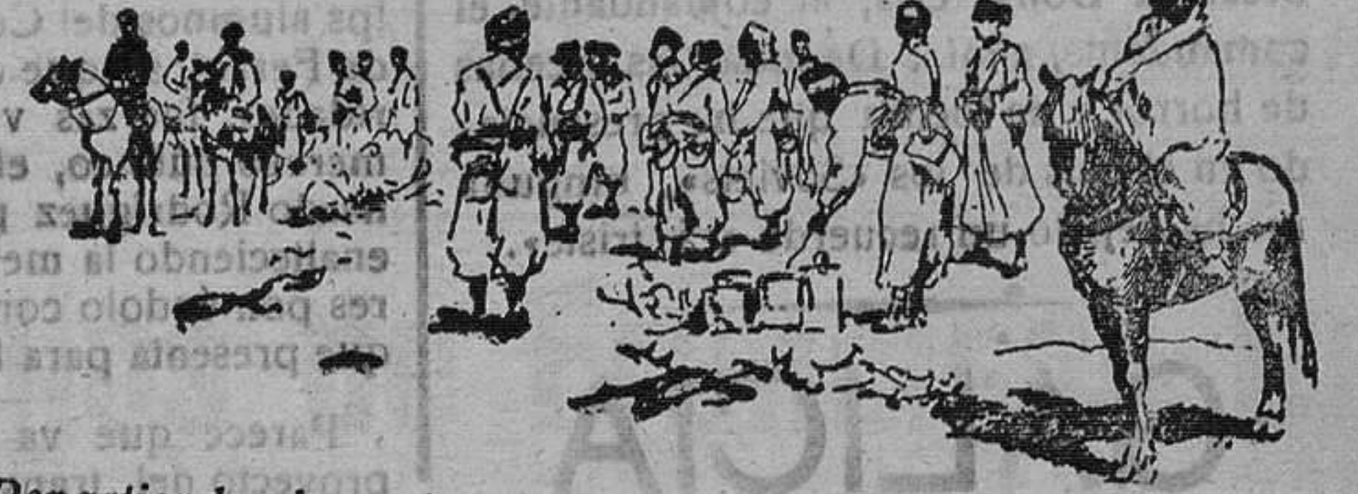
Repartiendo el rancho durante un alto al Tercio Extranjero

Este concurso, de imponderable importancia para el Arte de nuestra patria, ha de dar por inmediato resultado una brillante Exposición de obras arquitectónicas característicamente gallegas, la mayor parte ignoradas aun en la misma Región, y cuyo conocimiento completo cimentará sólidamente los estudios previos absolutamente indispensables a los arquitectos gallegos del presente, para elevar sobre ellos la creación de la arquitectura regional de un próximo porvenir. A estos fines se publicará, pasada la Exposición, un Album en que se reproduzcan todos los ejemplares presentados que por su interés lo merezcan, con lo cual no sólo contribuirá «Monda-