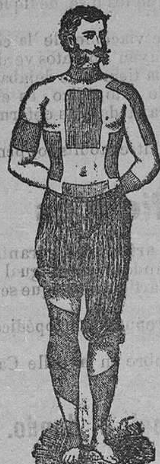
Trade Mark Registered.

CURAN REUMATISMOS, RES-FRIADOS, DOLOR DE RIÑONES, DOLOR DE ESPALDA, DOLOR DE PULMONES LUMBAGO, CIÁTICA, CONTUSIONES, ETC.