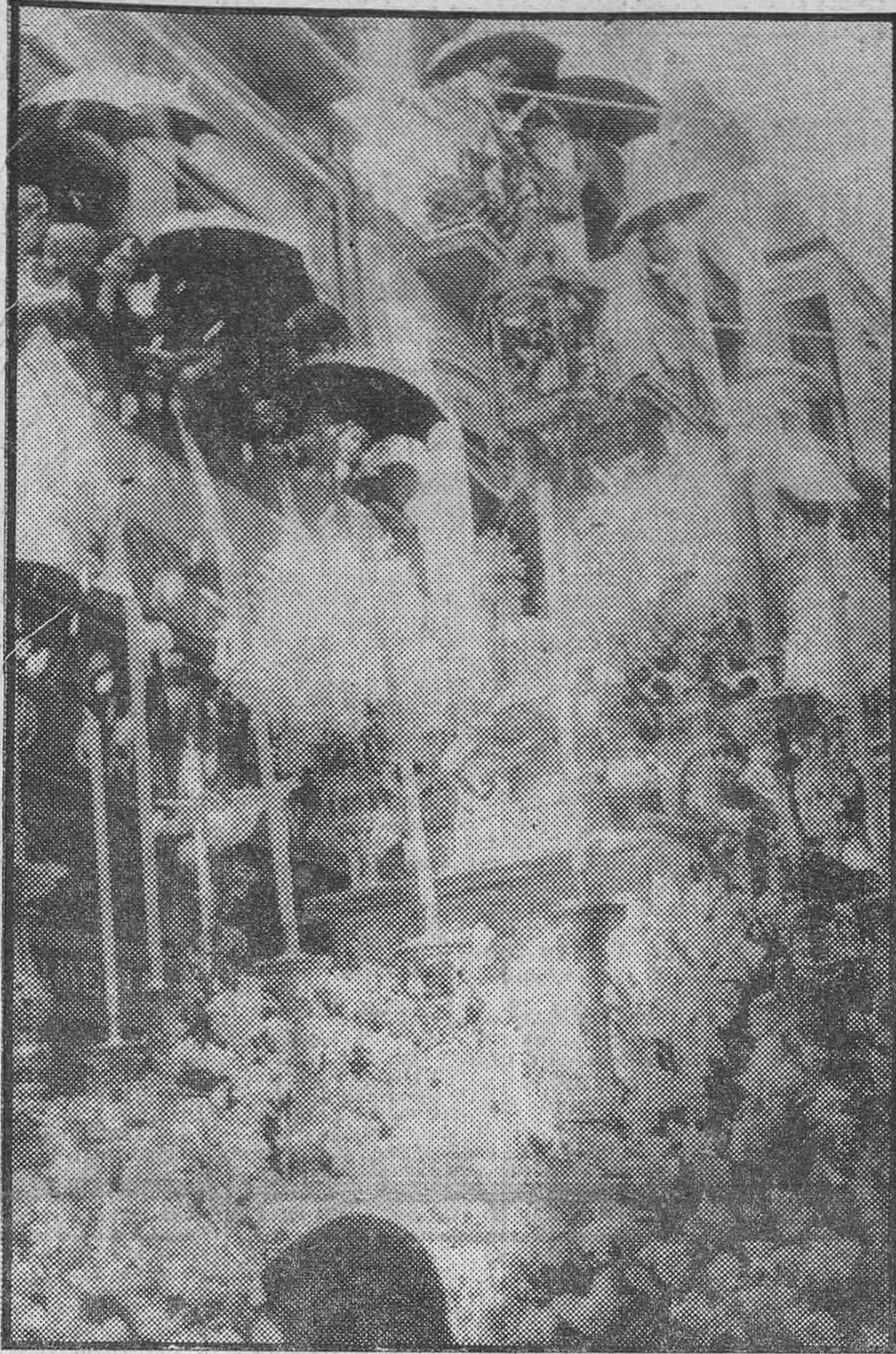
Un momento de la solemne procesión del Corpus Christi, a su paso por las calles de la ciudad.