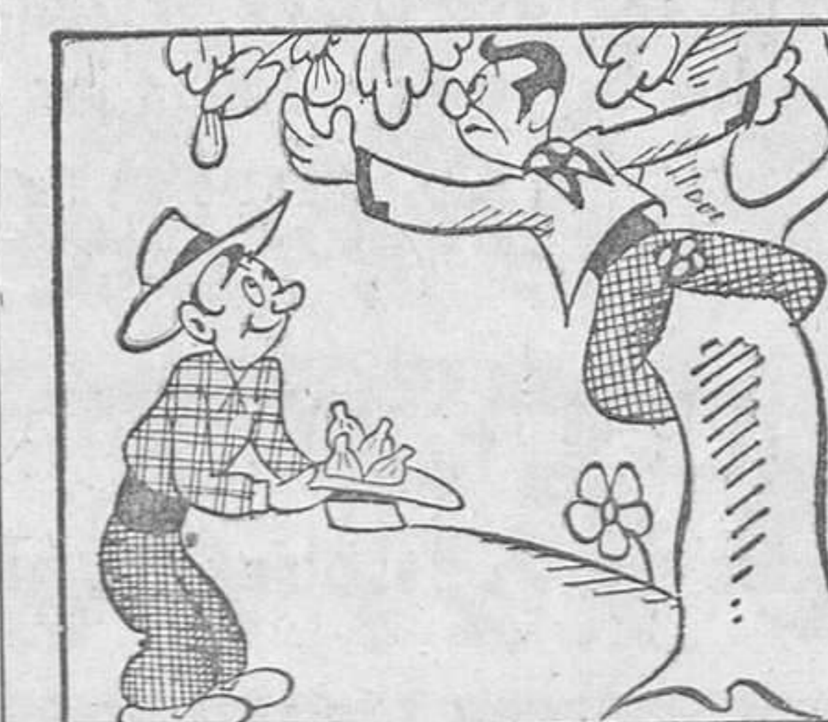
Los dos compadres salieron a robar higos...