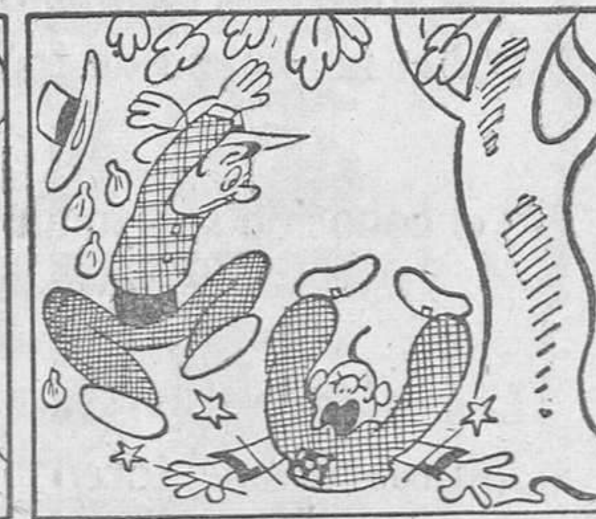
Y como ese arbolito es tan traicionero, er Mengue cayó desde lo alto de la higuera.