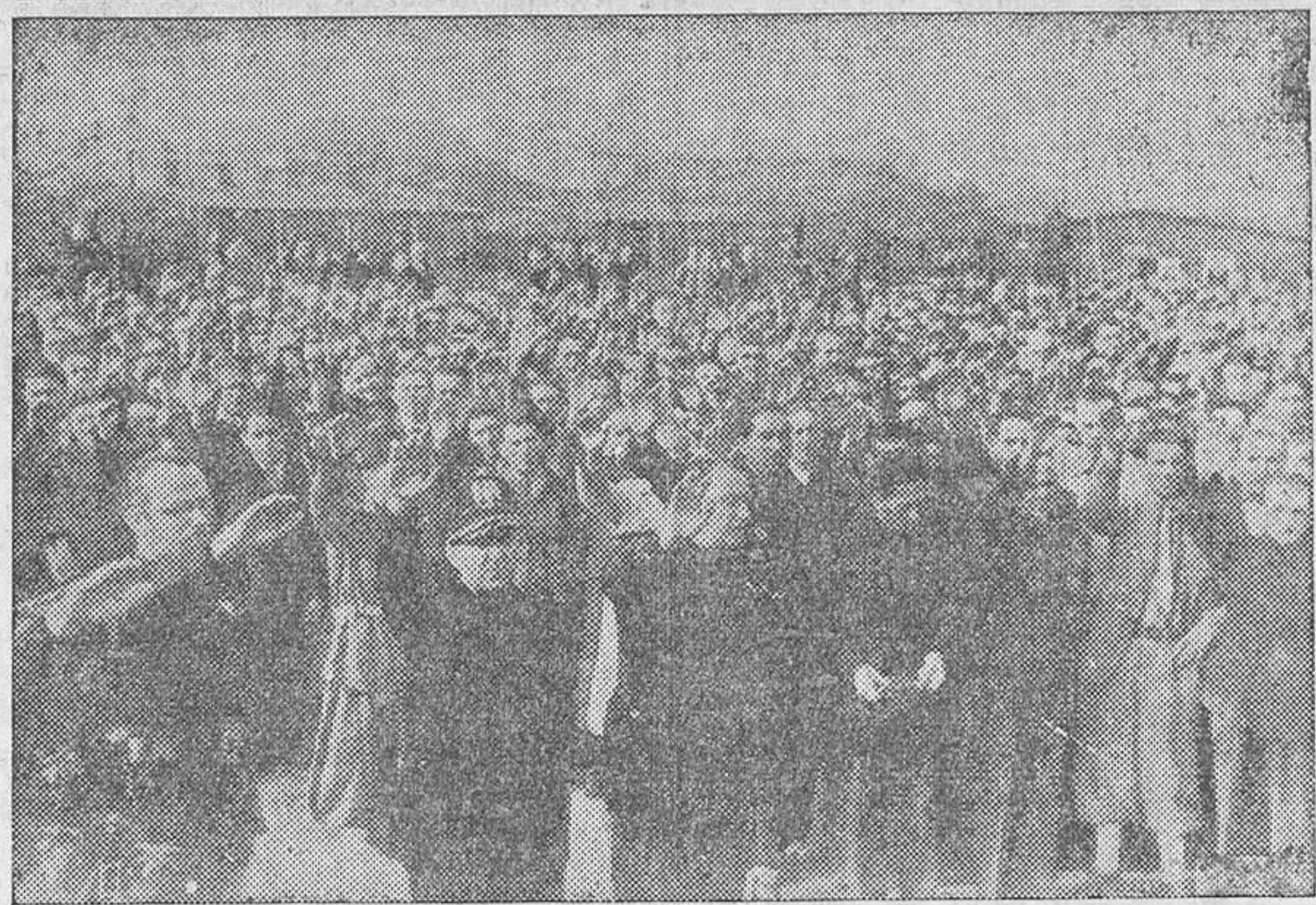
Los obreros italianos que trabajan en Alemania, reunidos para darles cuenta de la constitución del Gobierno Mussolini.

AMPLIA INFORMACION DEPORTIVA en páginas 5 y 6