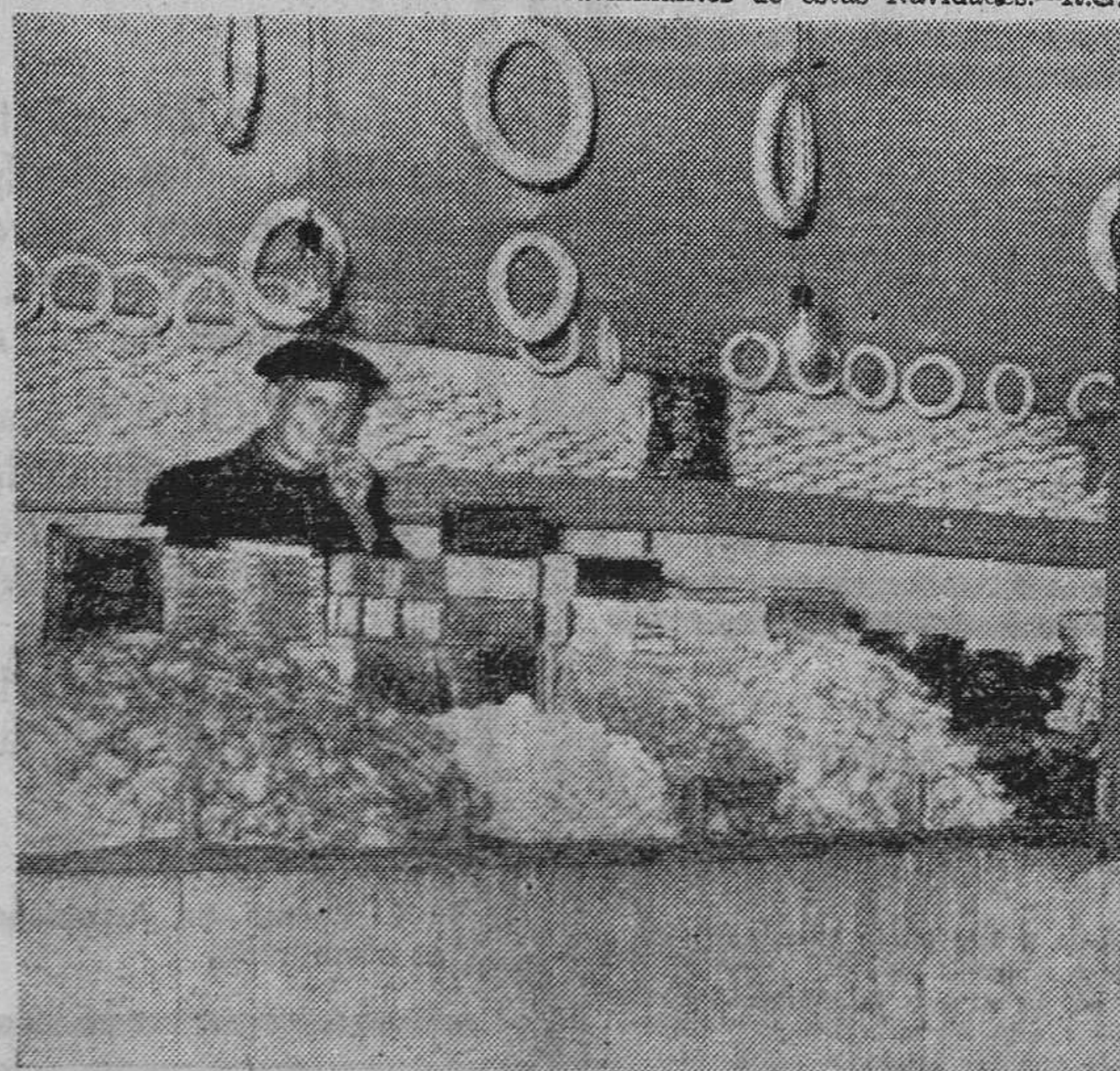
Uno de los puestos del dulce de Pascua instalados en Bibarrambla.