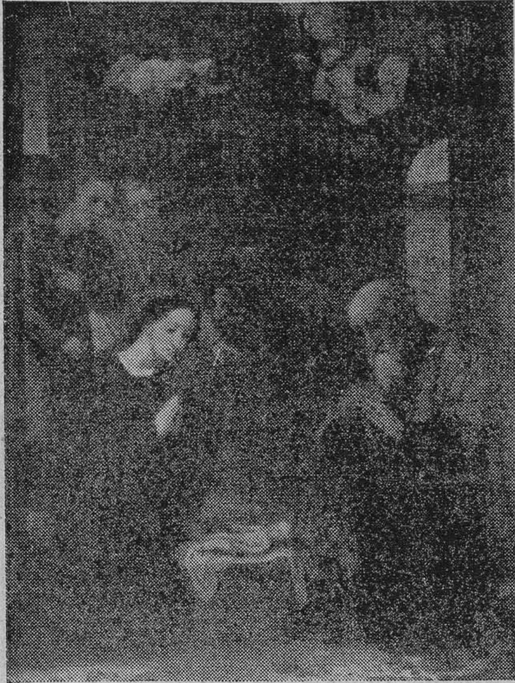
LA ADORACION DEL NIÑO JESUS