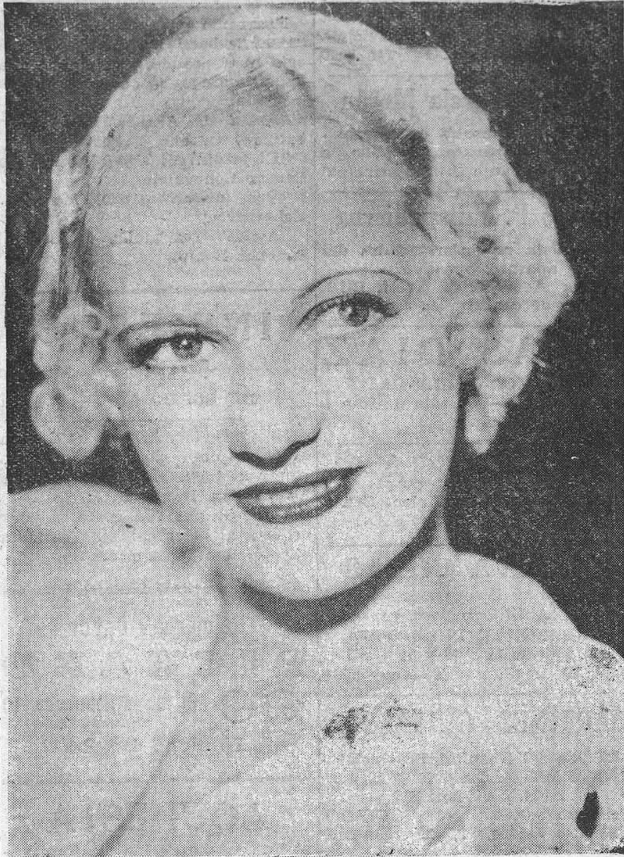
La gentilísima estrella alemana, triunfadora en Europa y América, Lillian Harvey, protagonista de "Mi debilidad", primera opereta norteamericana, estrenada ayer en el Campoamor.