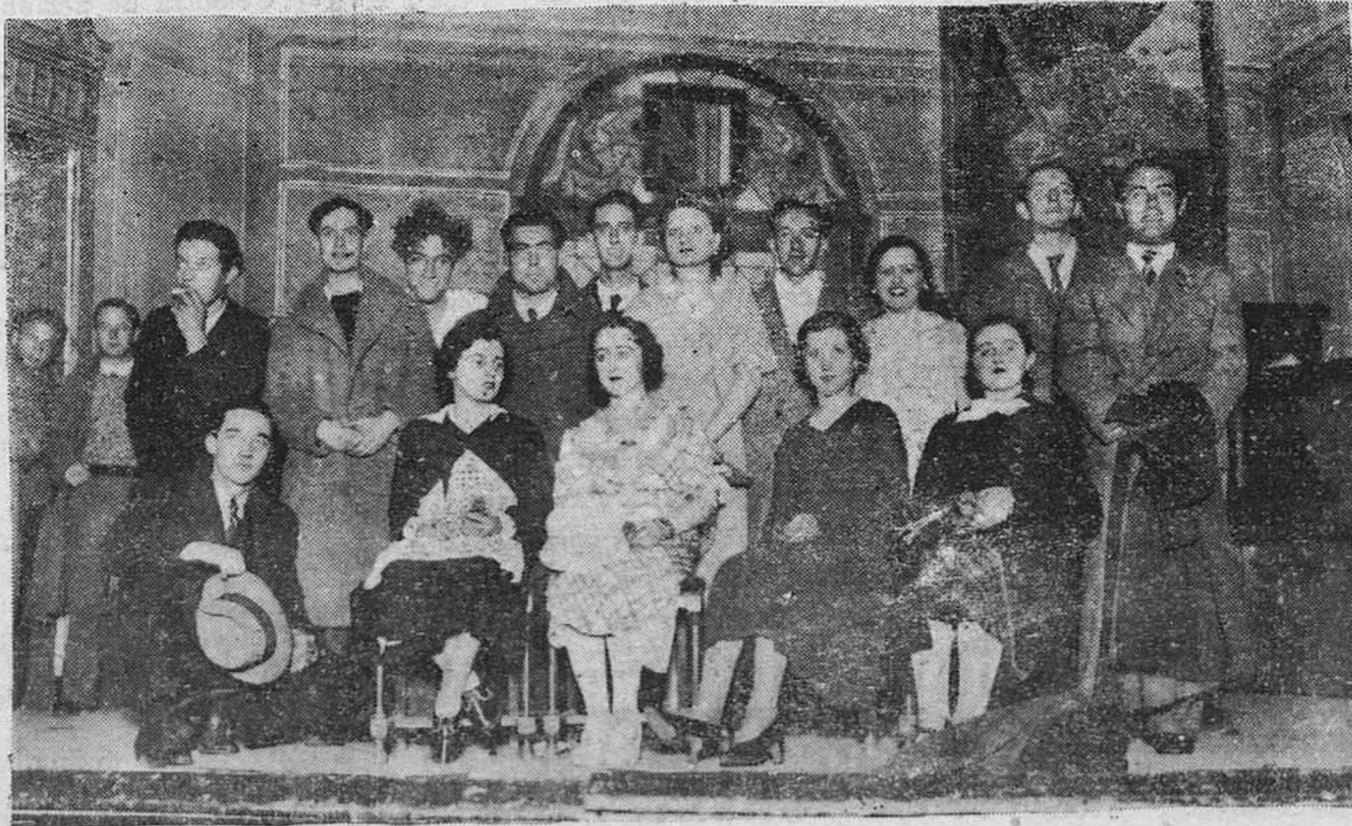
La Orquesta estudiantil de la F. E. C., que interpretó un admirable programa durante la ve.

SANTOS DE HOY.—San ta Francisca, romana. Nació en Roma; fué hija de nobles padres y dió desde niña mues tras de heróicas virtudes. En los años de su juventud no gu taba de los entretenimientos de otras doncellas, sino del reco gimiento y de la oración. sien do de 17 años, madre ya de hijos, alcanzó licencia de su marido para quitarse los ves tidos de seda y oro, las joyas preciosas y otras galas. Des de entonces se vistió de paño basto y se ejerció en admira bles obras de humildad, carida d y penitencia. Rezando el oficio de la Virgen cuatro ve ces dejó la antifona en que es taba, por llamarla su marido y volviendo a su rezo, halló la antifona escrita con letras de oro en premio de su pun tual obediencia a su marido.