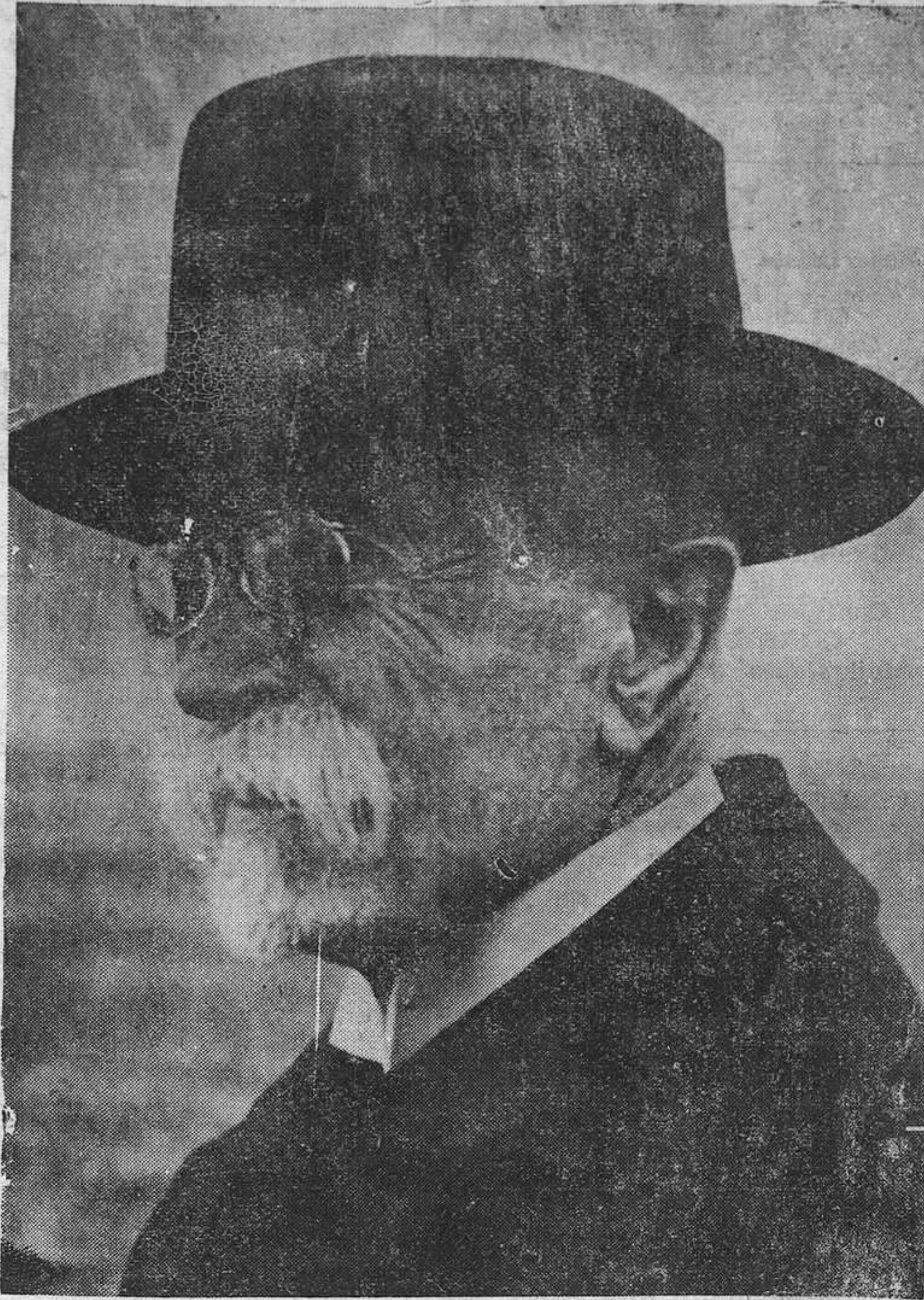
Mr. Masaryk presidente de la República checoslovaca, que ayer cumplió los 84 años de edad.