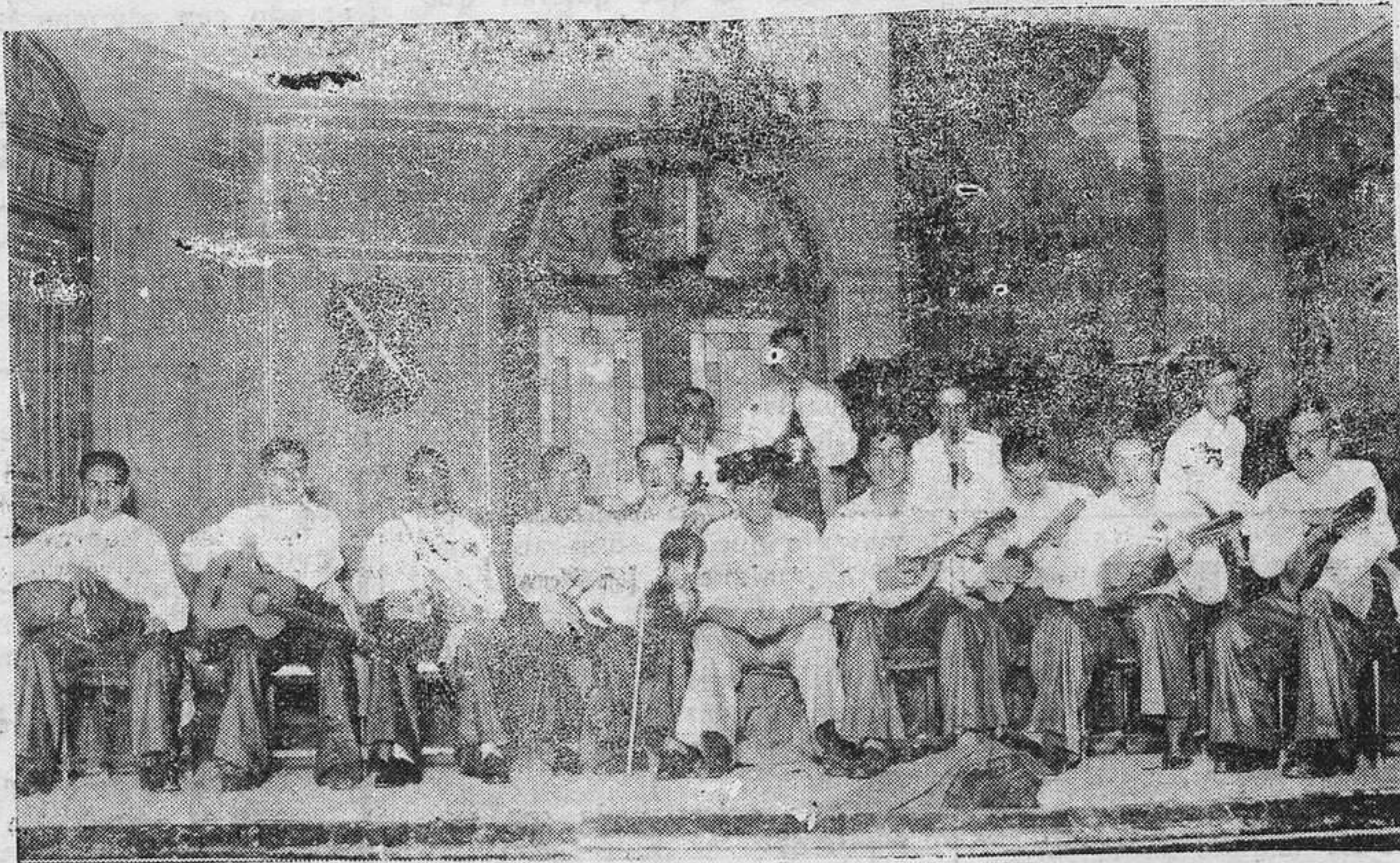
Cuadro Artístico de los Estudiantes Católicos, que debutó anteayer