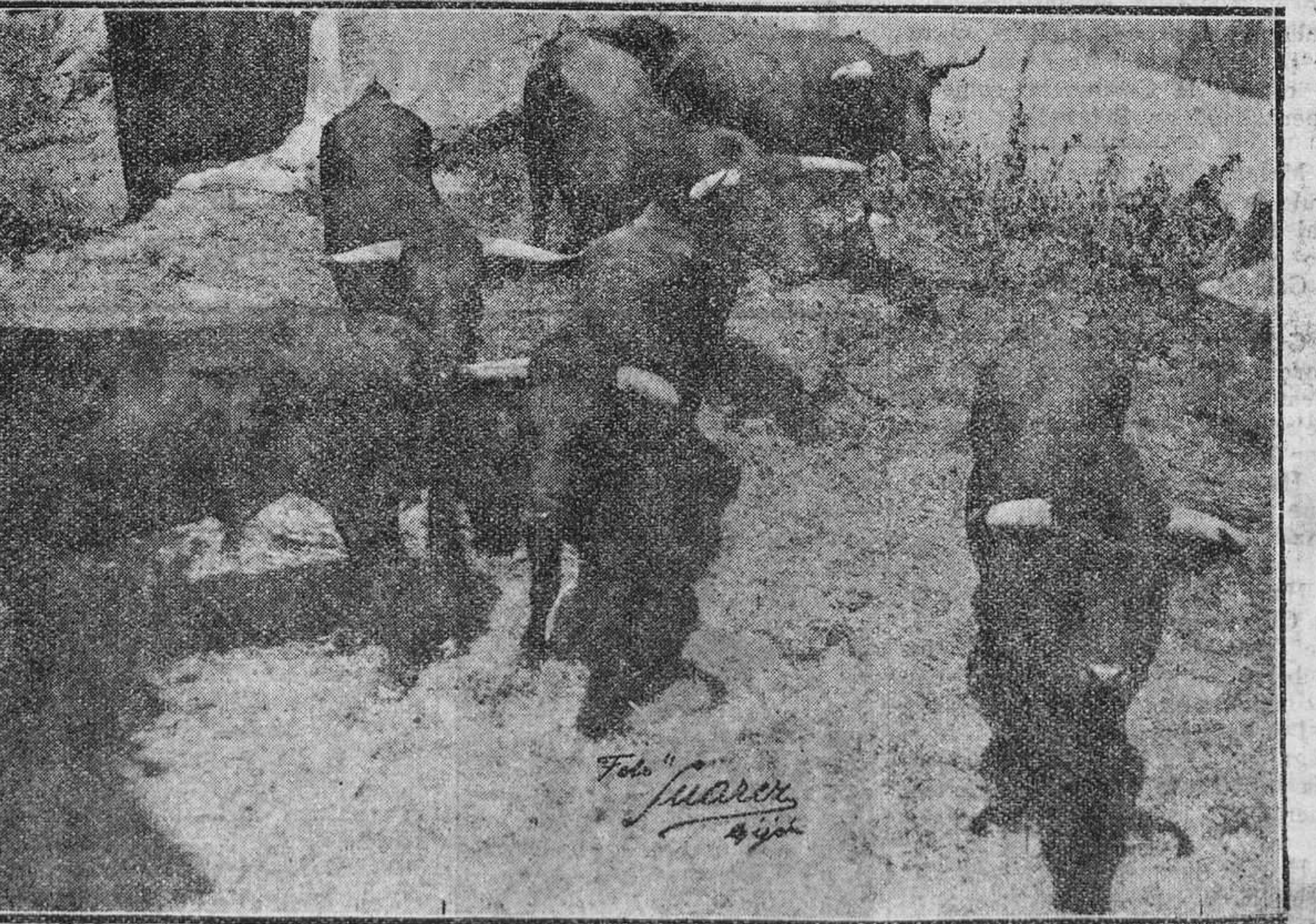
Ahi están esos seis "monumentos" con pitones, que hoy serán muertos a estoque—eso es lo que deseará la afición—por tres valientes novilleros que quieren llegar. Mucho ganado es para lidiar sin la suerte de varas; pero como en los "gladiadores" taurinos hay amor propio, la corrida de toros de hoy, sin picadores, será un acontecimiento de comienzo de temporada. Como dato curioso: que una señorita con excelentes condiciones de ecuyero, correrá la lieve.