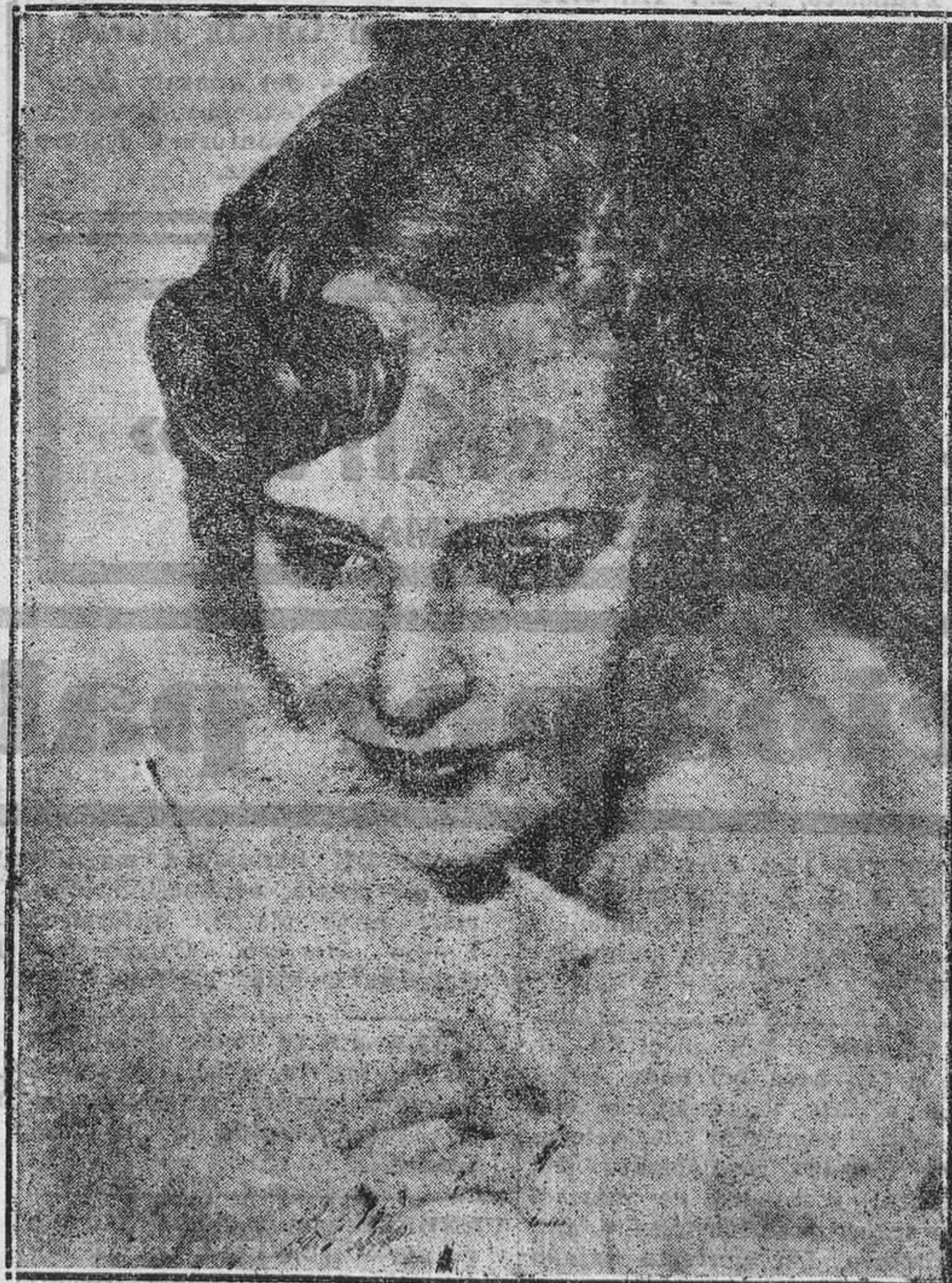
Madge Evans, tan discreta como ella, aspira a lo que ella llama "un estado seguro de paz". Para lograrlo, no tendría inconveniente en renunciar a su carrera cinematográfica, si fuera necesario. Pero esto no le impide ser una de las actrices de más talento con que cuenta el séptimo arte.