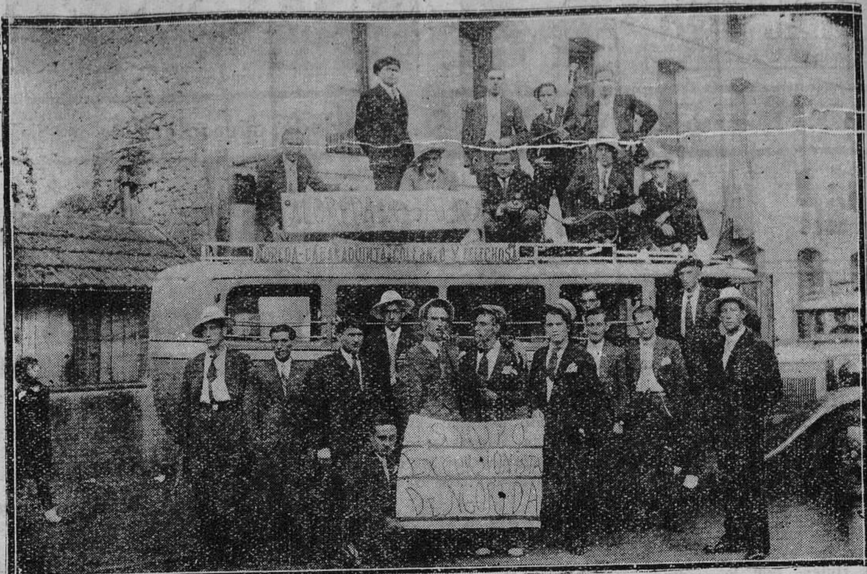
MOREDA.—El grupo excursionista camino de la villa de Salas.

Redactor corresponsal en Gijón, don Corsino Ordiz, Linares Rivas, 17