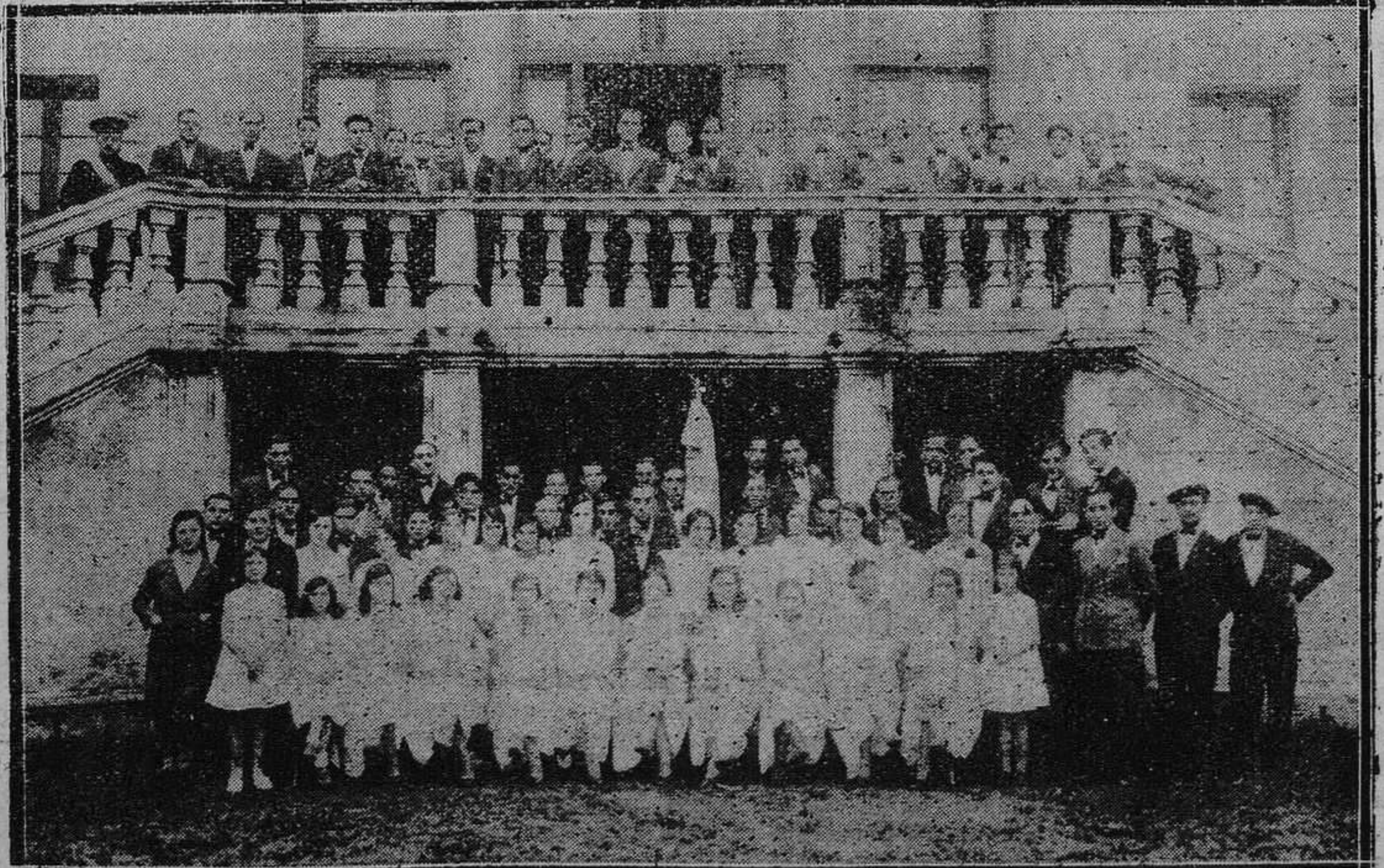
MOVEDA.—El Orfeón local, que está realizando una brillante labor artística.