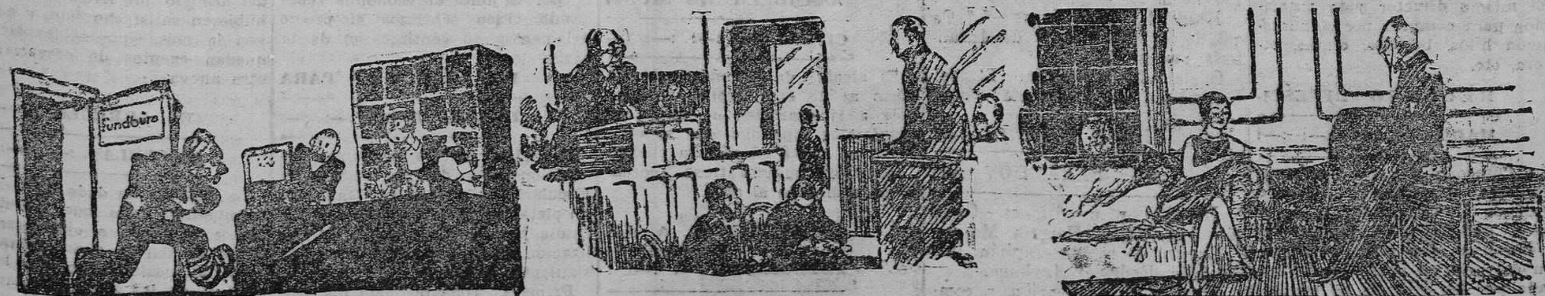
En la oficina de objetos perdidos, —¿Han encontrado ustedes un paracaídas?