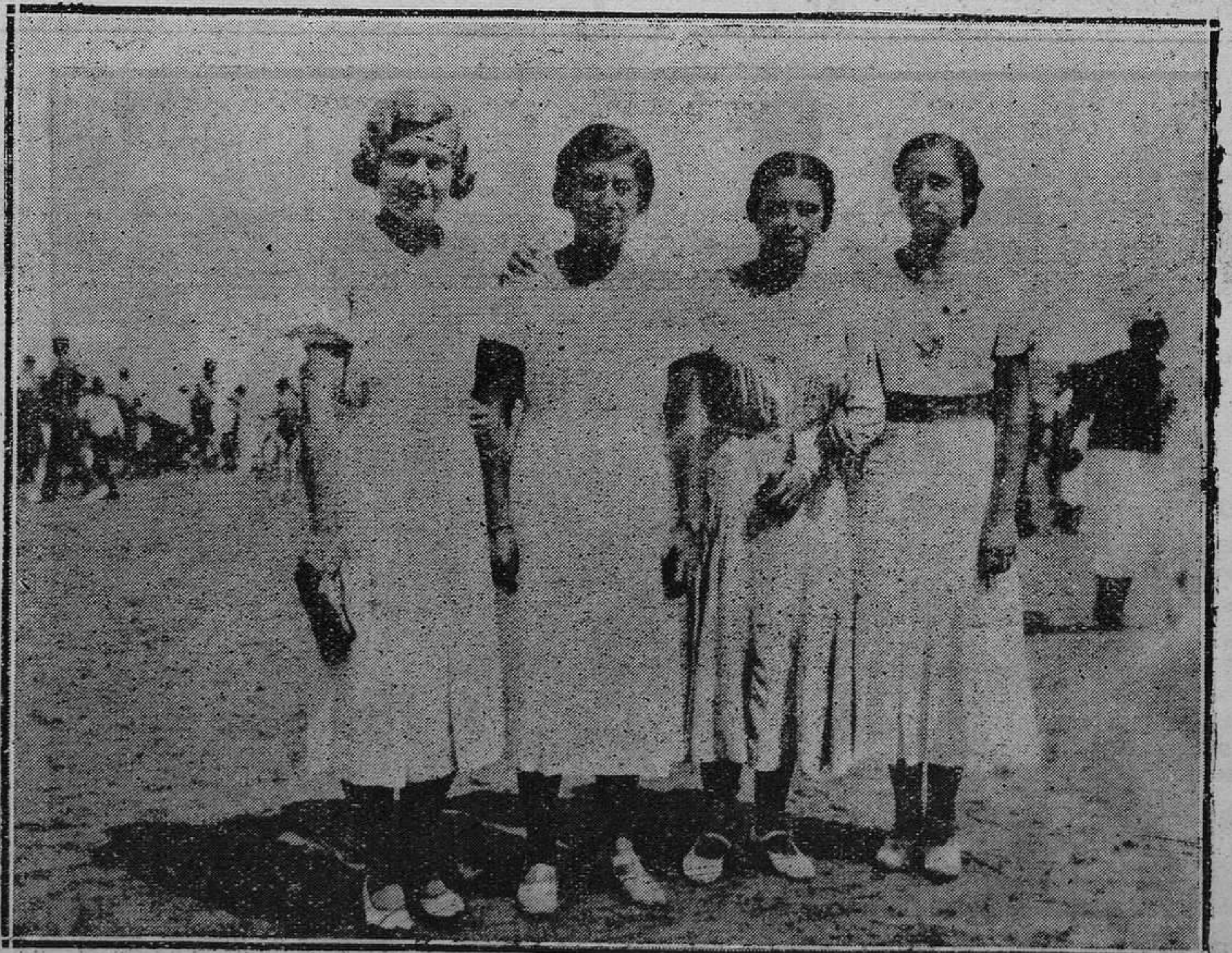
GIJÓN.—Un grupo de cuatro bellas señoritas gijonesas en nuestra playa..

Se ruega a los acreedores del contratista de la FABRICA DE ARMAS (Colonia Obrera) remitán su dirección a los Almacenes de Maderas de Rubín, Oviedo, para informarles.