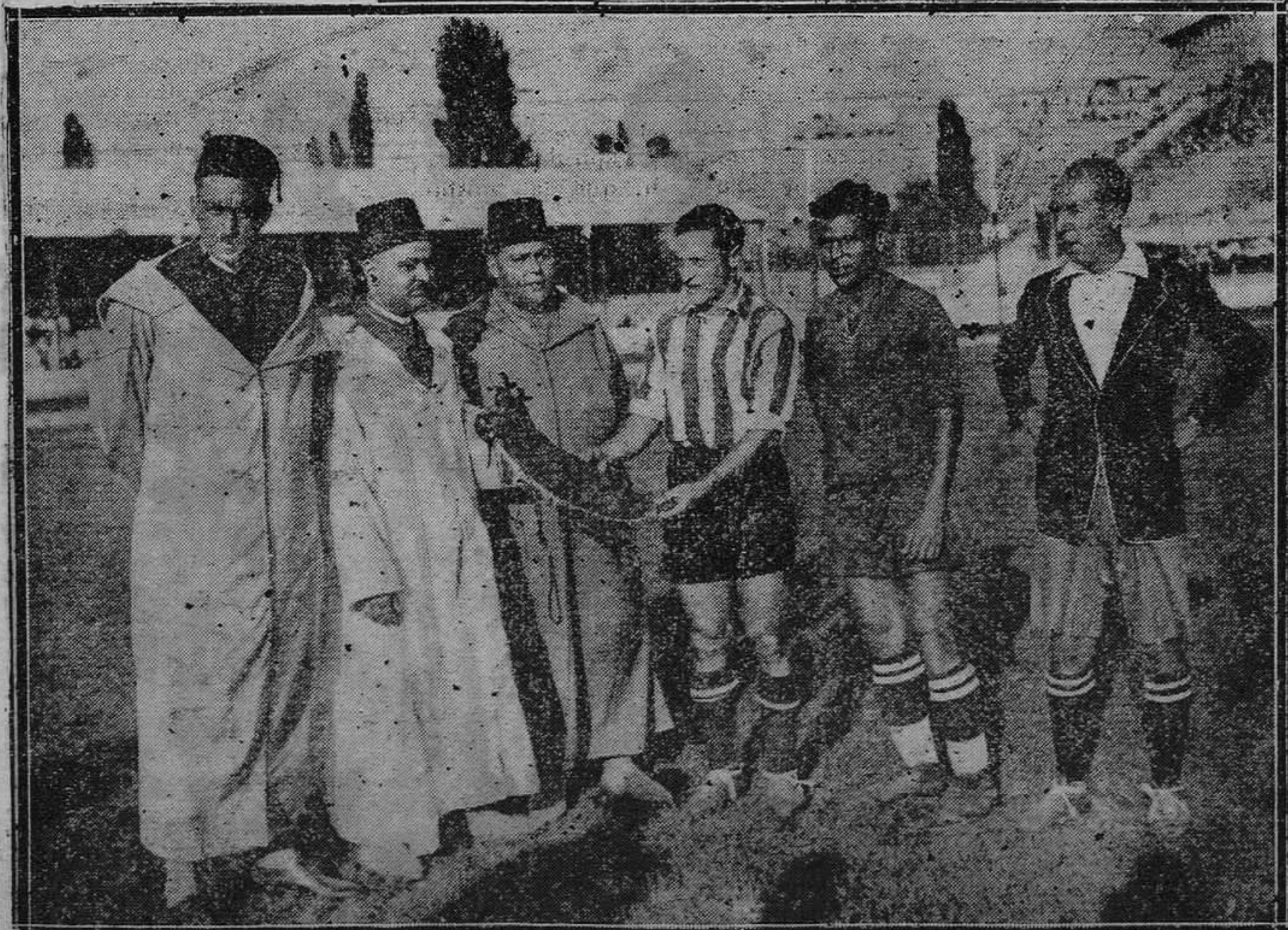
MADRID.—Los capitanes de los equipos "Mogreb", de Tánger, y Atlético de Madrid, antes de empezar el partido jugado entre los dos citados equipos.

En fin, Recaredete, puedes irte a paseo cuando gustes. Si pongo que continuarás con tus insultos, pero no esperes que descienda hasta ese nivel en que te sitúas. Además de que eso es una cosa muy poco elegante, me inspiran el más olímpico desden los ladrillos de los falderillos.