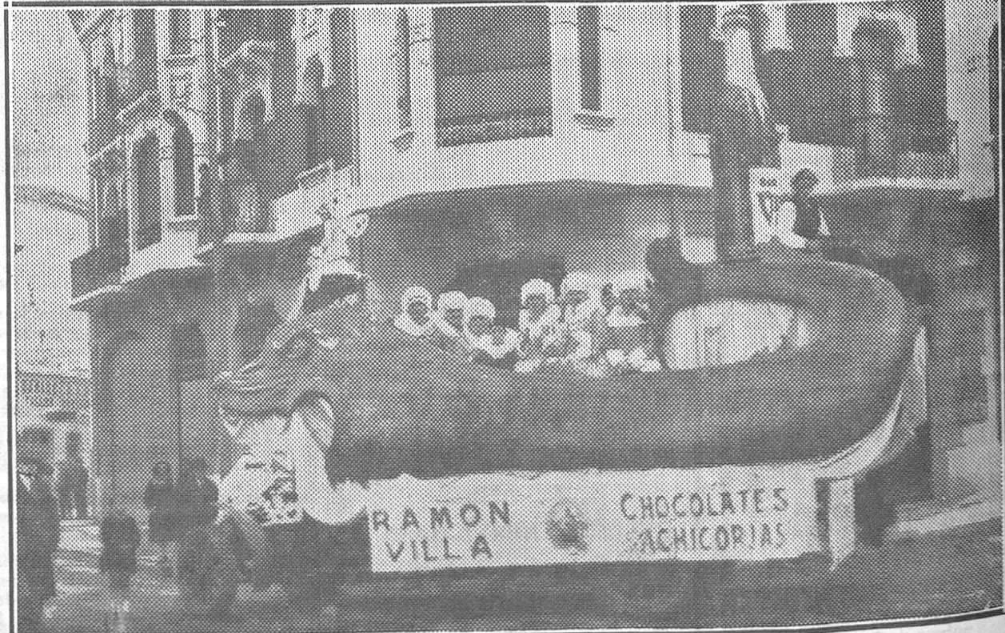
La hermosa carroza anunciadora del vino «Viver» que el domingo recorrió nuestras calles