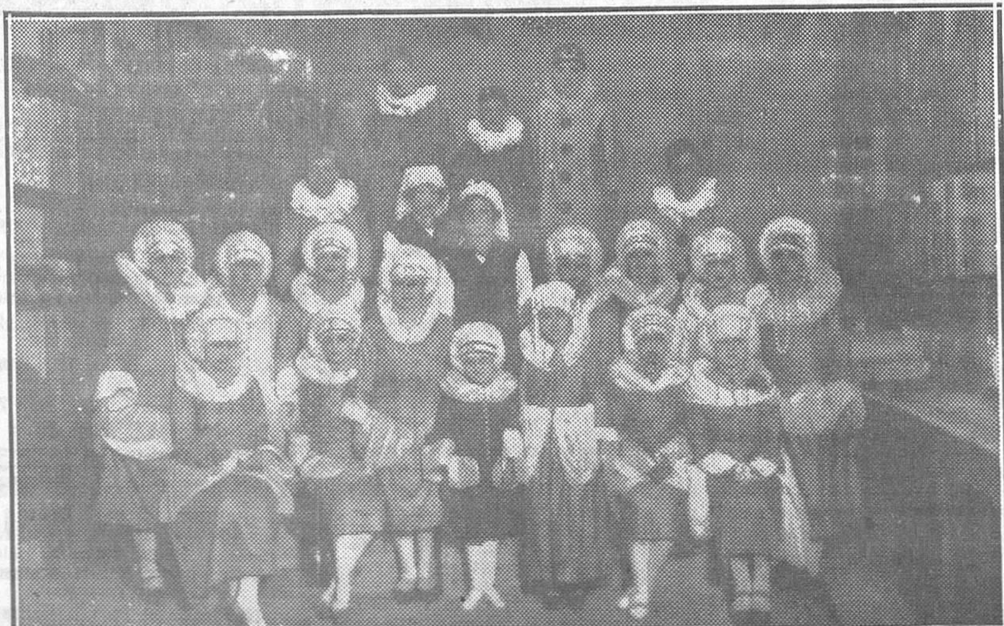
Bellísimas señoritas que iban en la carroza anunciadora del vino «Viver»

VISITAD EN GIJON EL Restaurant "MERCEDES"