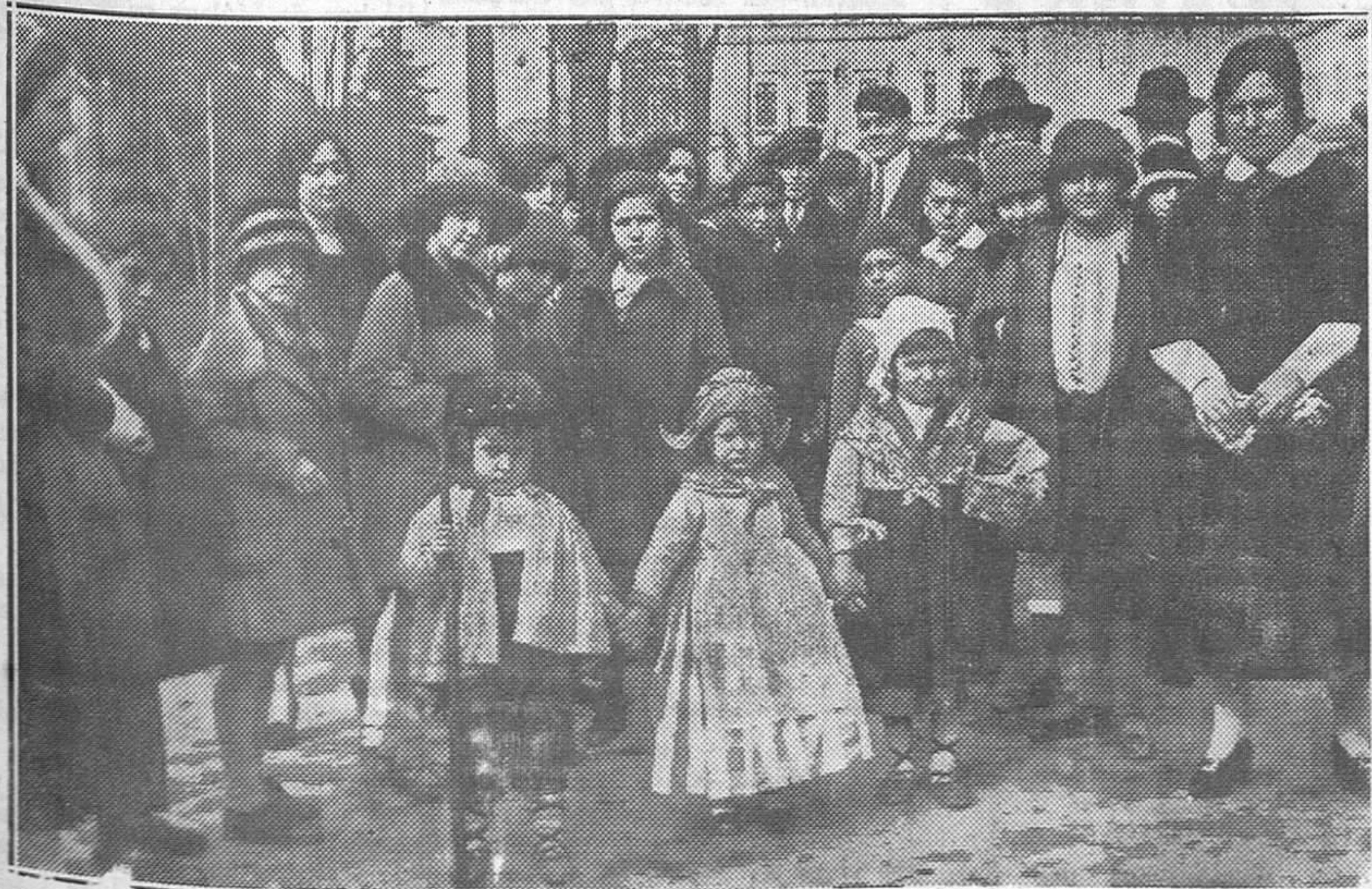
Un grupo de niños que recorrieron nuestras calles bellamente ataviados

Nos es imposible publicar un artículo que tenemos dispuesto de nuestro colaborador «All-Bey»