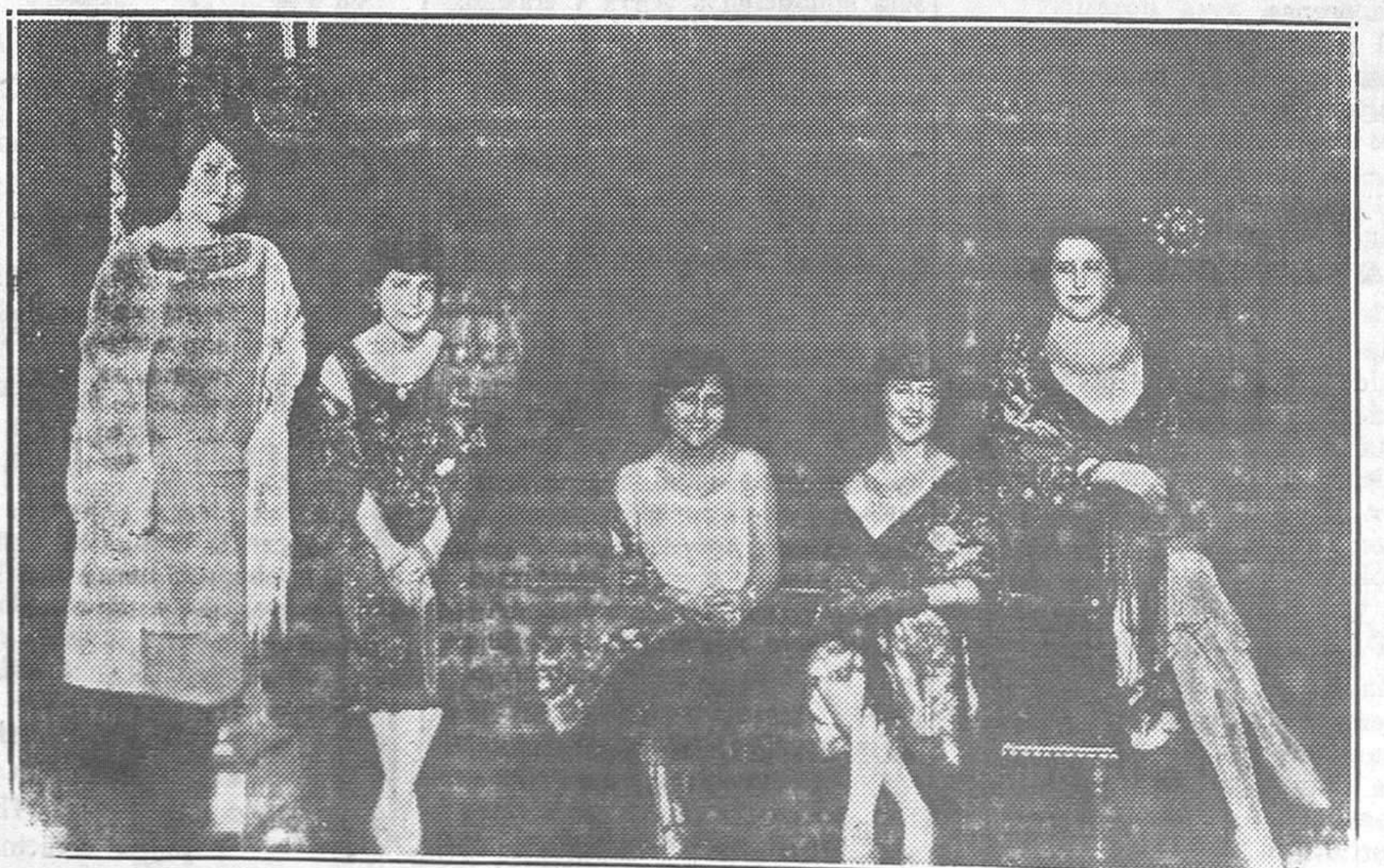
Distinguidas y bellas señoritas que asistieron al baile del Casino