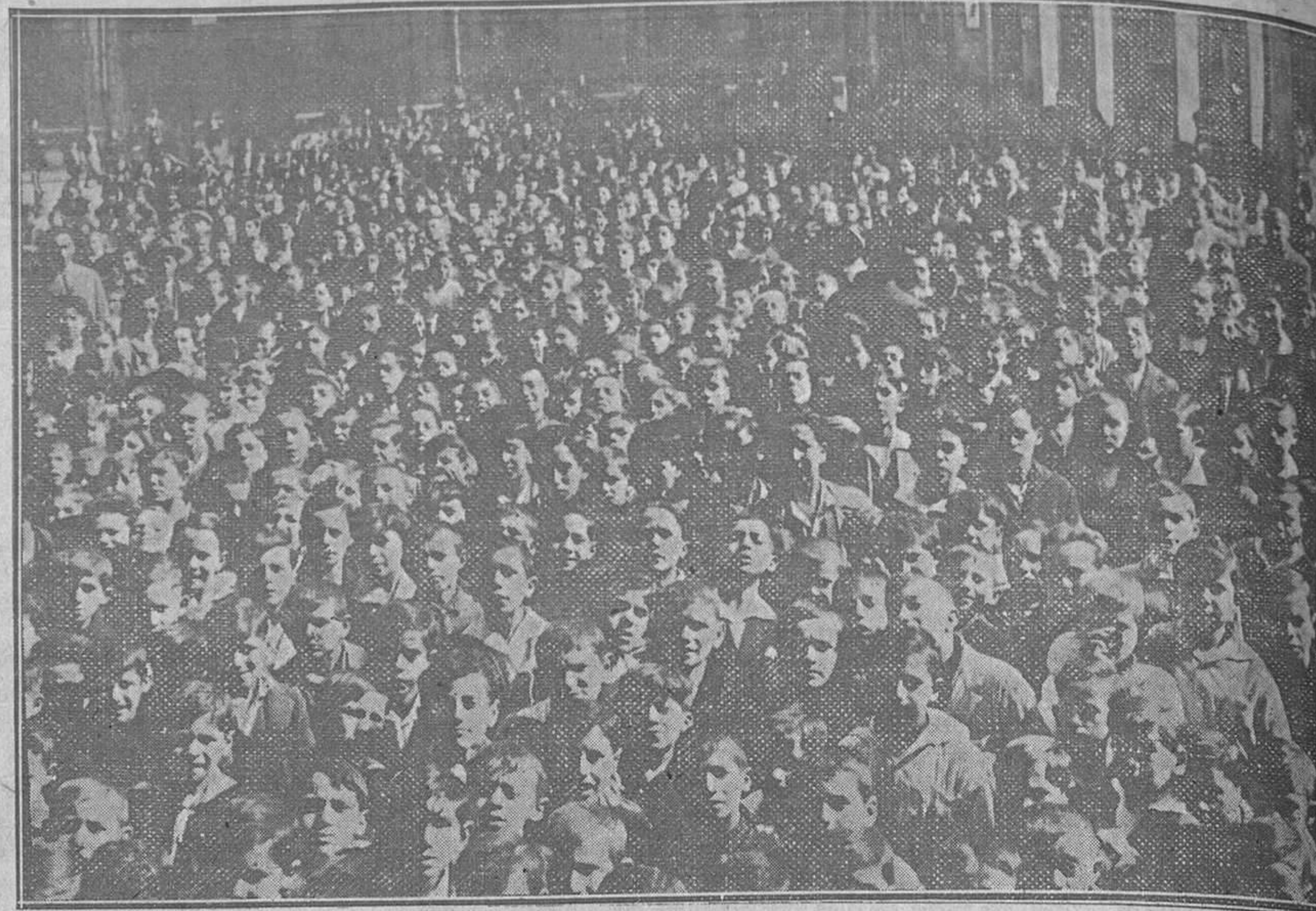
A LA MEMORIA DE LA REINA DOÑA MARIA CRISTINA.— Los niños de las escuelas públicas de Oviedo que el sábado último asistieron a la misa de requiem por el alma de la reina madre, dando una nota muy simpática