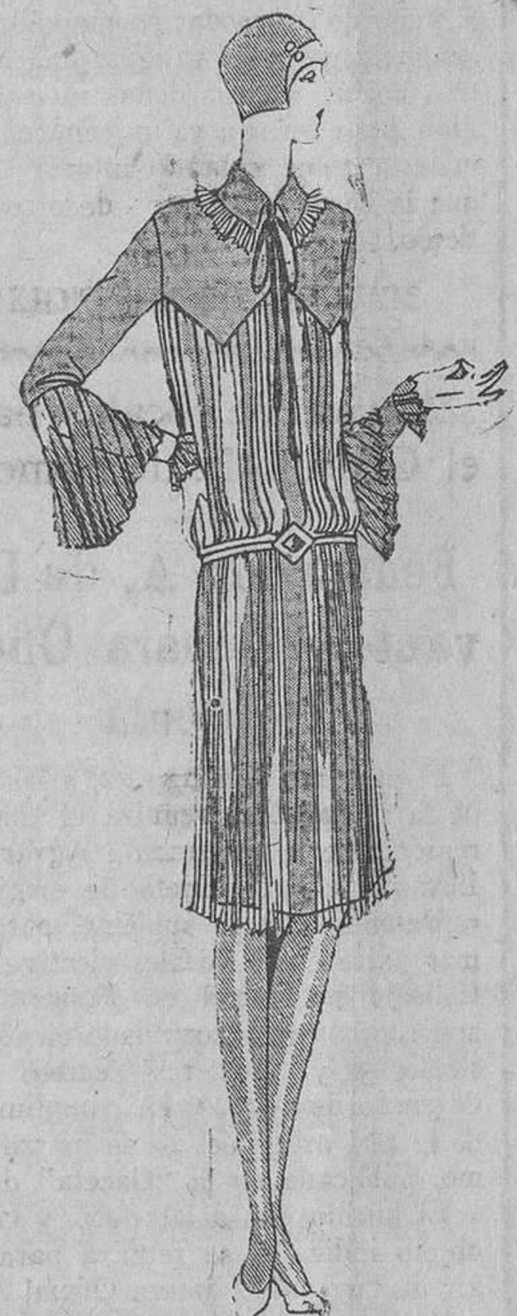
Traje en crepón de China verde-almendra, completamente plisado, salvo las mangas, el cuello y el canesú...