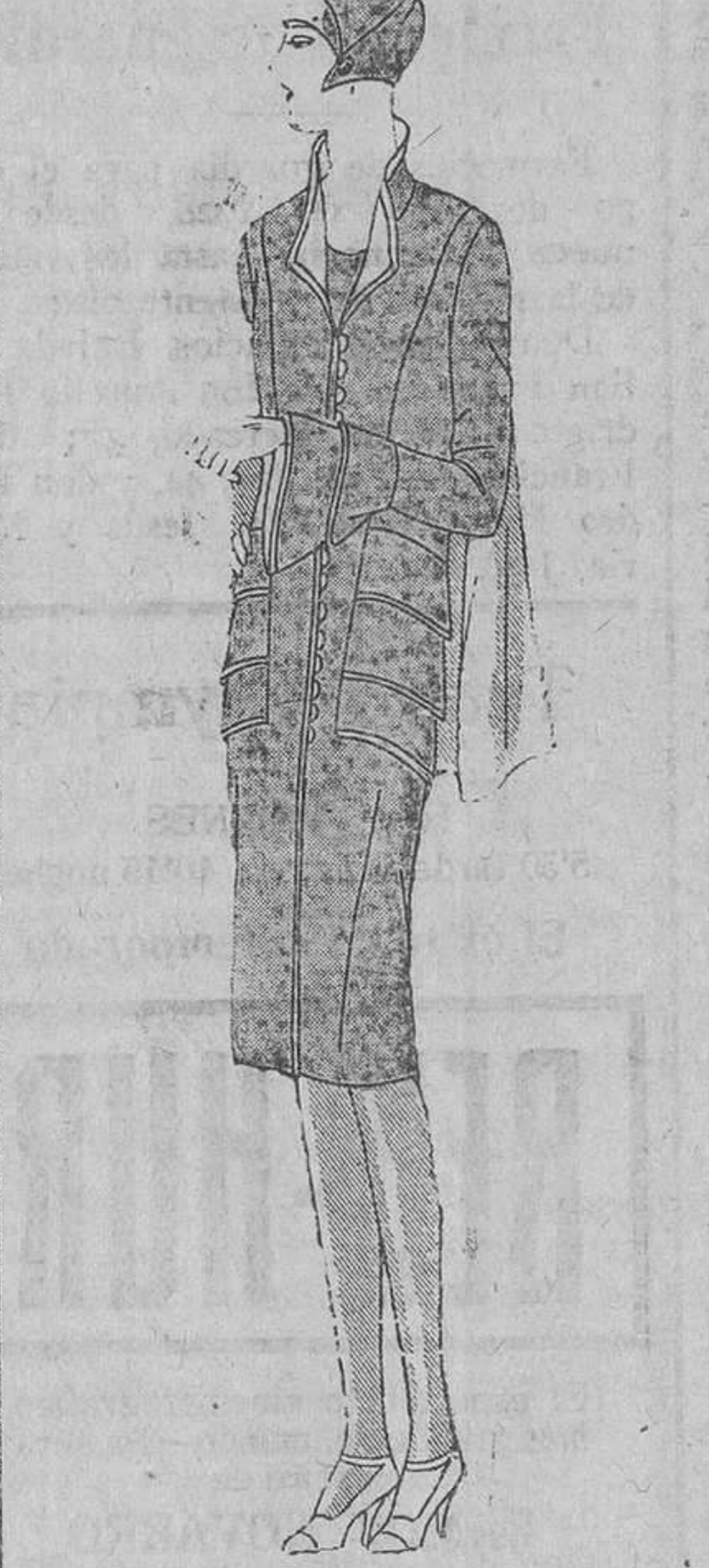
Abrijo de entretiempo, en marroquí de lana color cacao. Algunos volantes en bias y una pequeña capa, le dan todo el aspecto de un traje