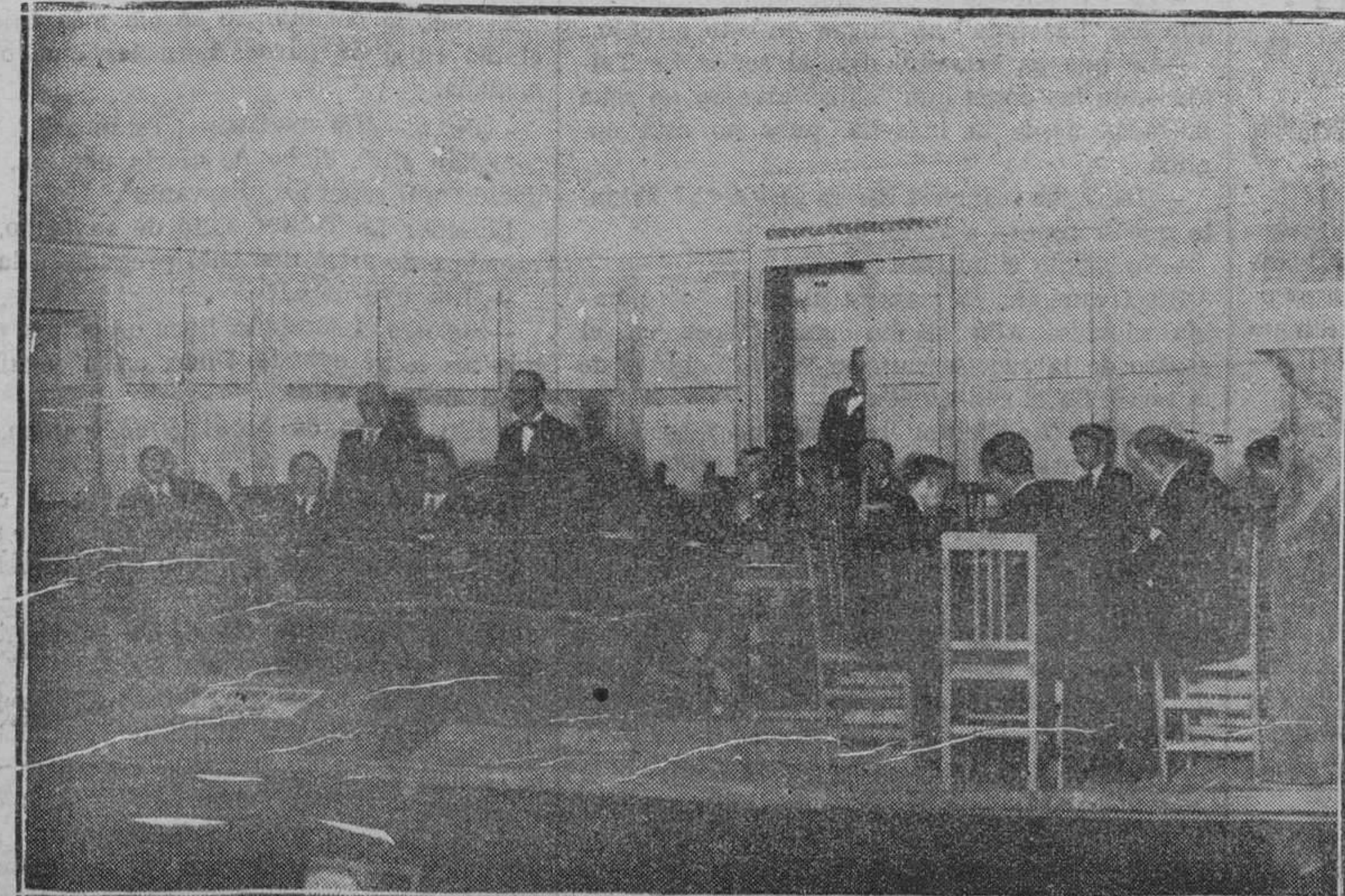
Mitin organizado por el Ayuntamiento en el teatro Español.