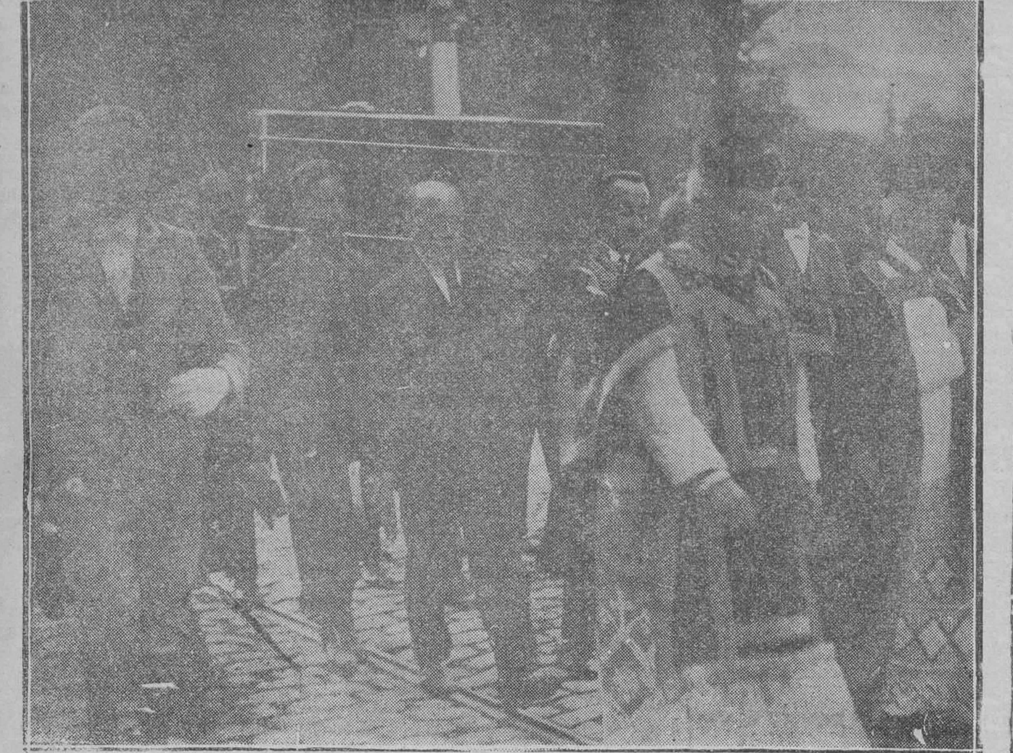
Amigos y admiradores de Sorolla conduciendo a hombros a la estación del Mediodía los restos del gran pintor.