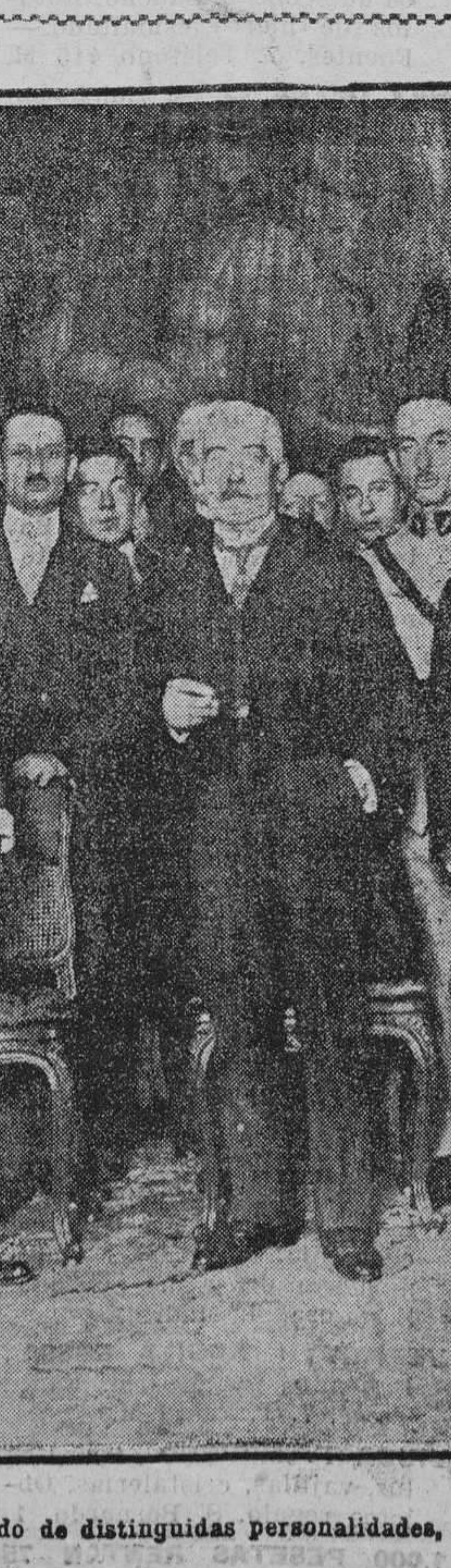
El embajador de Francia, rodeado de distinguidas personalidades, en la recepción dada con motivo de la fiesta nacional del 14 de julio.