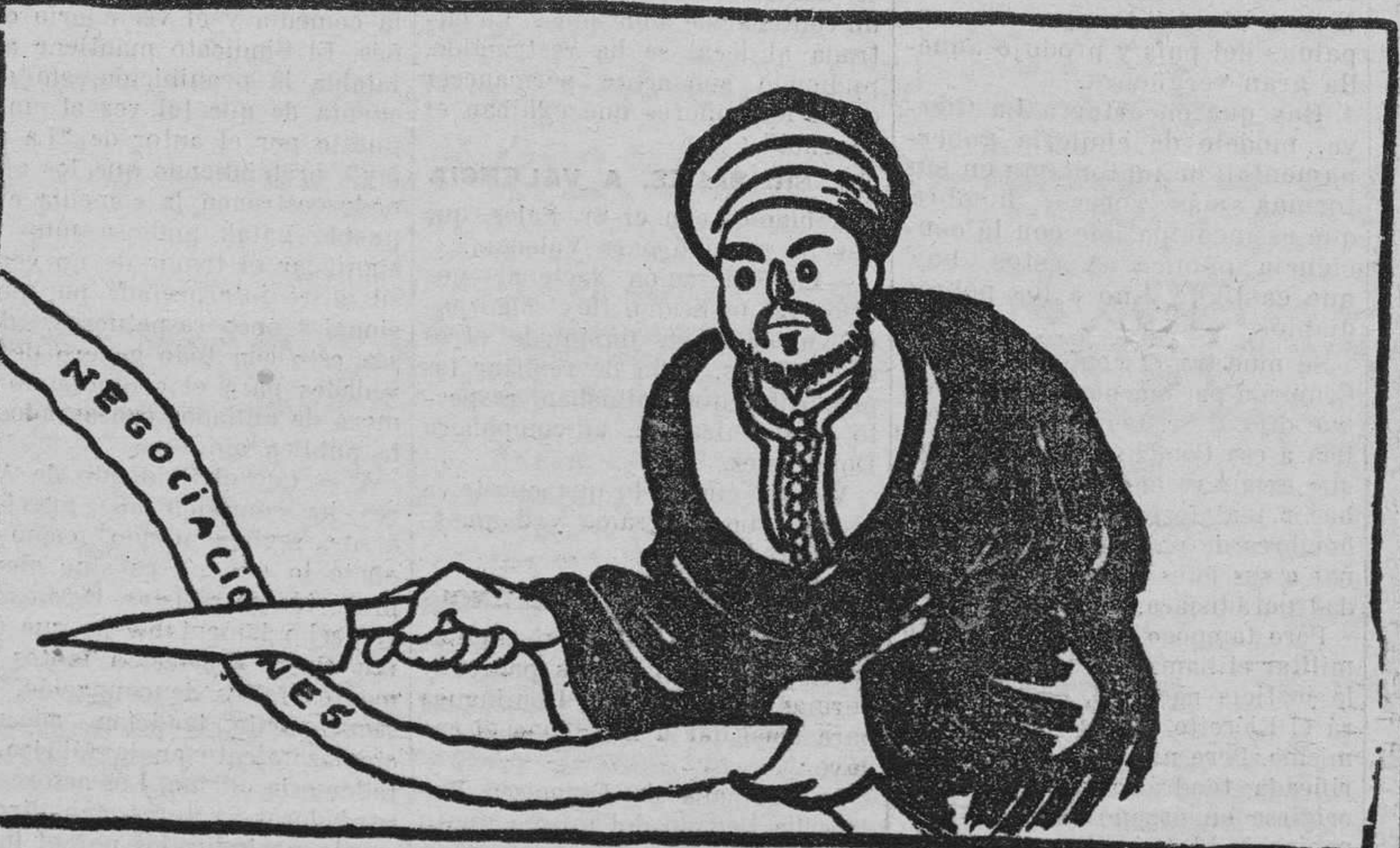
ABD-UL-KRIM.—¡Nada, nada! ¡A comer!