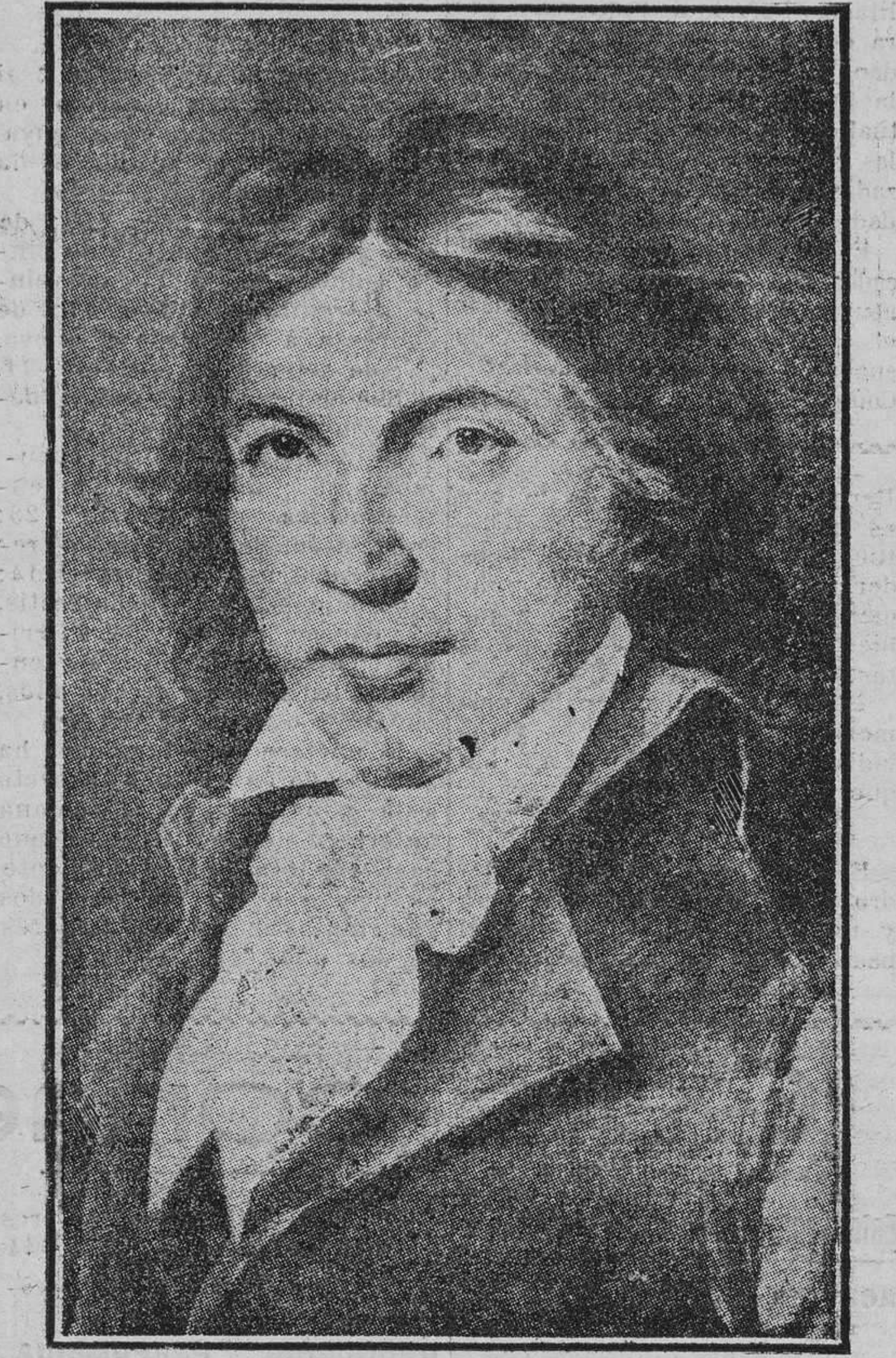
Camilo Desmoulins, según el retrato de Rouillard que se conserva en el Museo de Versalles.

Tenía una nariz sobrada larga, que iba ensanchándose hacia la punta, boca grande, labios gruesos, barbilla puntiaguda, ojos que parecían abrirse con esfuerzo bajo unas enormes cejas, y una frente alta, como un torréon, sobre la que caían los retorcidos bucles de su romántica melena.