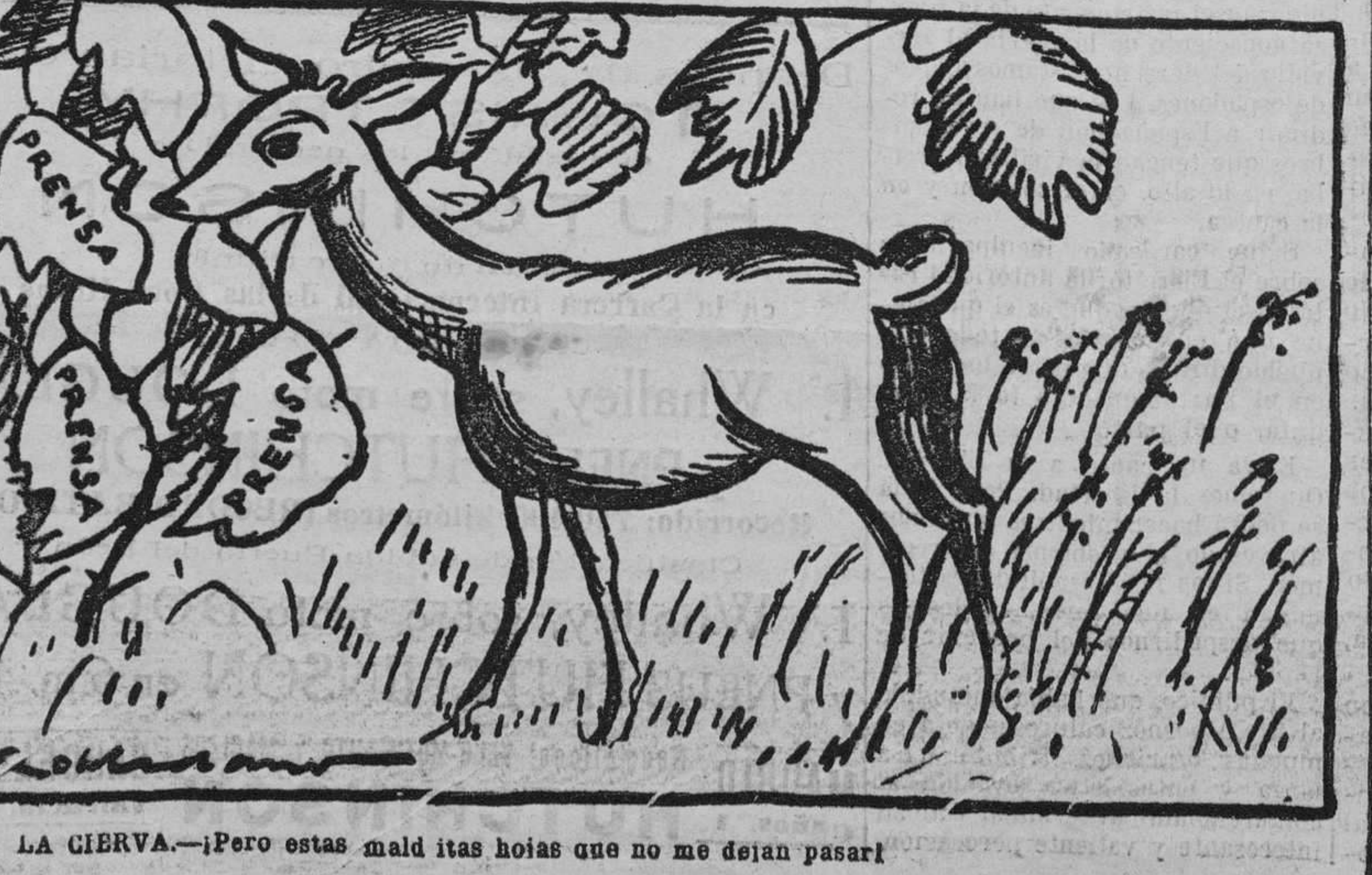
LA CIERVA.—¡Pero estas malditas hoiyas que no me dejan pasar!