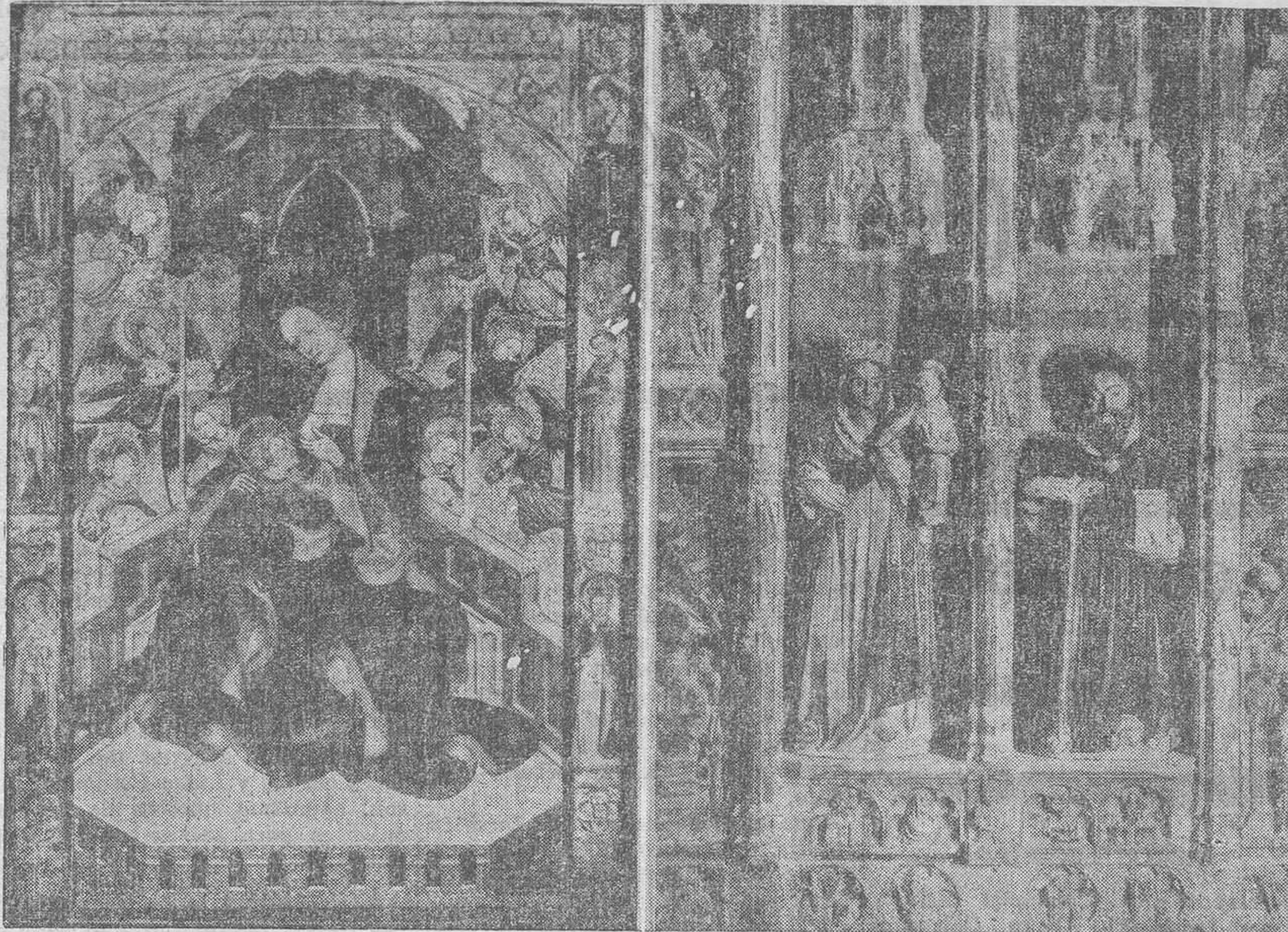
Mesa de la Virgen de Cervera (siglo XV) y Retablo en piedra de Gerp (siglo XIV)

En la sala catalana del siglo XVI, hay exhibido el retablo de los plateros y de otros contemporáneos. En esta sala una puerta conduce al ane-