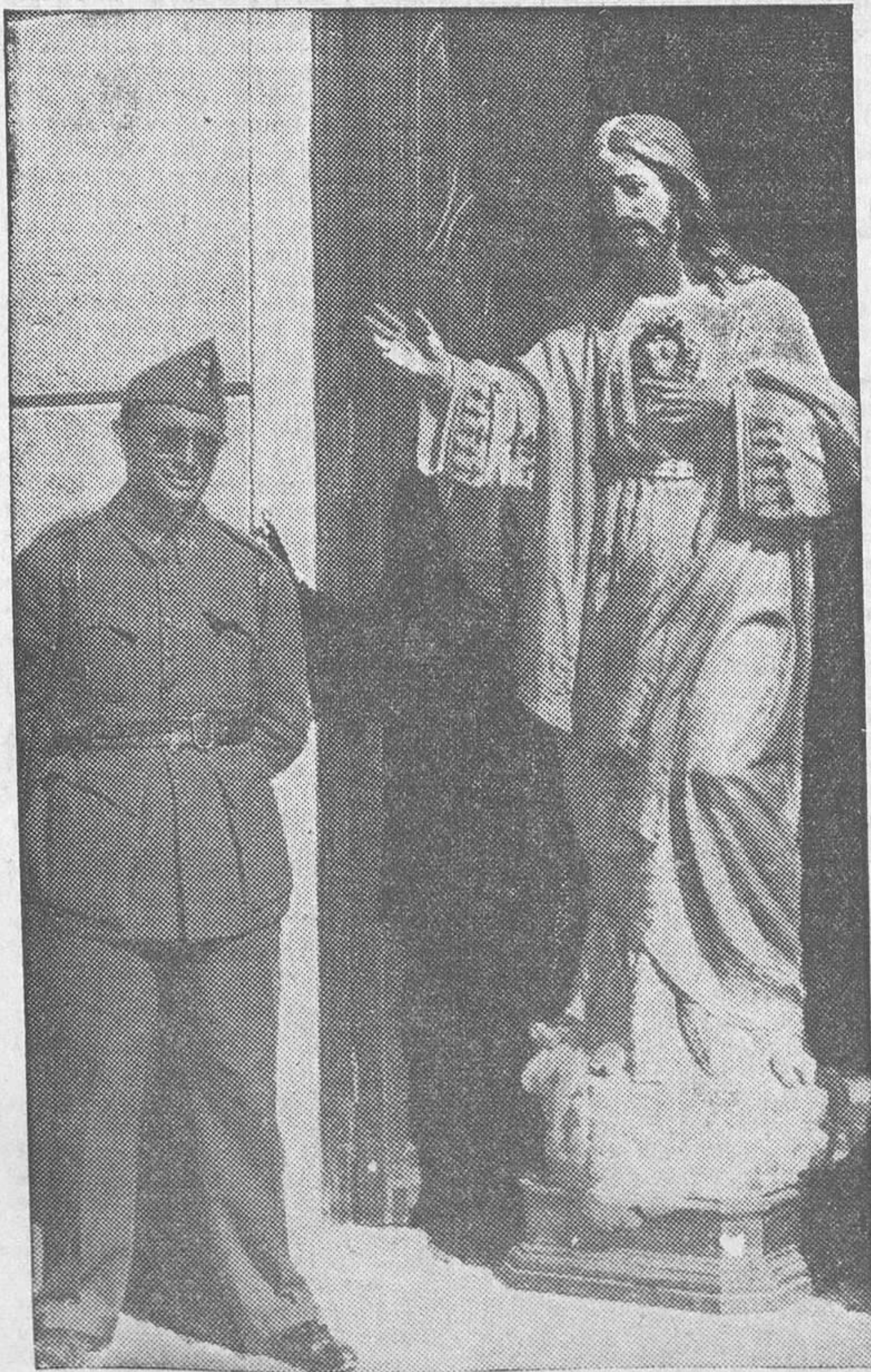
Imagen del Cristo al que los revolucionarios de Bembibre sacaron de la iglesia para que no se quemase y le pusieron el letrero: «Cristo rojo: A ti no te hacemos daño porque eres de los nuestros.»