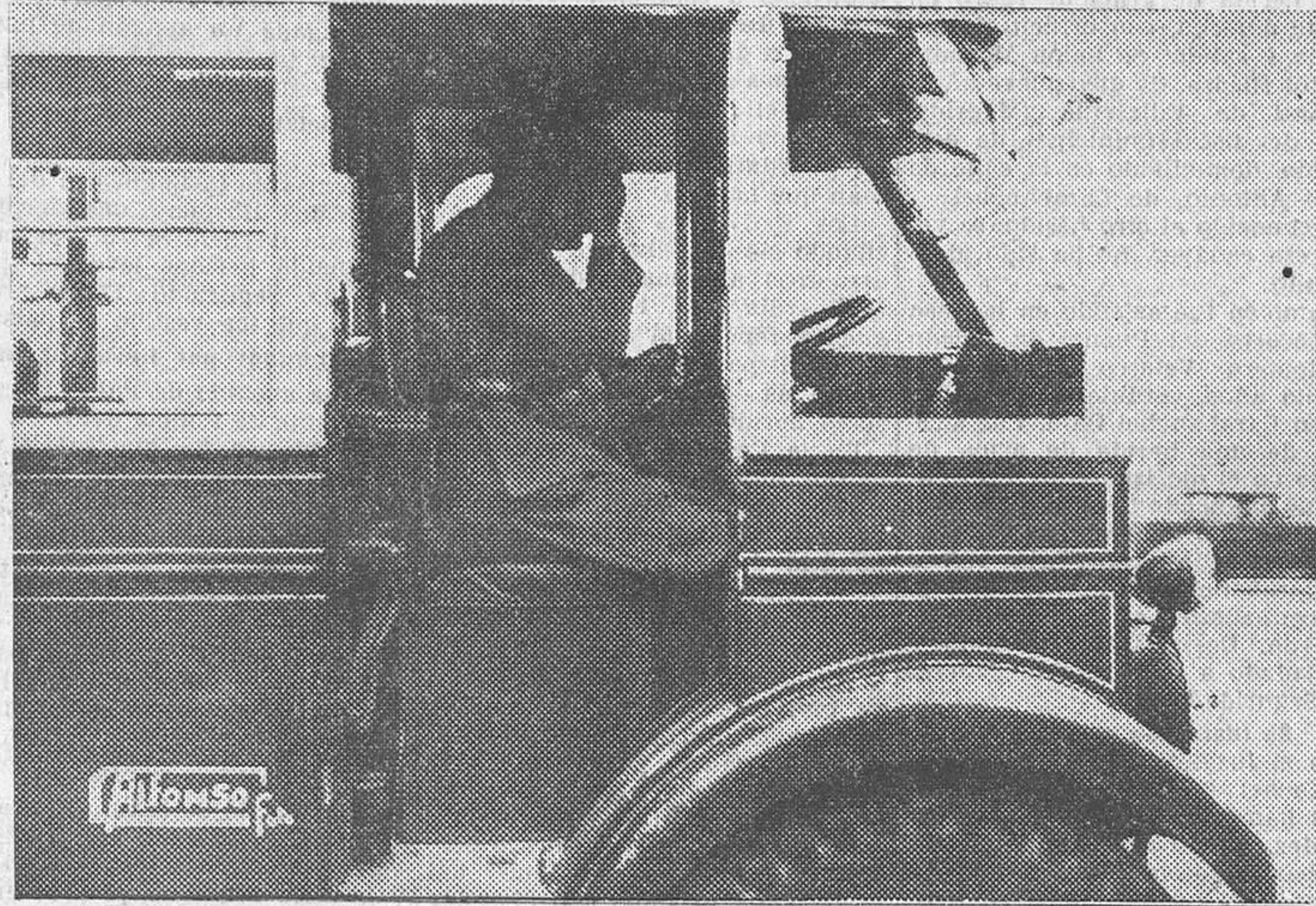
Fuerzas del Ejército conducen de los autobuses durante el paro