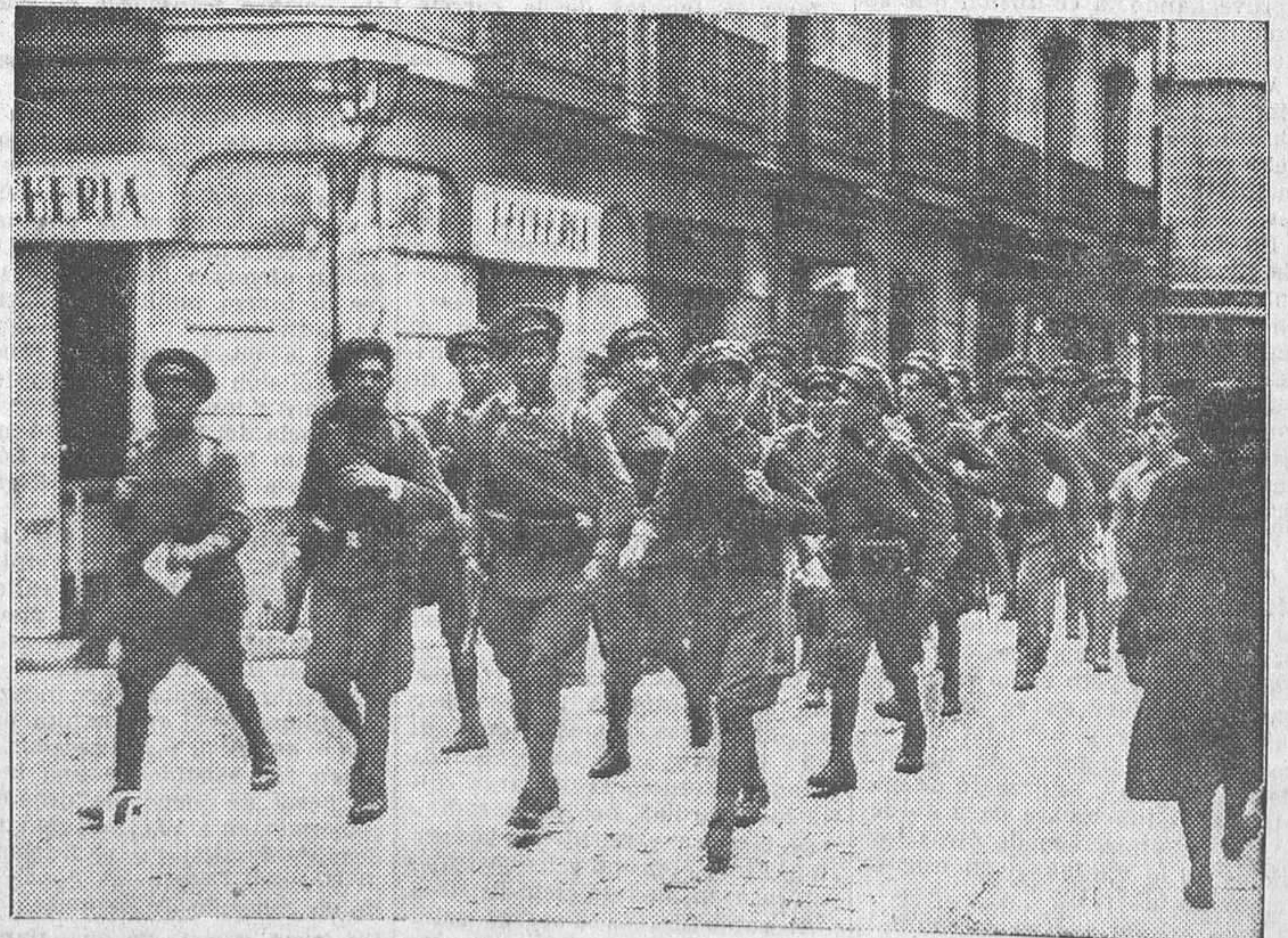
Fuerzas del Ejército recorren de las calles de los barrios bajos durante la huelga de ayer