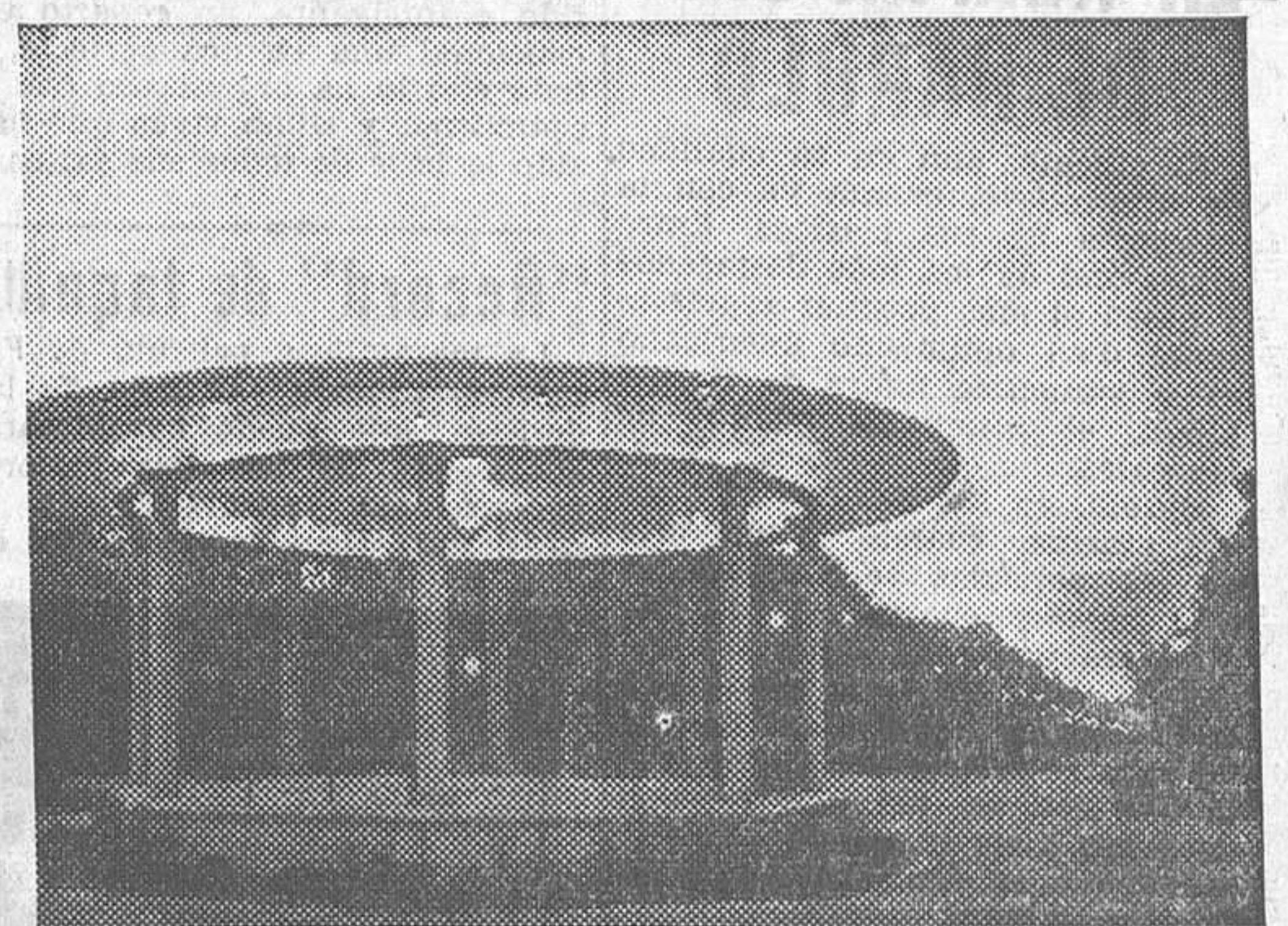
ALBACETE.—Vista del quiosco de música, construido recientemente en el Parque de Ganalejas