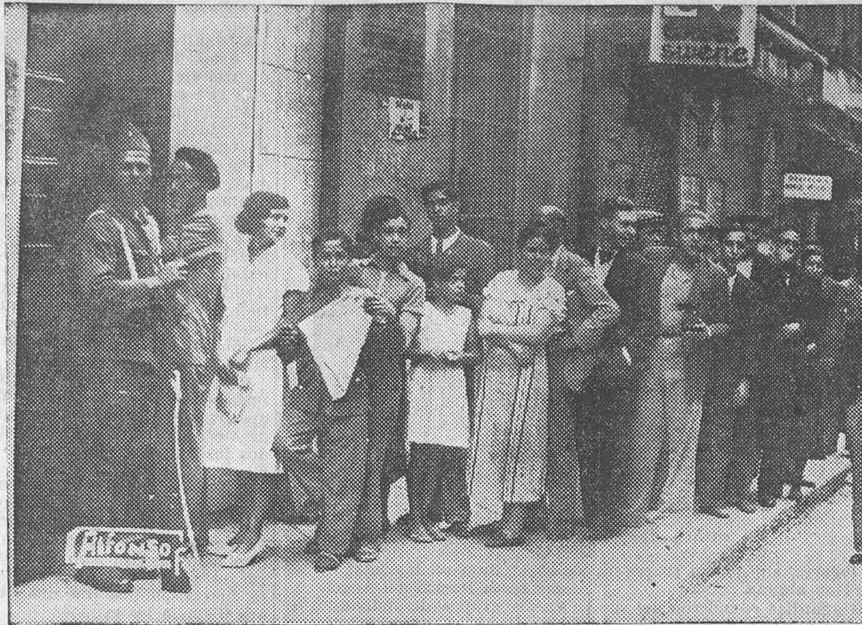
Una de las colas en la puerta de una tahona

Como quiera que repartidores y vendedores de diarios secundaron también la huelga, la Dirección de Seguridad ocupó de atender el servicio de venta de periódicos, y a tal efecto se montaron puestos para expender la Prensa de la