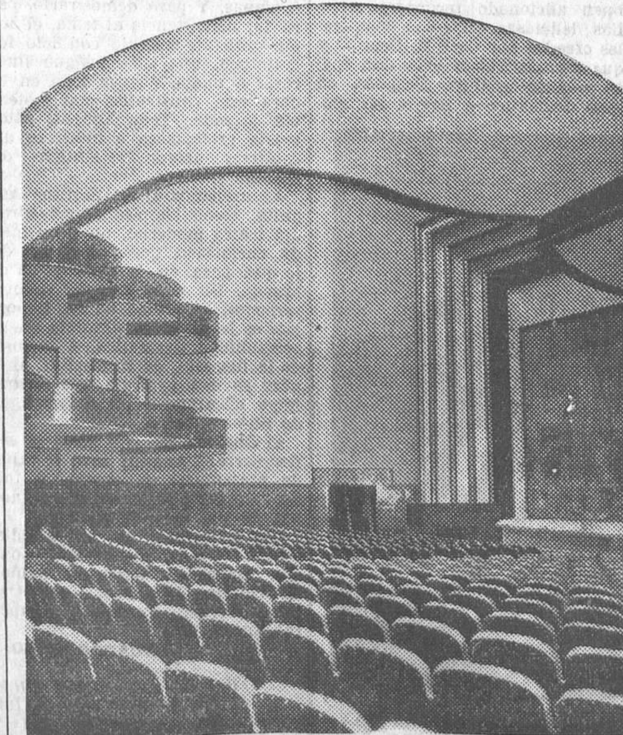
Un aspecto interior del teatro Capitol

el interior, responde a la orientación de las nuevas construcciones, a base de la elegancia en la línea y la sobriedad en el adorno, para producir esa armonía severa y delicada que se completa con lu-