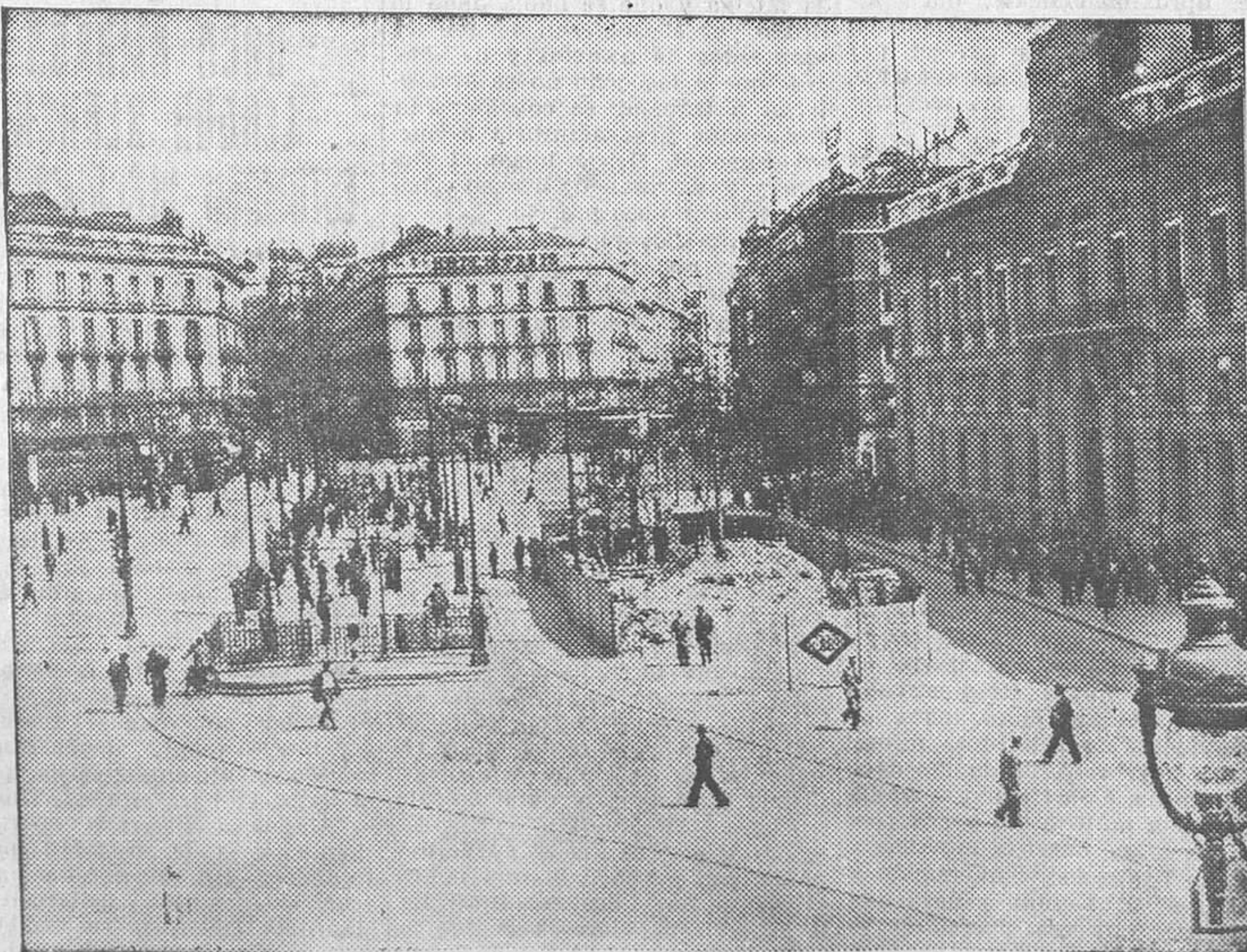
Un aspecto de la Puerta del Sol durante el paro