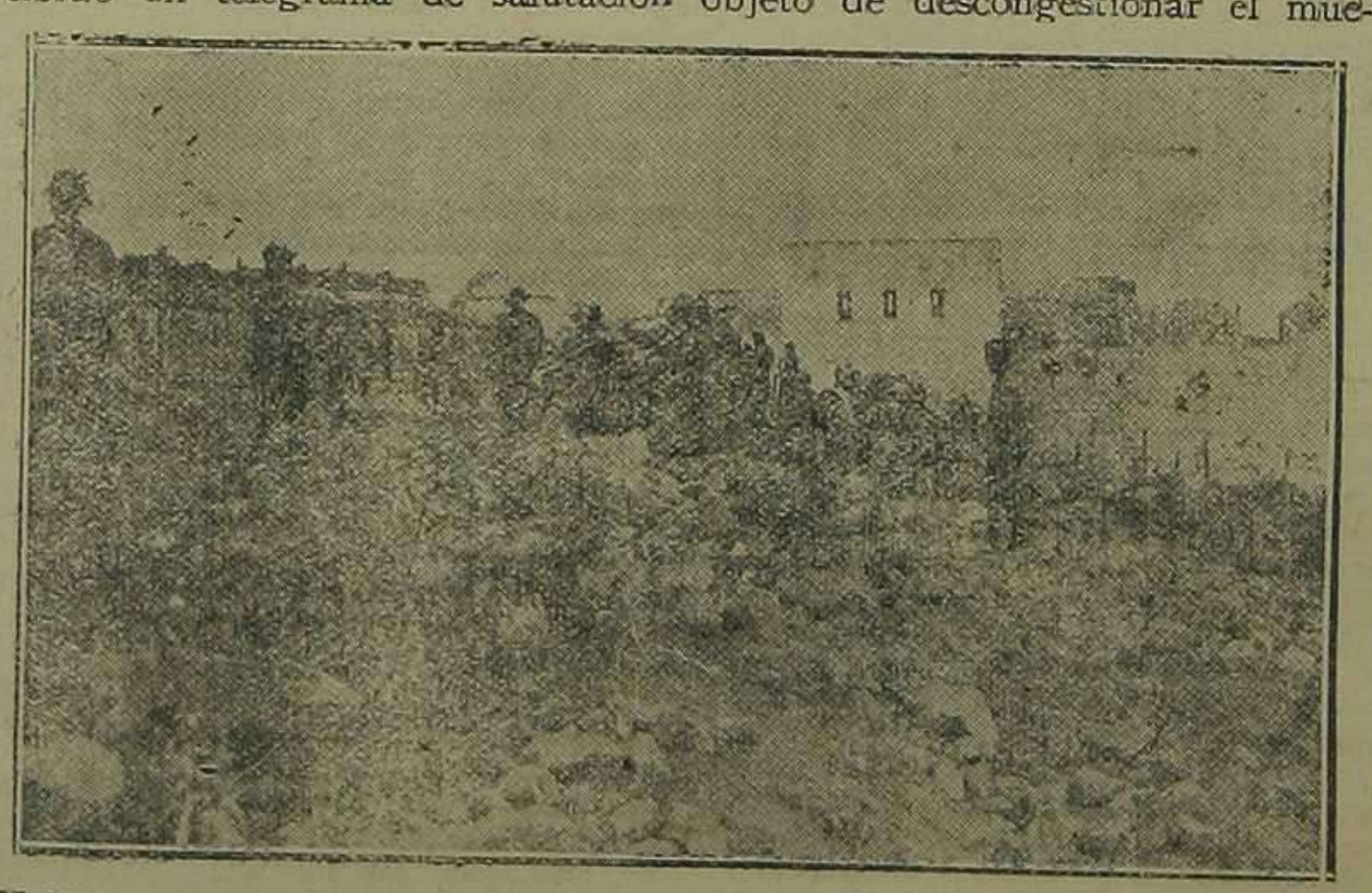
Melilla.—La reconquista de Atlaten. Vista del campamento en el momento de poseerlas nuestras tropas de él.

Salutación Madrid.—El señor Cierva ha recibido un telegrama de salutación