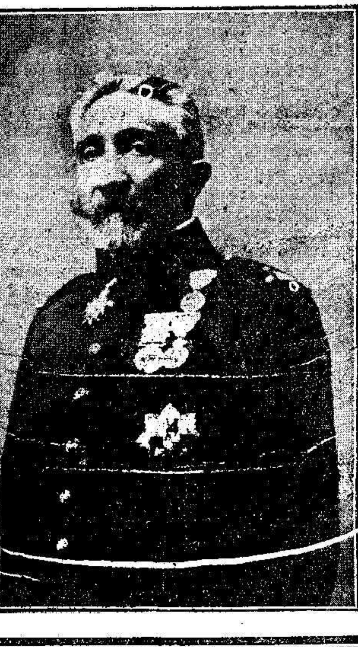
El Excmo. Sr. Comandante General de Ceuta,