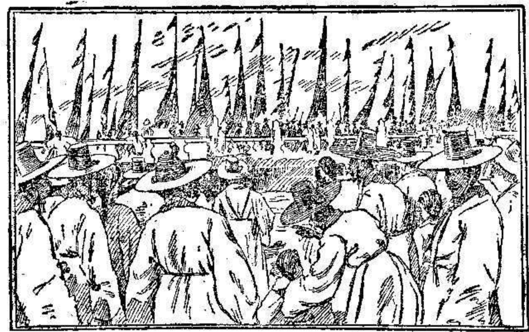
El rey de Corea dirigiéndose procesionalmente á una fiesta religiosa.

Este poderoso y progresivo imperio de Oriente, se dispone á recoger muy en breve uno de los más apetecidos y provechosos frutos de sus victorias de 1894 sobre China y de las que obtuvo peleando contra Rusia en las campañas de 1904-1905.