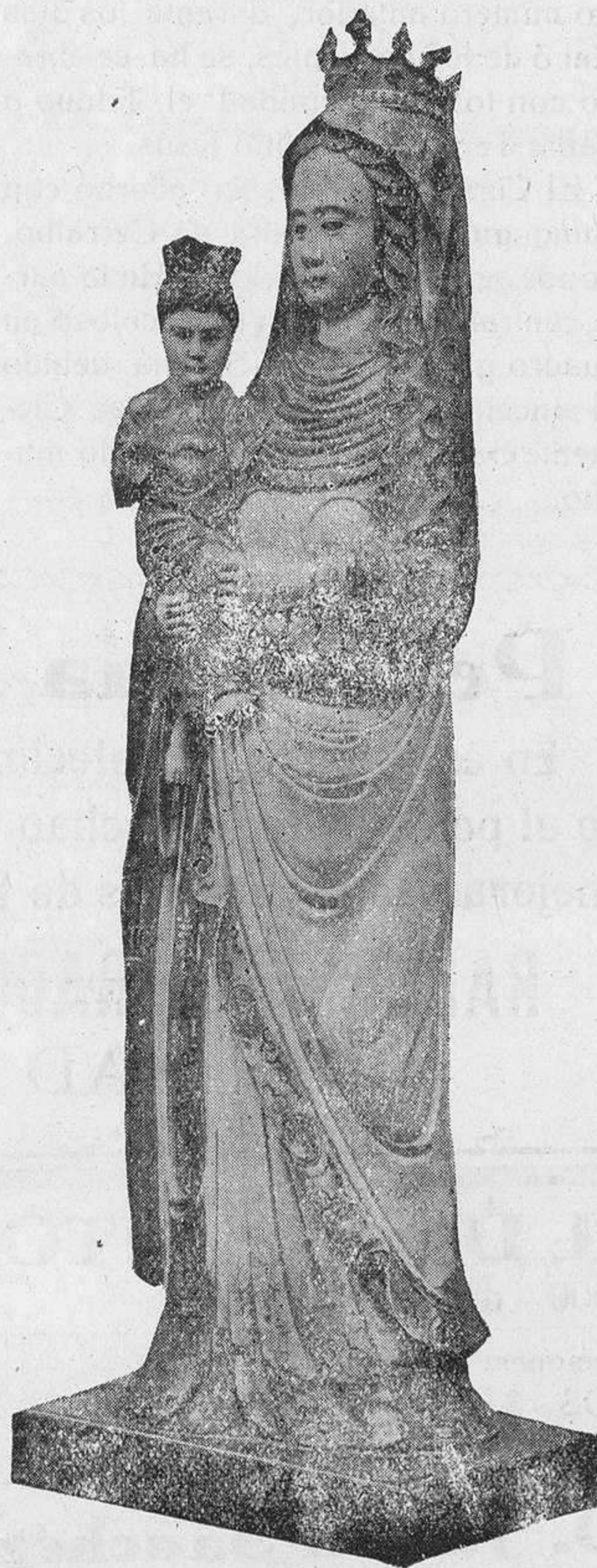
C. Rodrigo.--Imagen de marfil, del Santo Hospital de la Pasión.

Este insigne sociólogo pronunció una admirable conferencia sobre el marxismo. Con palabra fácil, con elo-