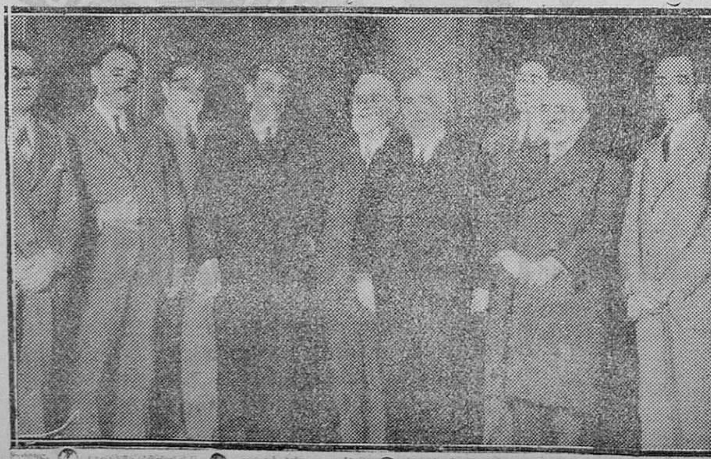
MADRID. — Palacio del Senado. — La comisión de Responsabilidades de Jaca, que acordó disolverse por falta de razón legal y jurídica

Precio del ejemplar: 1'50 ptas. Véndese en la Librería de MANUEL SINTES ROTGER, plaza Pablo Iglesias número 17, Mahón.