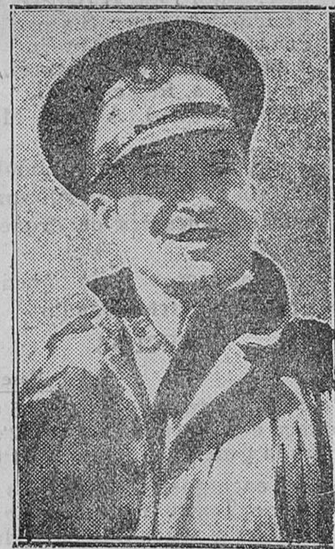
El ex sargento Fulgencio Batista, actual jefe del Ejército cubano, que presidió el Consejo de Guerra contra los militares sublevados contra Grau Sanmartín