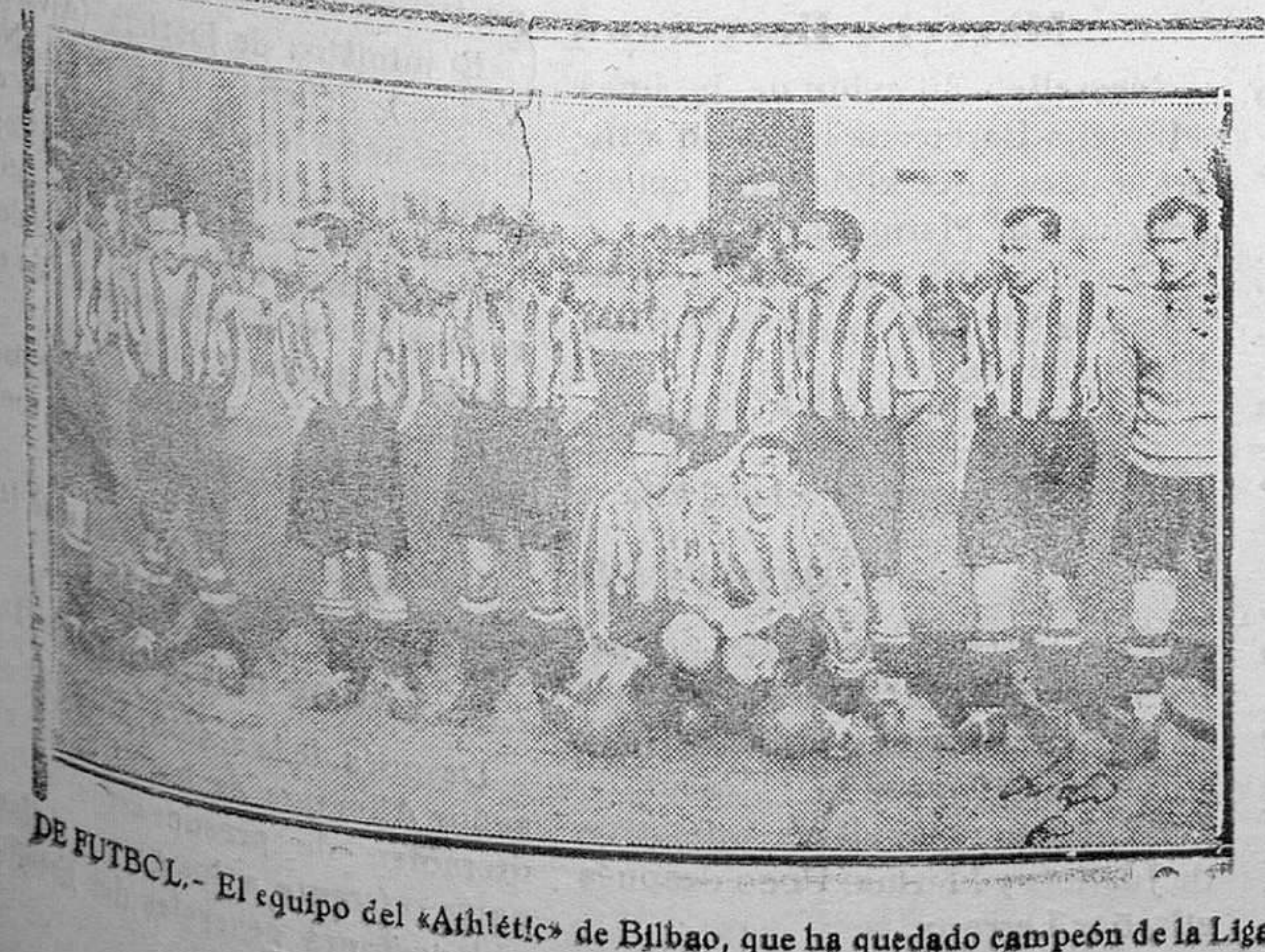
DE FUTBOL.—El equipo del «Athletic» de Bilbao, que ha quedado campeón de la Liga

una república federal, «que no necesite de guardias de Asalto y de Guardia Civil para sostenerse», sino que la sostengan los propios ciudadanos. Pimgallano puro y de las mil y una noches. Es una lástima que se pierda el tiempo en cosas parecidas, teniendo a su alcance la cuatratura del círculo, que es mucho más programa político y de más porvenir.